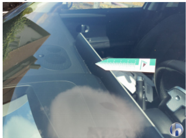
1. Windschutzscheibe Gebrauchsspuren - Ohne Reparatur