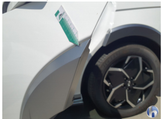
3. Tür Hinten - Links Gebrauchsspuren - Ohne Reparatur