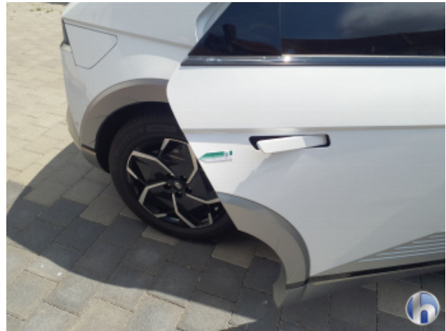
2. Tür Hinten - Rechts Kratzer - Smart Repair