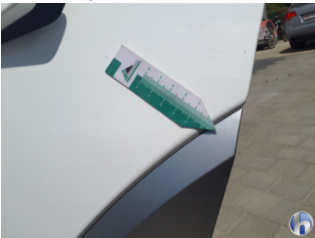
3. Tür Hinten - Links Gebrauchsspuren - Ohne Reparatur