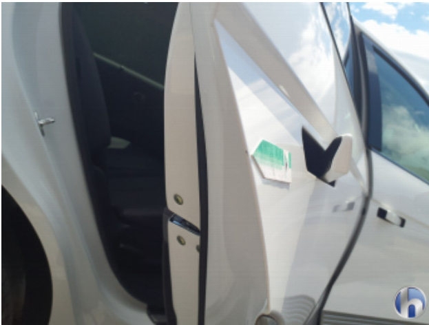
2. Tür Hinten - Rechts Kratzer - Smart Repair