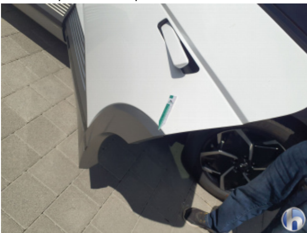
3. Tür Hinten - Links Gebrauchsspuren - Ohne Reparatur