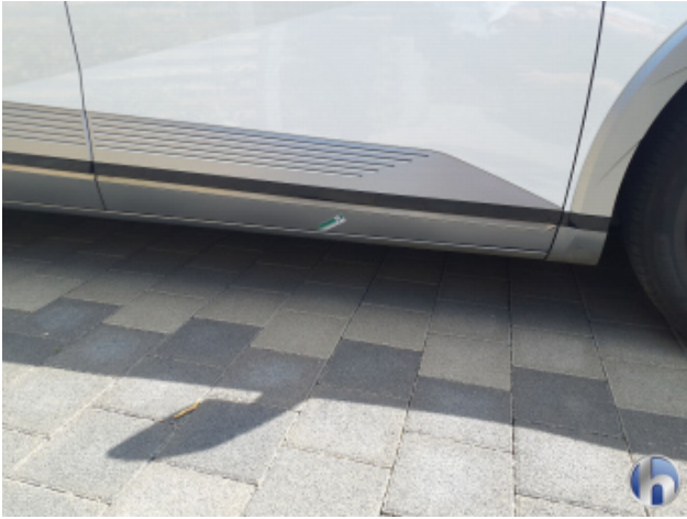
4. Schweller - Rechts Gebrauchsspuren - Ohne Reparatur