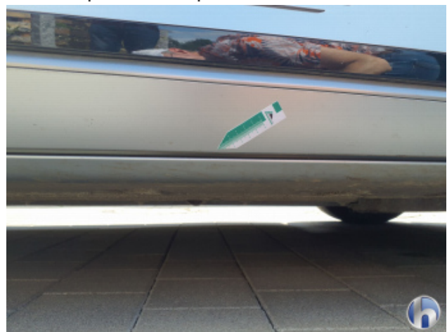
4. Schweller - Rechts Gebrauchsspuren - Ohne Reparatur