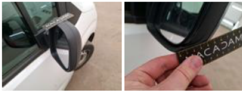
Boitier rétroviseur ext D, Cassé, E - Remplacer