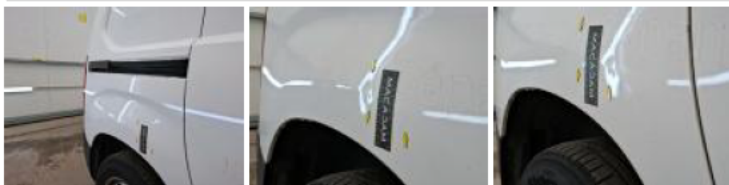
Porte coulissante D, Bosse(s) et griffe(s), LI - Réparer et peindre (complet)