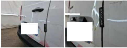
Porte de malle AR D, Bosse(s) et griffe(s), LI - Réparer et peindre (complet)