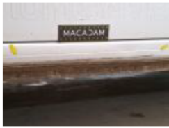
Panneau ARG, Bosse(s), LI - Réparer et peindre (complet)