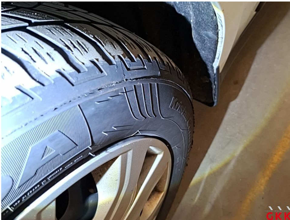
Bild 23 Reifen, vorn links und rechts, einseitig abgefahren, ersetzen