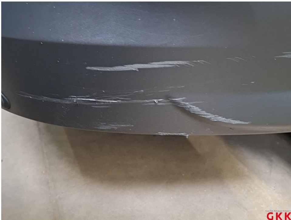
Bild 37 Stoßfänger hinten, Verkleidung -unlackiert-, beschädigt, ersetzen