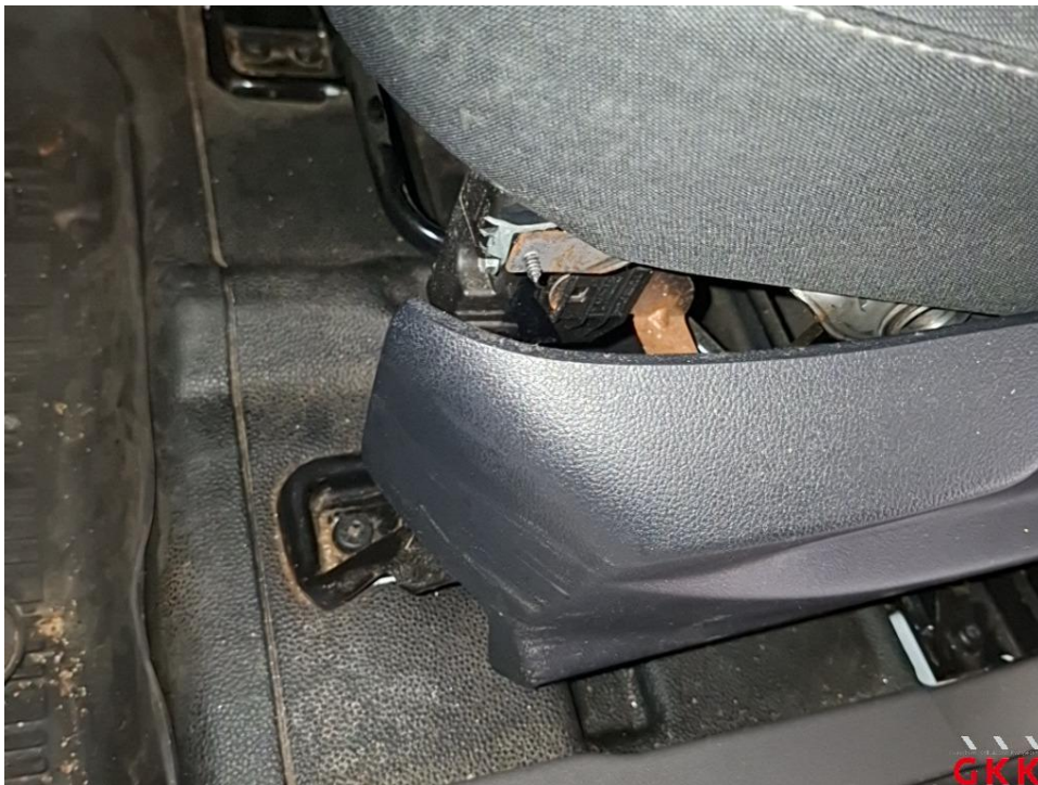
Bild 18 Sitz vorne links, Verkleidung, beschädigt, ersetzen