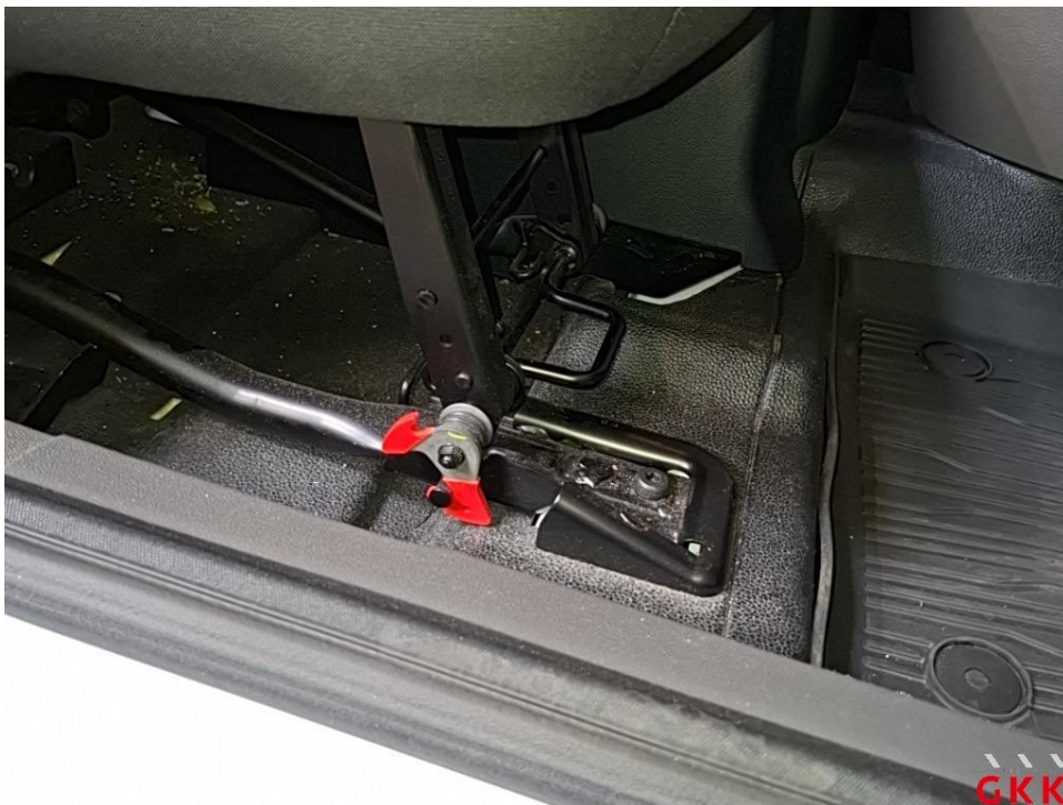
Bild 16 Sitz vorne rechts, Verkleidung, fehlt, ersetzen