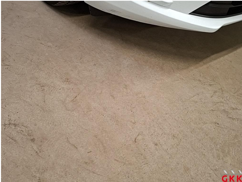
Bild 28 Stoßfänger vorne, Verkleidung unterhalb -lackiert-, verkratzt, lackieren