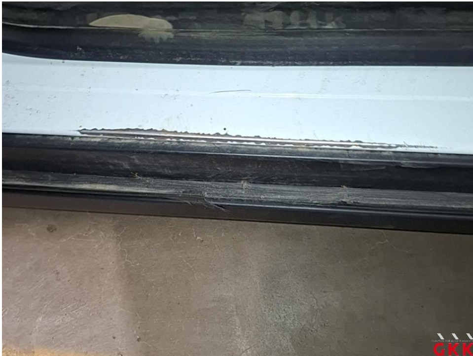
Bild 34 Tür vorne links, Einstieg, verkratzt, lackieren