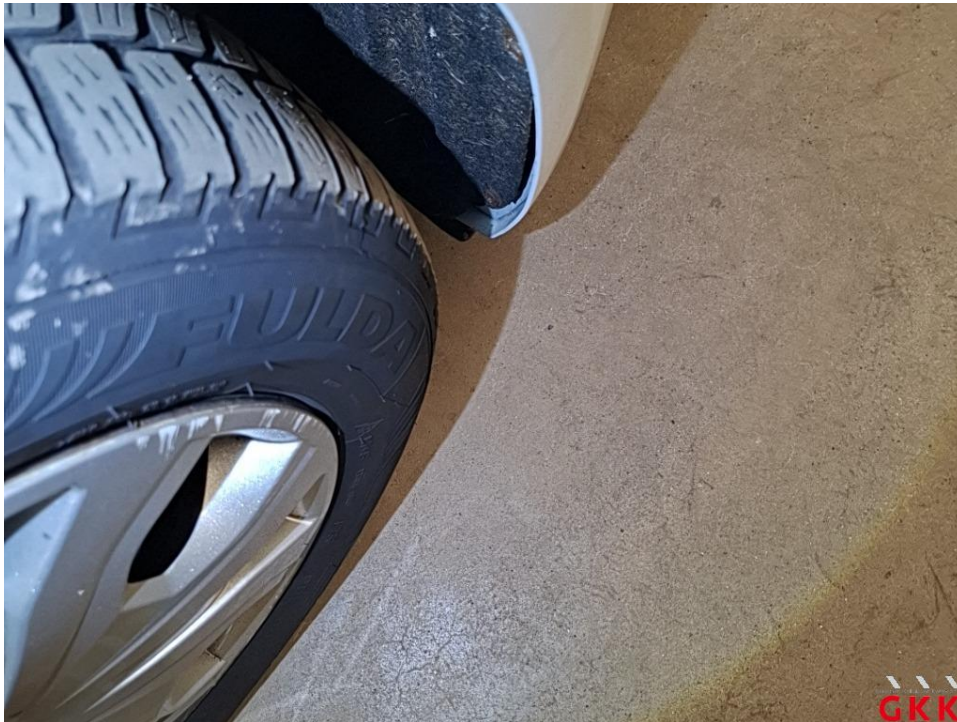
Bild 22 Reifen, vorn links und rechts, einseitig abgefahren, ersetzen