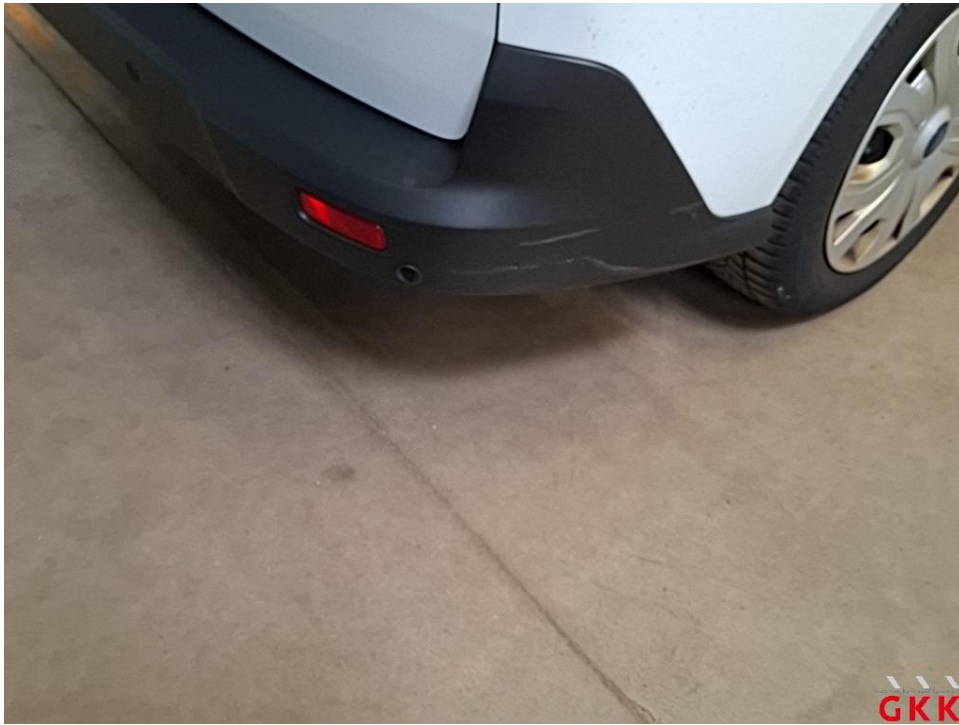
Bild 36 Stoßfänger hinten, Verkleidung -unlackiert-, beschädigt, ersetzen