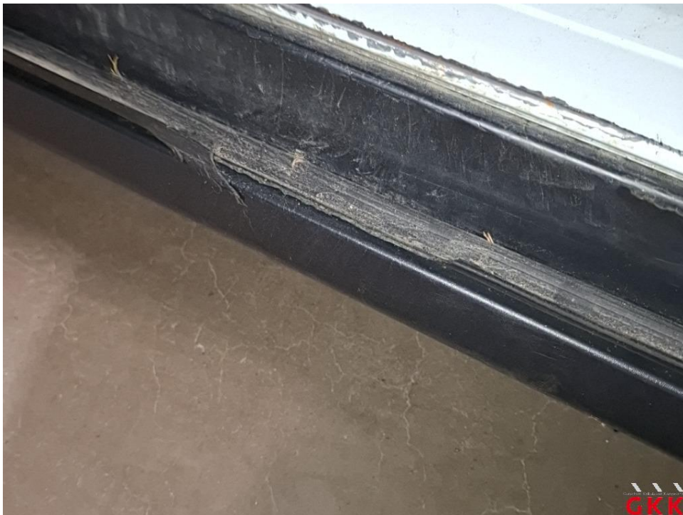
Bild 35 Tür vorne links, Dichtung -Einstieg-, beschädigt, ersetzen