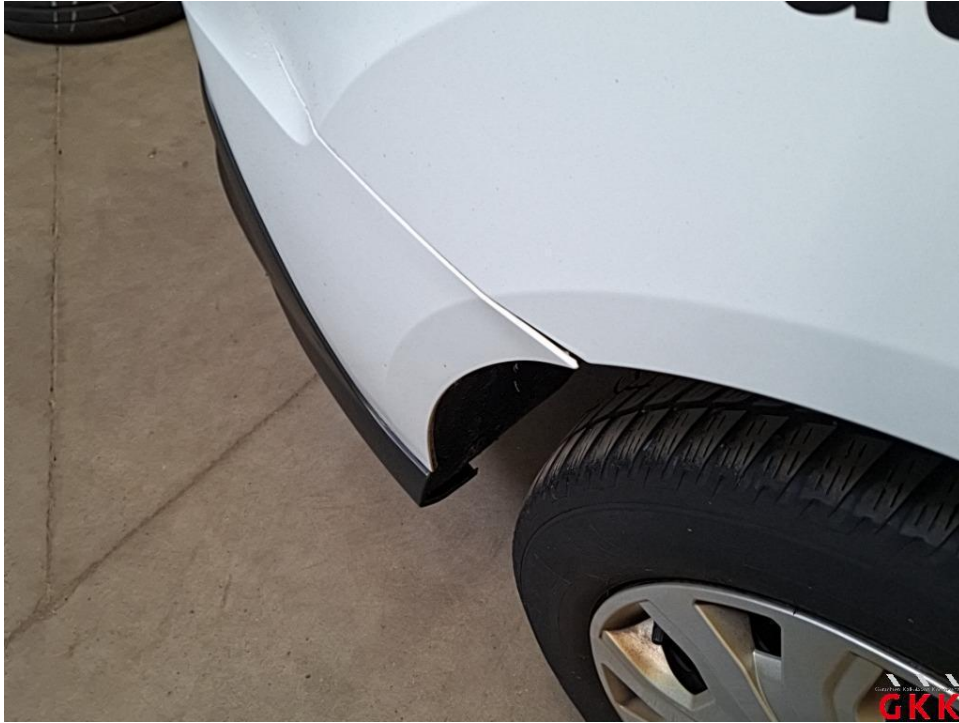
Bild 40 Stoßfänger hinten, Ecke rechts -lackiert-, beschädigt, ersetzen