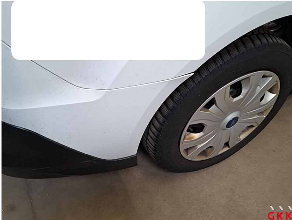
Bild 38 Stoßfänger hinten, Ecke rechts -lackiert-, beschädigt, ersetzen