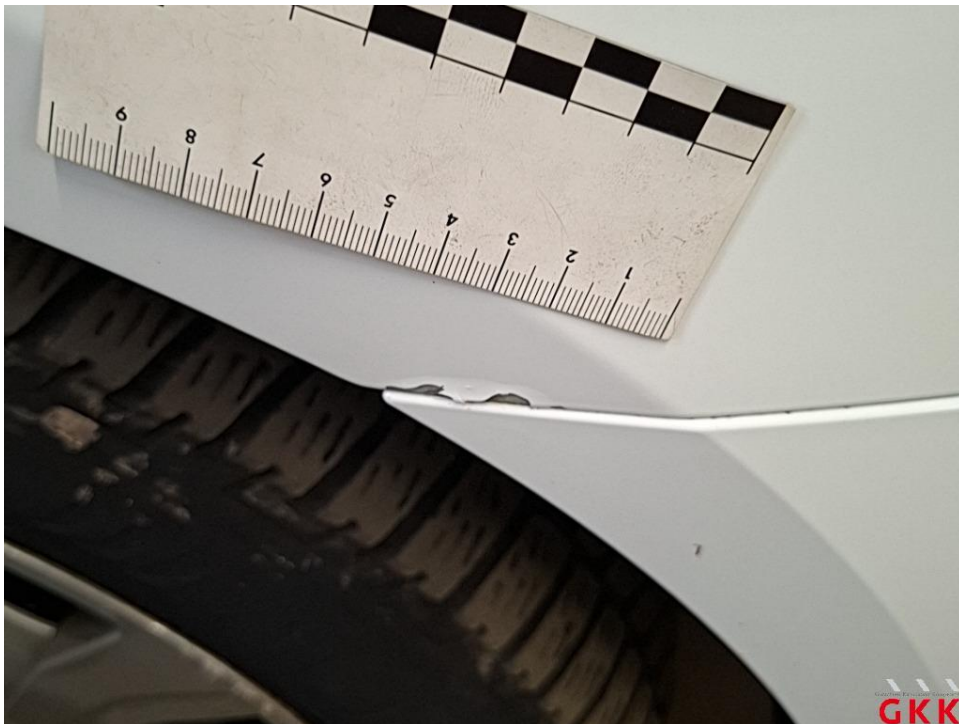
Bild 27 Kotflügel vorne rechts, Lackierung abgeplatzt, lackieren