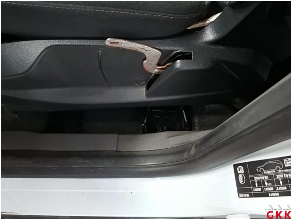
Bild 19 Griff Sitz Höhenverstellung V.L., fehlt, ersetzen