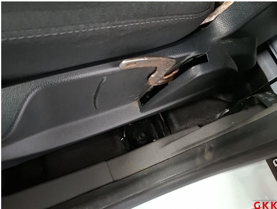
Bild 20 Griff Sitz Höhenverstellung V.L., fehlt, ersetzen