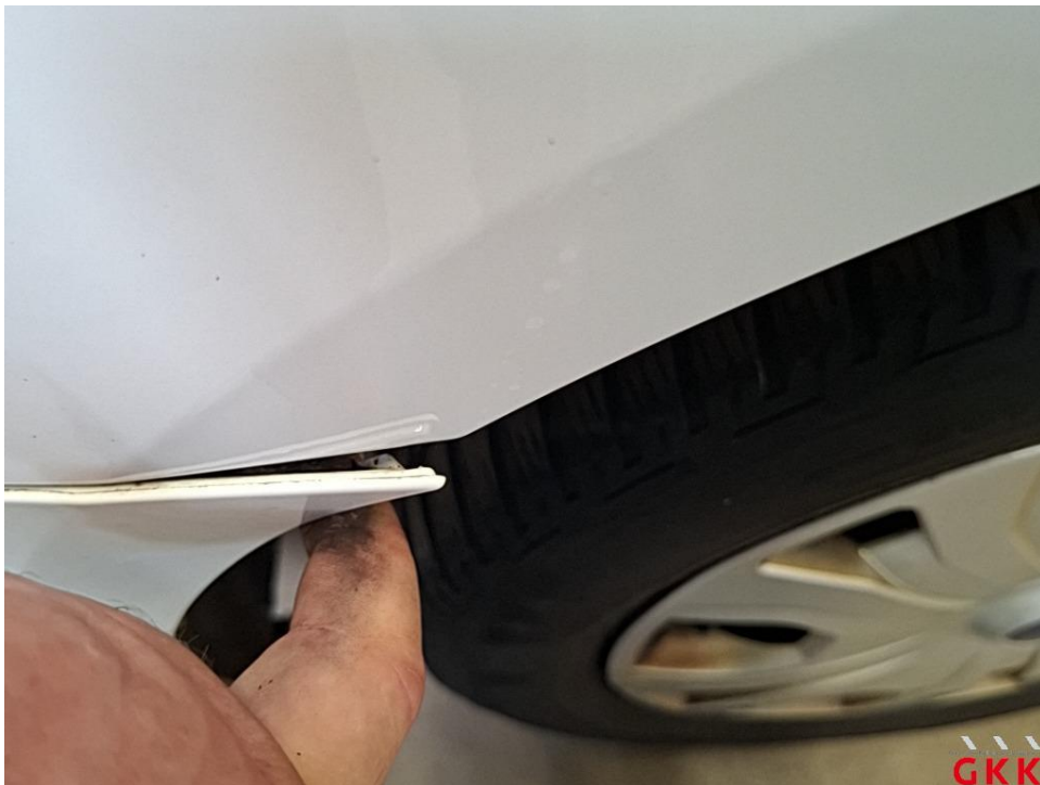
Bild 39 Stoßfänger hinten, Ecke rechts -lackiert-, beschädigt, ersetzen