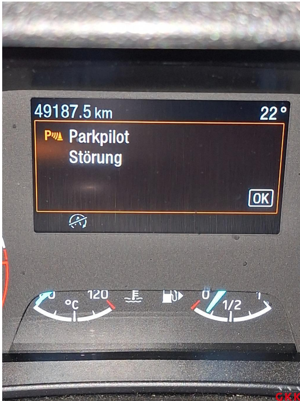
Bild 21 Parkpilot, defekt, prüfen