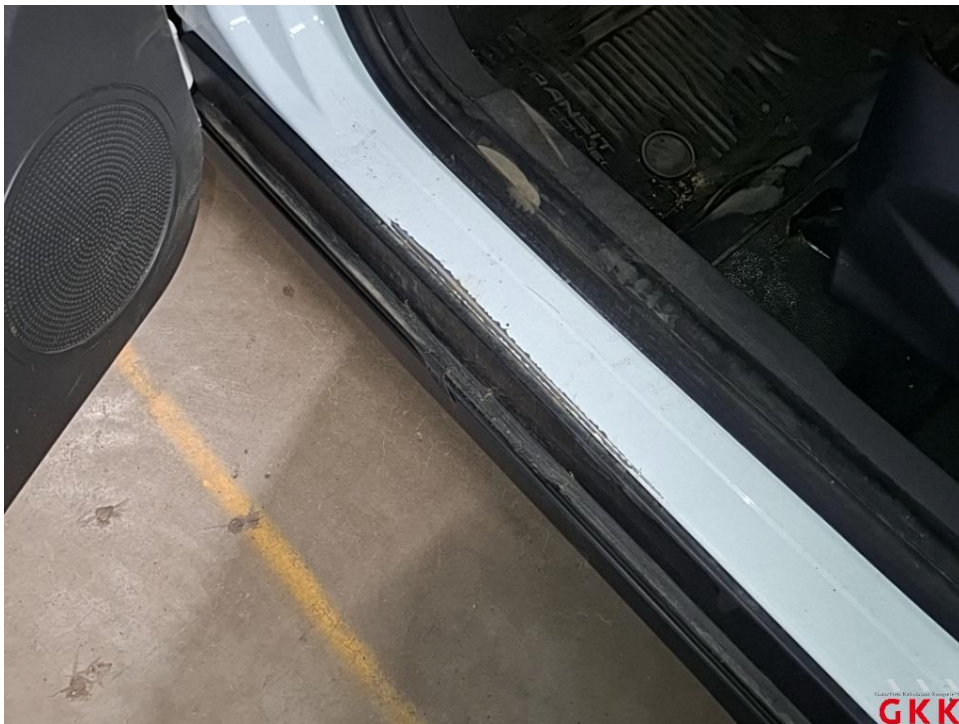
Bild 33 Tür vorne links, Einstieg, verkratzt, lackieren