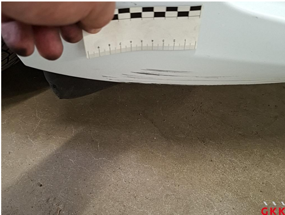
Bild 29 Stoßfänger vorne, Verkleidung unterhalb -lackiert-, verkratzt, lackieren