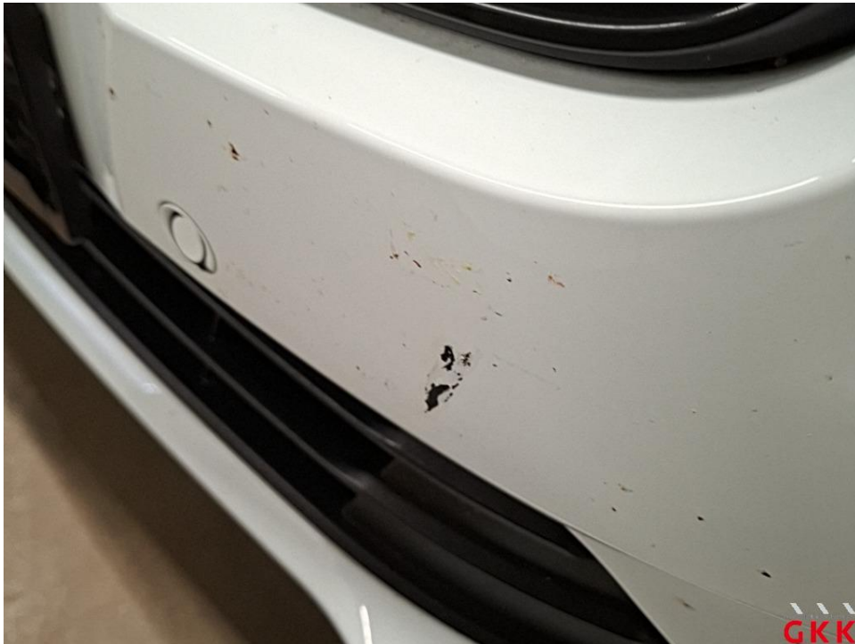
Bild 30 Stoßfänger vorne, Verkleidung unterhalb -lackiert-, verkratzt, lackieren