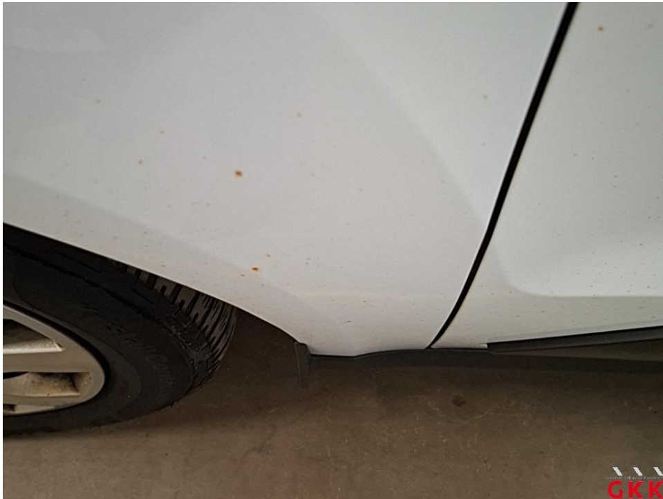
Bild 32 Fahrzeug, außen, Industriestaubanhaftung / Flugrost, aufbereiten