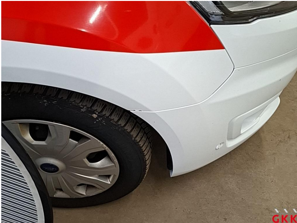
Bild 26 Kotflügel vorne rechts, Lackierung abgeplatzt, lackieren