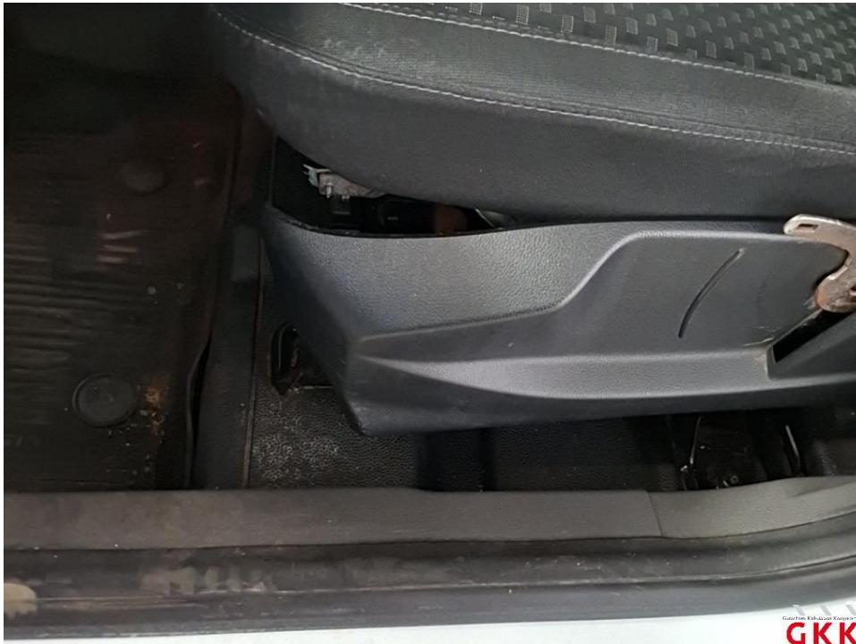
Bild 17 Sitz vorne links, Verkleidung, beschädigt, ersetzen