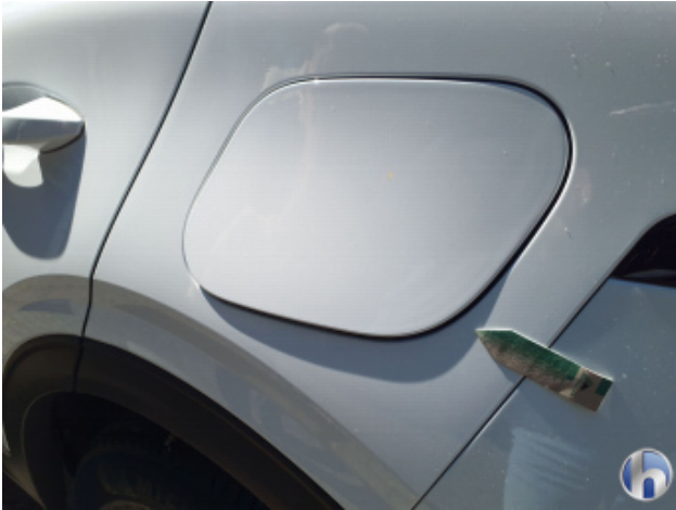
3. Tankklappe Beschädigt - Erneuern