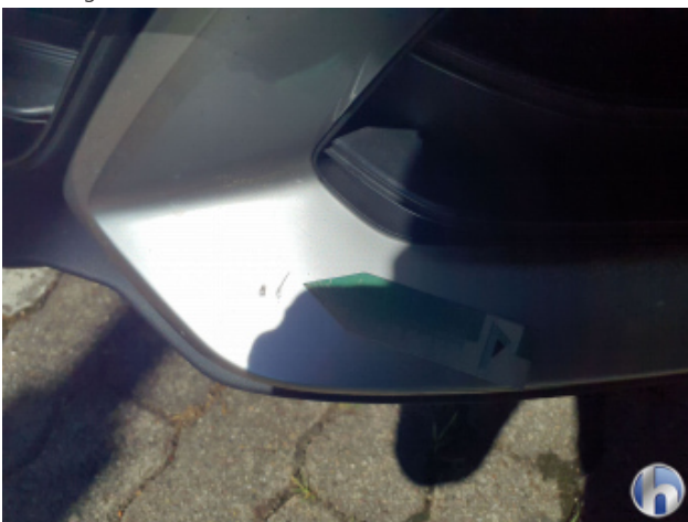
1. Stoßfänger Vorne Kratzer - Smart Repair