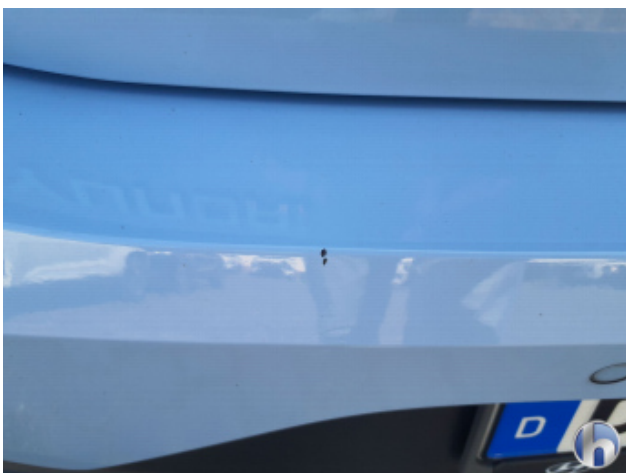
1. Stoßfänger Hinten Gebrauchsspuren - Ohne Reparatur