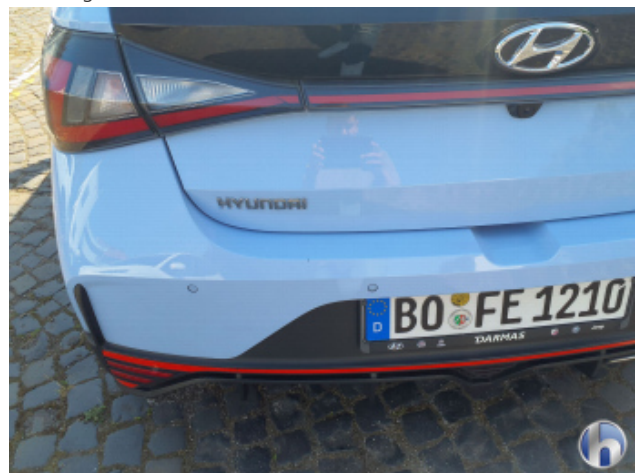
1. Stoßfänger Hinten Gebrauchsspuren - Ohne Reparatur