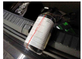
Räder - Haltbarkeitsdatum Tirefit