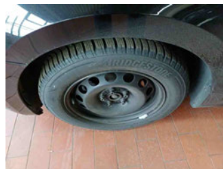
Räder - Rad montiert vorne links