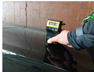
Lackstärke Tür hinten links