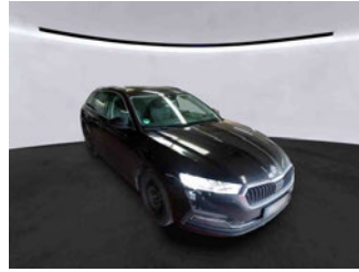
Fahrzeugansicht - diagonal vorne rechts