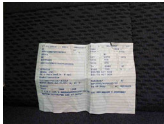
Fahrzeug - abgegebene ZB1