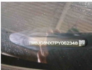
Fahrzeug - Typenschild/Fahrgestellnummer