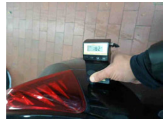
Lackstärke Seitenwand hinten links