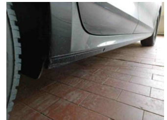
Seitenansicht - Schweller rechts