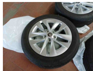
Räder - Rad beiliegend #2