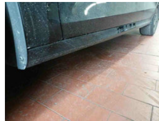
Seitenansicht - Schweller links