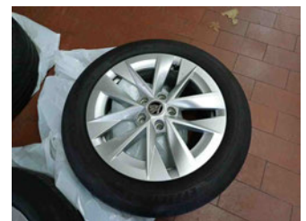
Räder - Rad beiliegend #3