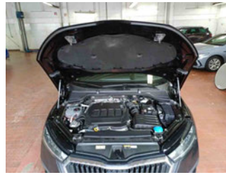
Fahrzeug - Motorraum offen