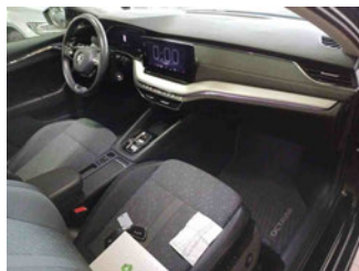
Innenraum - vorne