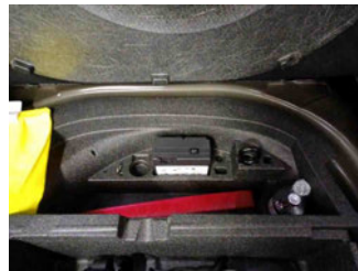
Equipment - Bordwerkzeug