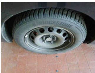
Räder - Rad montiert hinten rechts