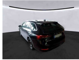
Fahrzeugansicht - diagonal hinten links