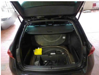
Innenraum - Kofferraum