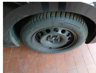
Räder - Rad montiert vorne rechts