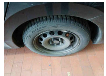
Räder - Rad montiert hinten links