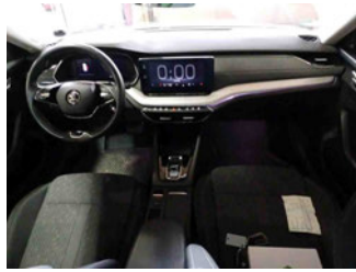
Innenraum - Mittelkonsole