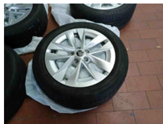
Räder - Rad beiliegend #1