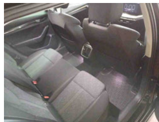
Innenraum - hinten