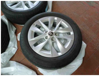
Räder - Rad beiliegend #4