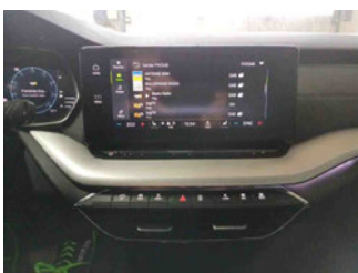
Innenraum - Navigationsgerät/Radio