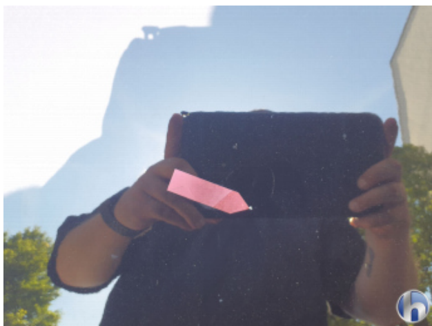
3. Motorhaube Gebrauchsspuren - Ohne Reparatur