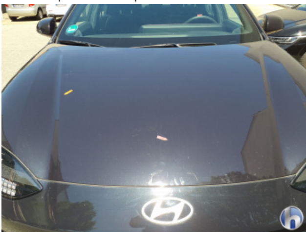
3. Motorhaube Gebrauchsspuren - Ohne Reparatur