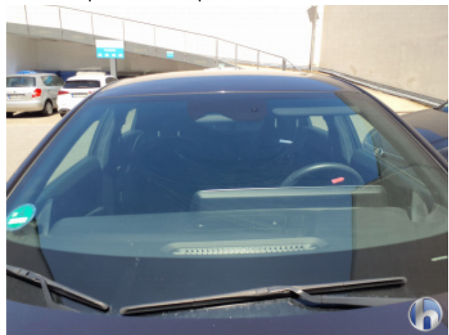
2. Windschutzscheibe Gebrauchsspuren - Ohne Reparatur