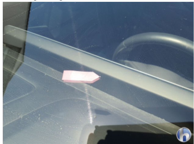
2. Windschutzscheibe Gebrauchsspuren - Ohne Reparatur