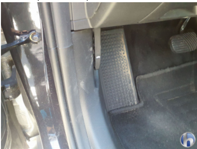
4. Verkleidung Verschmutzt - Reinigen