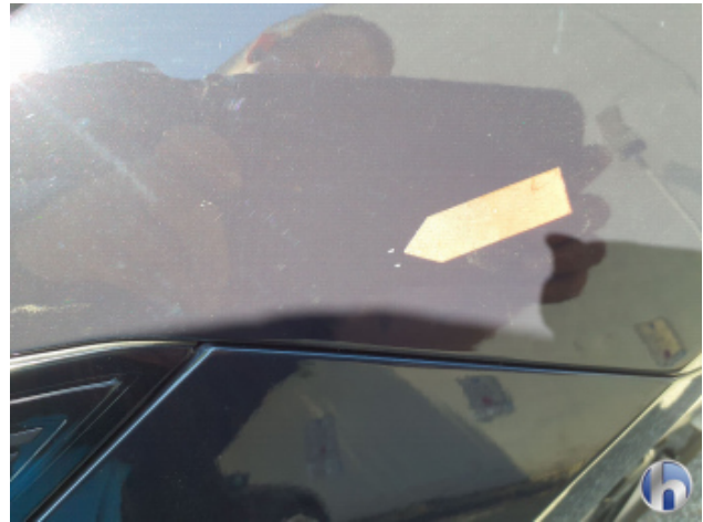
1. Kotflügel Vorne - Links Steinschlag - Auslegen / Polieren