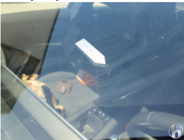
2. Windschutzscheibe Gebrauchsspuren - Ohne Reparatur