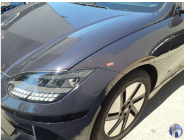
1. Kotflügel Vorne - Links Steinschlag - Auslegen / Polieren