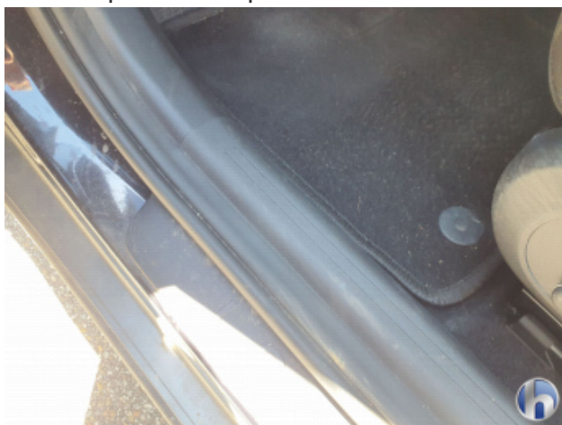
4. Verkleidung Verschmutzt - Reinigen