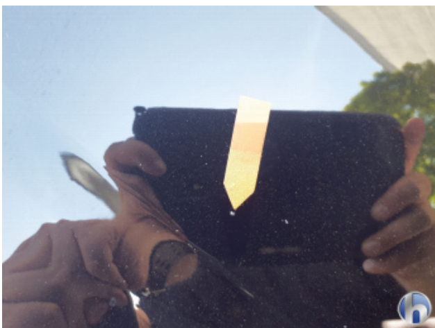
3. Motorhaube Gebrauchsspuren - Ohne Reparatur