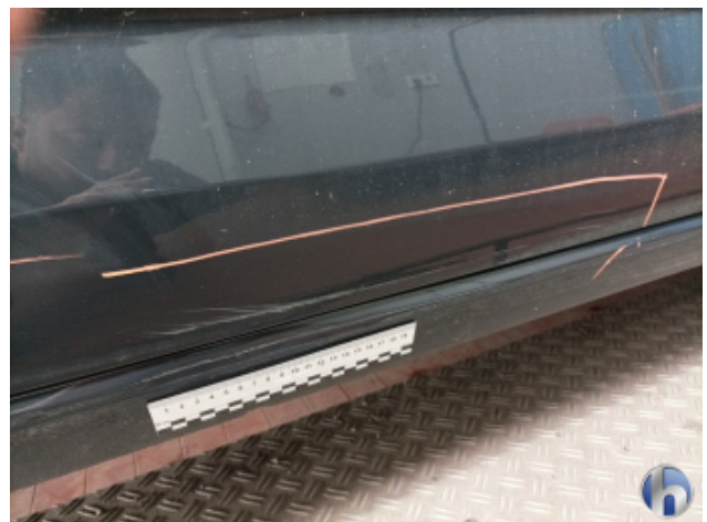
4. Schweller - Rechts Unfallschaden - Lackieren