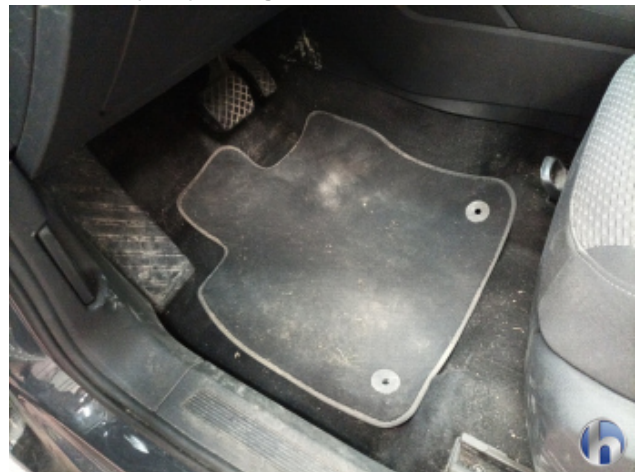
5. Innenraum Verschmutzt (stark) - Reinigen