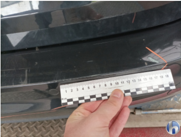
3. Stoßfänger Hinten Kratzer - Smart Repair