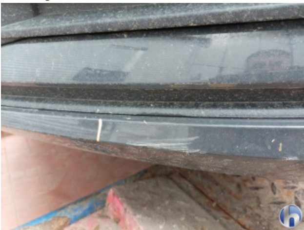
1. Frontspoiler Beschädigt - Erneuern