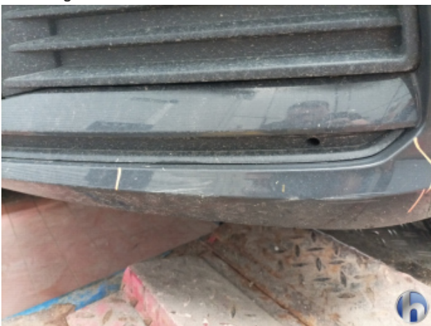
1. Frontspoiler Beschädigt - Erneuern