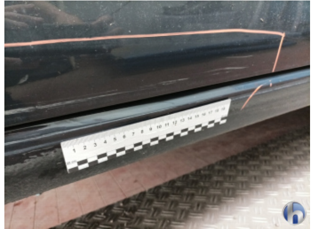
4. Schweller - Rechts Unfallschaden - Lackieren