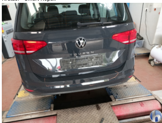
3. Stoßfänger Hinten Kratzer - Smart Repair