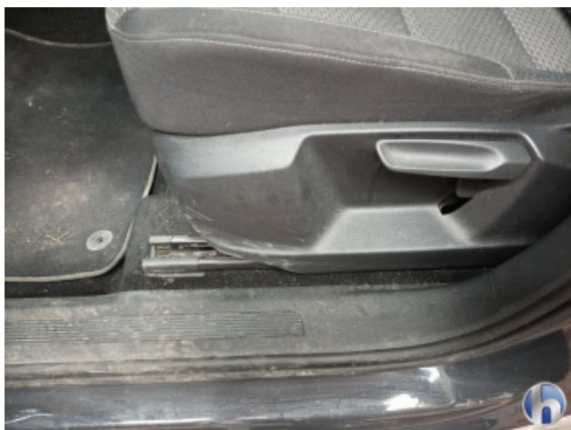
5. Innenraum Verschmutzt (stark) - Reinigen