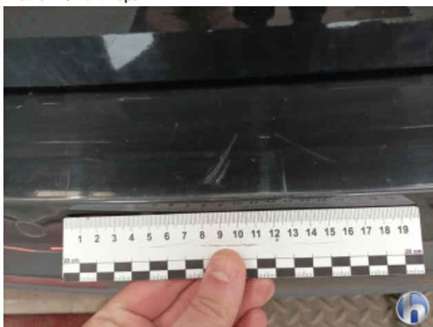
3. Stoßfänger Hinten Kratzer - Smart Repair