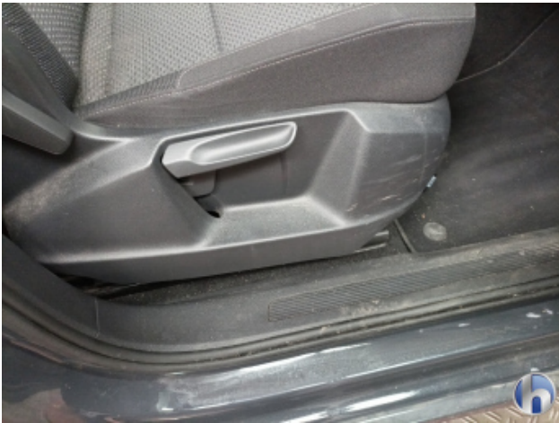
5. Innenraum Verschmutzt (stark) - Reinigen