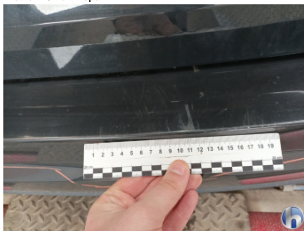
3. Stoßfänger Hinten Kratzer - Smart Repair