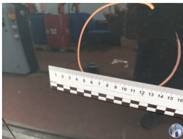
2. Tür Hinten - Links Kratzer - Smart Repair