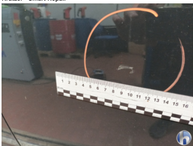
2. Tür Hinten - Links Kratzer - Smart Repair