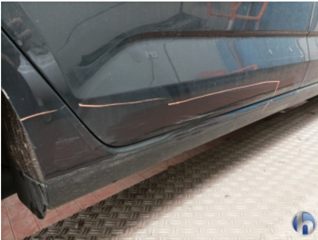
4. Schweller - Rechts Unfallschaden - Lackieren