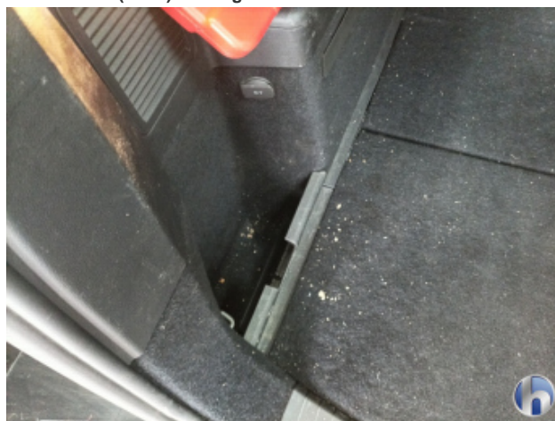
5. Innenraum Verschmutzt (stark) - Reinigen