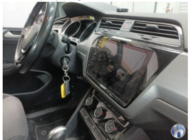
5. Innenraum Verschmutzt (stark) - Reinigen