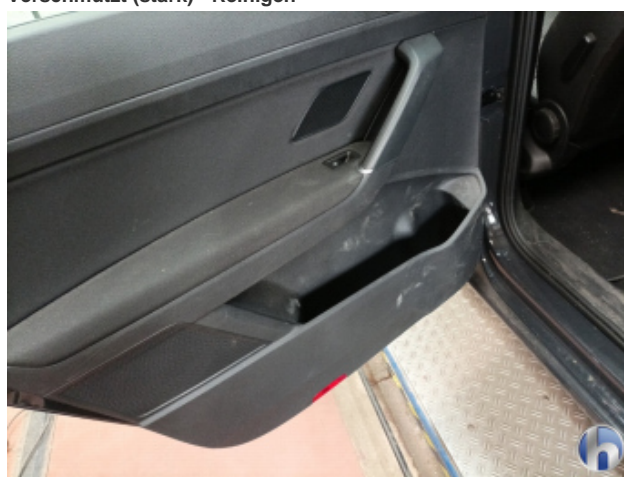
5. Innenraum Verschmutzt (stark) - Reinigen