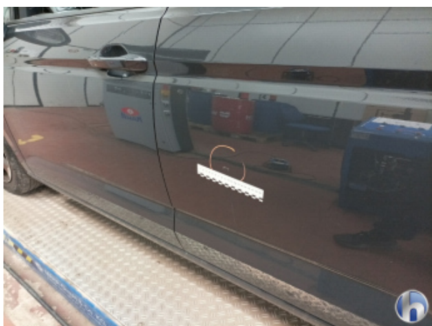
2. Tür Hinten - Links Kratzer - Smart Repair