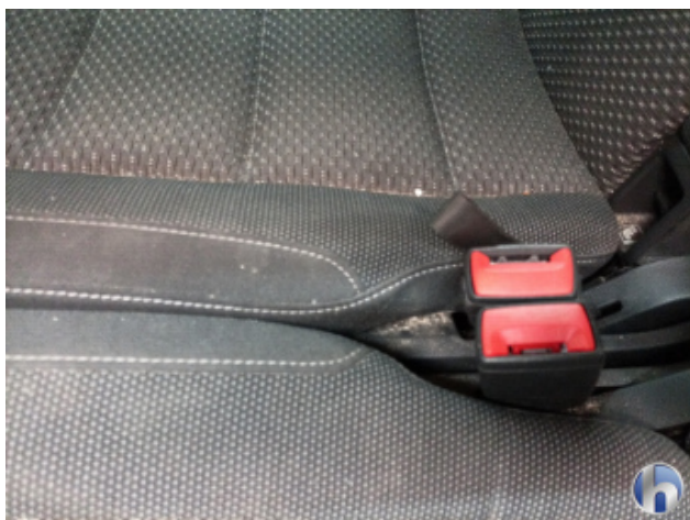
5. Innenraum Verschmutzt (stark) - Reinigen