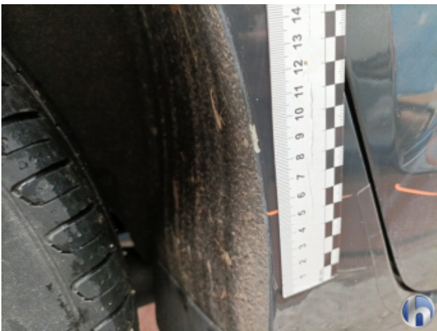
4. Schweller - Rechts Unfallschaden - Lackieren