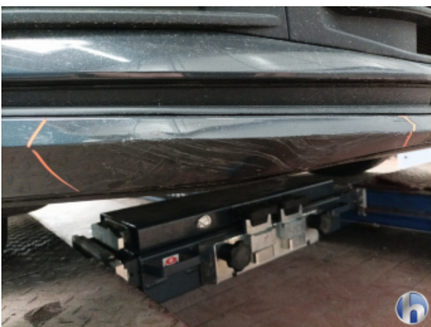
1. Frontspoiler Beschädigt - Erneuern