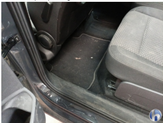
5. Innenraum Verschmutzt (stark) - Reinigen