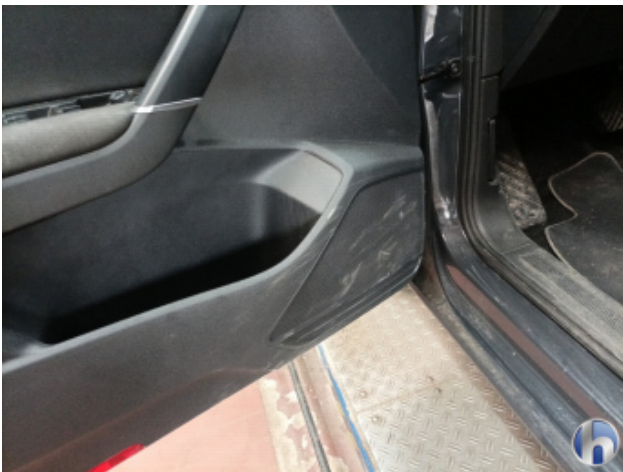
5. Innenraum Verschmutzt (stark) - Reinigen