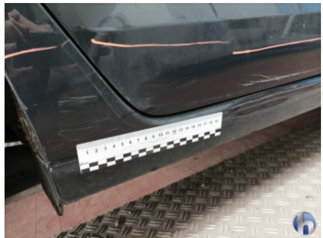
4. Schweller - Rechts Unfallschaden - Lackieren