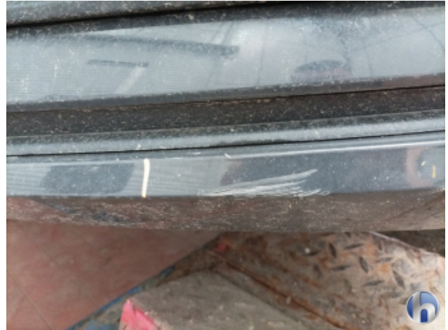
1. Frontspoiler Beschädigt - Erneuern