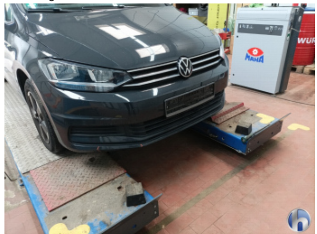
1. Frontspoiler Beschädigt - Erneuern