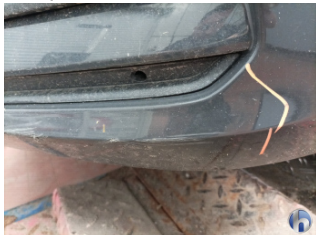
1. Frontspoiler Beschädigt - Erneuern