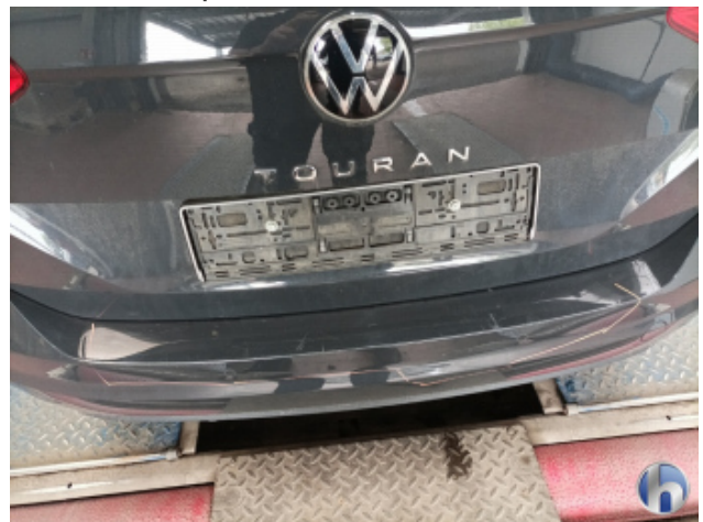
3. Stoßfänger Hinten Kratzer - Smart Repair