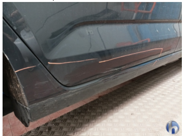
4. Schweller - Rechts Unfallschaden - Lackieren