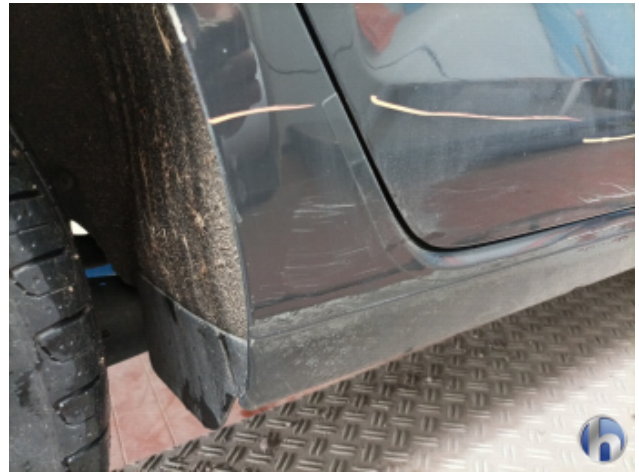
4. Schweller - Rechts Unfallschaden - Lackieren