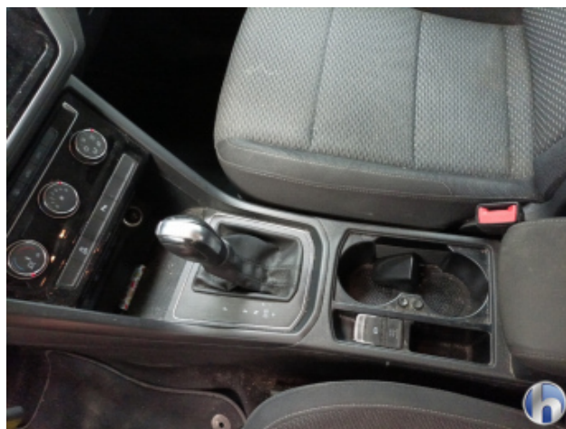
5. Innenraum Verschmutzt (stark) - Reinigen