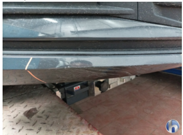
1. Frontspoiler Beschädigt - Erneuern