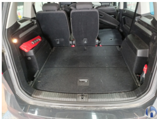
5. Innenraum Verschmutzt (stark) - Reinigen