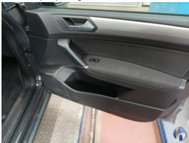
5. Innenraum Verschmutzt (stark) - Reinigen