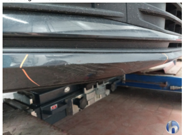
1. Frontspoiler Beschädigt - Erneuern