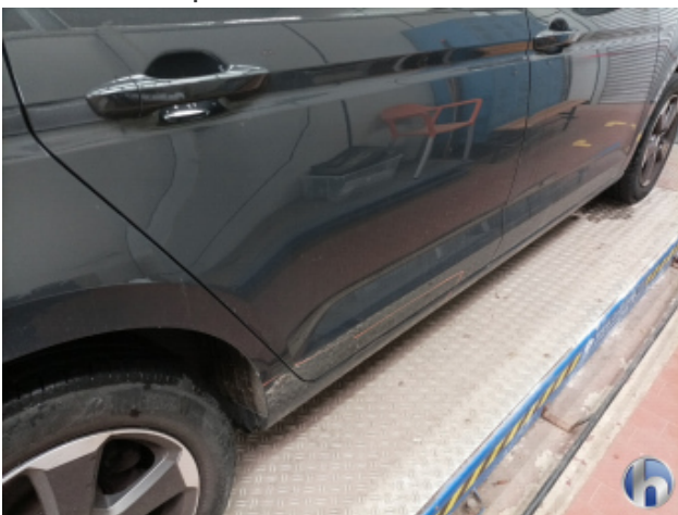
4. Schweller - Rechts Unfallschaden - Lackieren