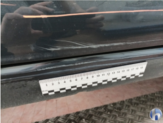
4. Schweller - Rechts Unfallschaden - Lackieren