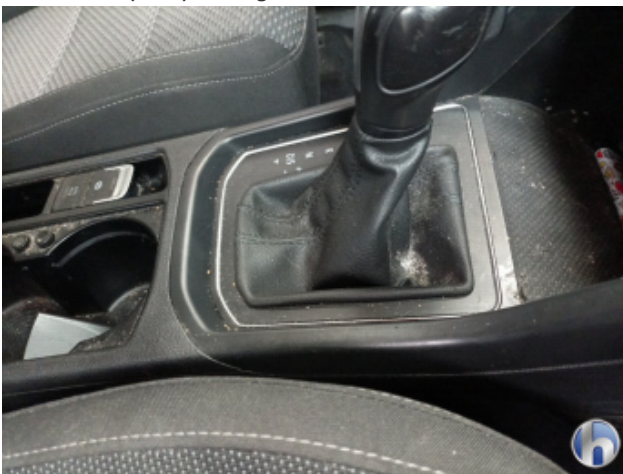
5. Innenraum Verschmutzt (stark) - Reinigen