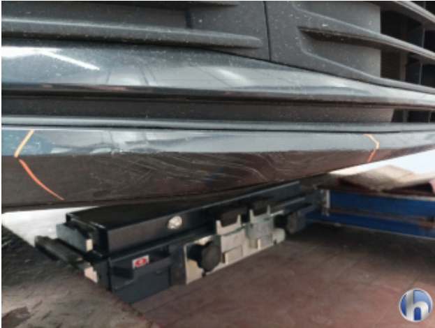
1. Frontspoiler Beschädigt - Erneuern