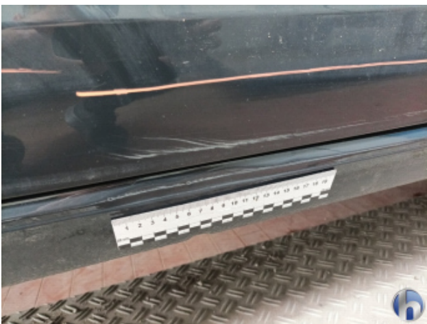
4. Schweller - Rechts Unfallschaden - Lackieren