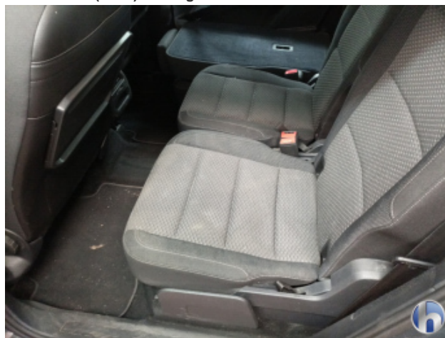
5. Innenraum Verschmutzt (stark) - Reinigen