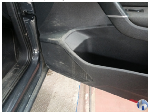
5. Innenraum Verschmutzt (stark) - Reinigen