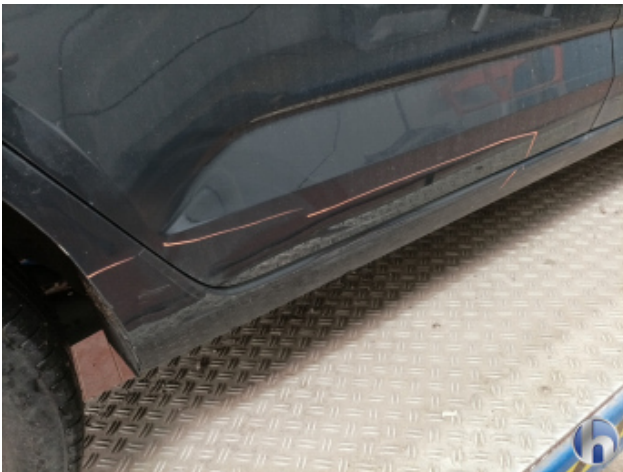
4. Schweller - Rechts Unfallschaden - Lackieren