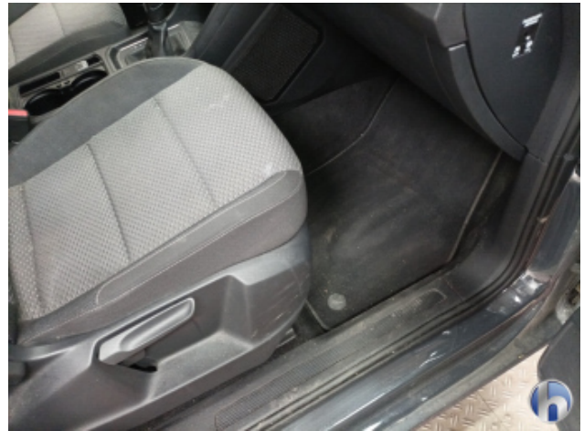
5. Innenraum Verschmutzt (stark) - Reinigen