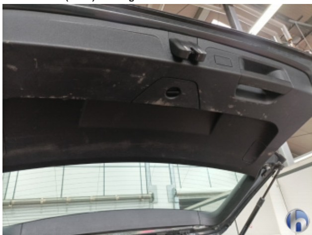
5. Innenraum Verschmutzt (stark) - Reinigen