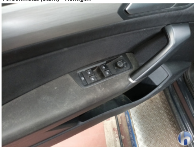
5. Innenraum Verschmutzt (stark) - Reinigen