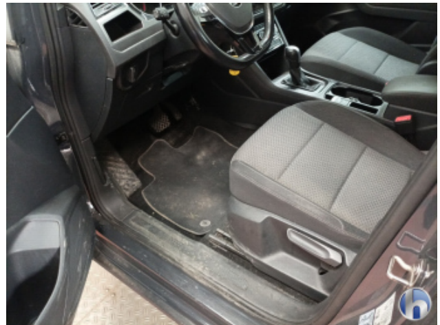
5. Innenraum Verschmutzt (stark) - Reinigen