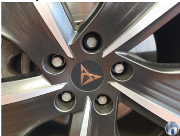
4. Originaler Radschrauben Fehlt - Erneuern