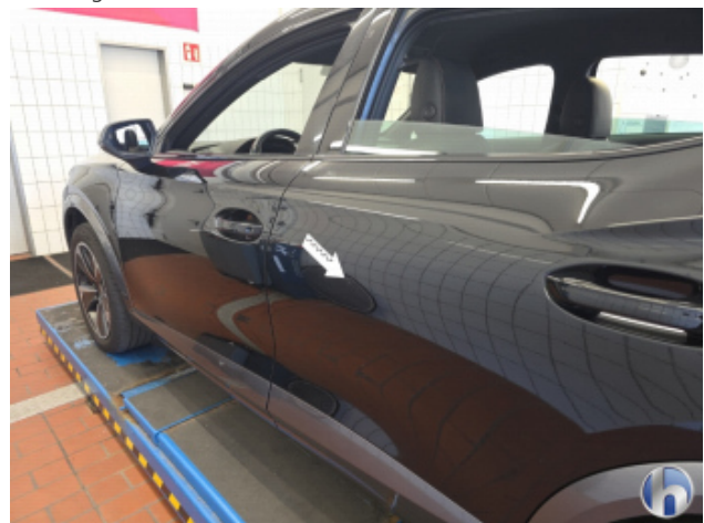
1. Tür Hinten - Links Gebrauchsspuren - Ohne Reparatur