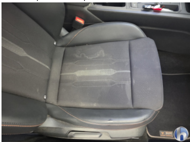
3. Sitz - Vorne - Rechts: Kissen Fleck - Reinigen