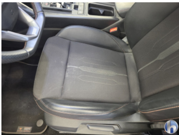
2. Sitz - Vorne - Links: Kissen Fleck - Reinigen