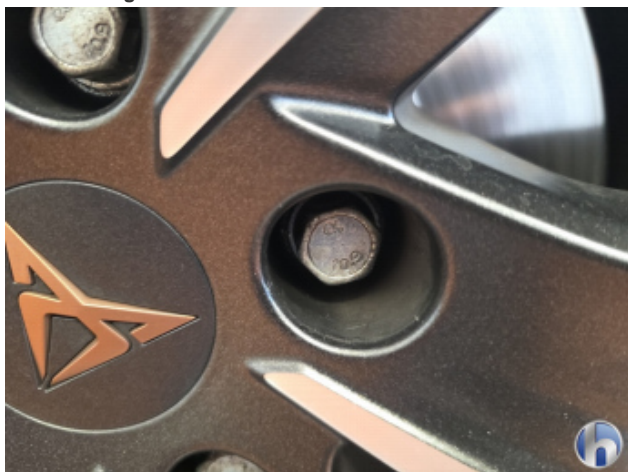
4. Originaler Radschrauben Fehlt - Erneuern