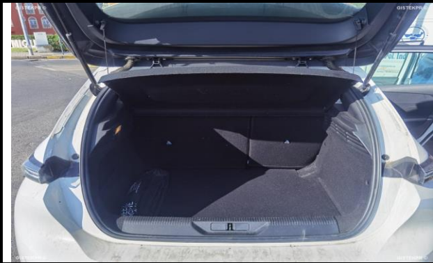
FMLTRO IMG 20250702 100451