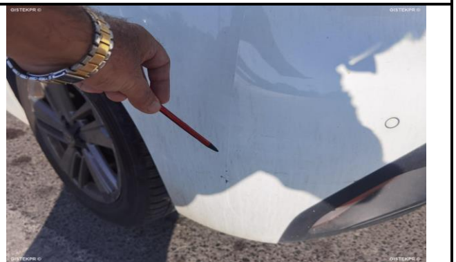
Foto daños externos 1