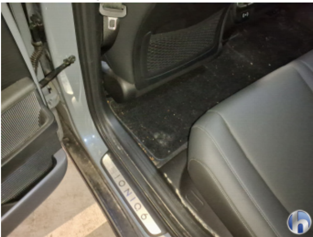
4. Innenraum Verschmutzt - Reinigen