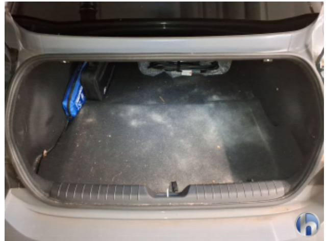
4. Innenraum Verschmutzt - Reinigen