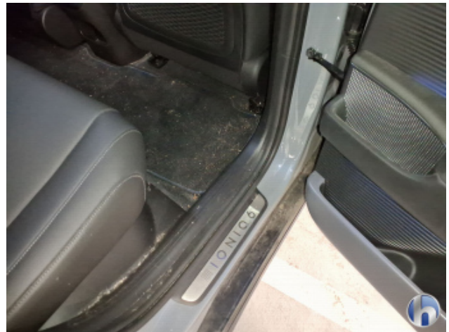
4. Innenraum Verschmutzt - Reinigen