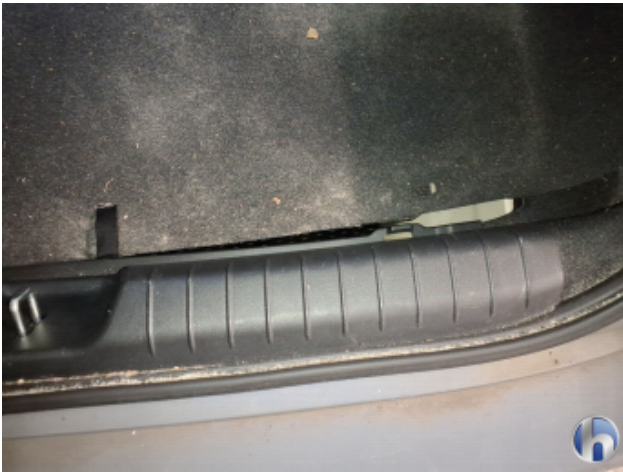
4. Innenraum Verschmutzt - Reinigen