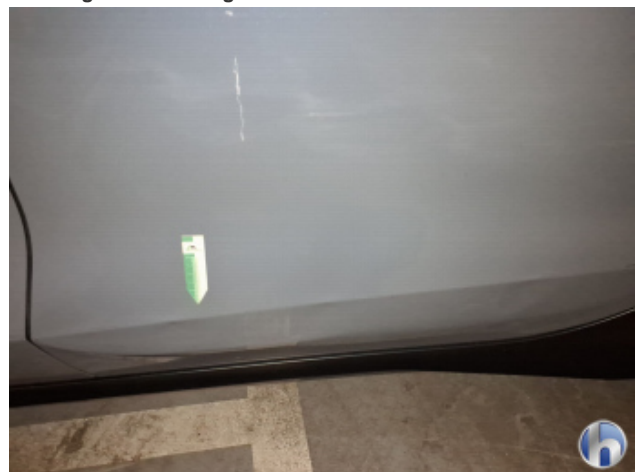
7. Seitenschaden Fahrerseite Unsachgemäß Instandgesetzt - Siehe Kalkulation