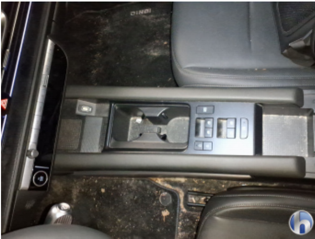
4. Innenraum Verschmutzt - Reinigen