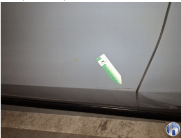
7. Seitenschaden Fahrerseite Unsachgemäß Instandgesetzt - Siehe Kalkulation