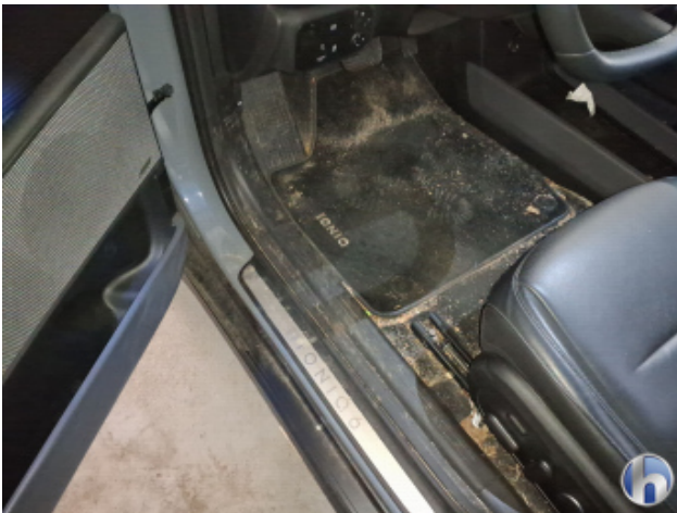
4. Innenraum Verschmutzt - Reinigen