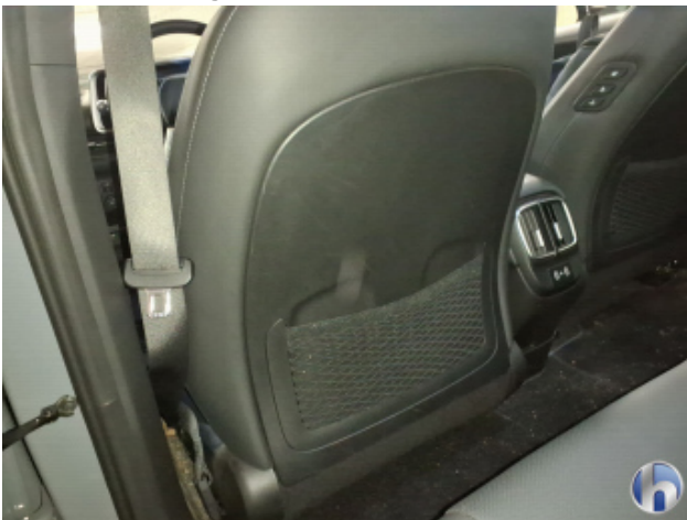
4. Innenraum Verschmutzt - Reinigen