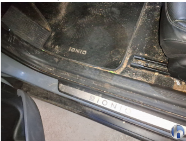
4. Innenraum Verschmutzt - Reinigen