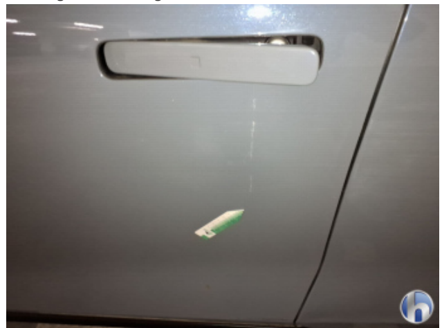
7. Seitenschaden Fahrerseite Unsachgemäß Instandgesetzt - Siehe Kalkulation