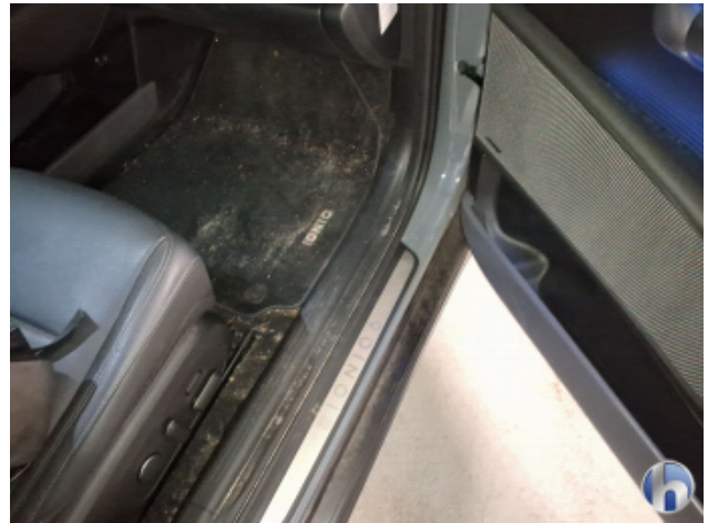
4. Innenraum Verschmutzt - Reinigen