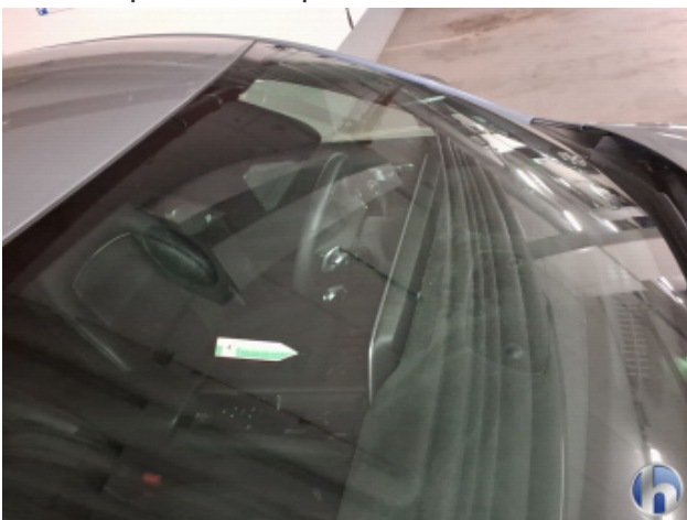
3. Windschutzscheibe Gebrauchsspuren - Ozonbehandlung