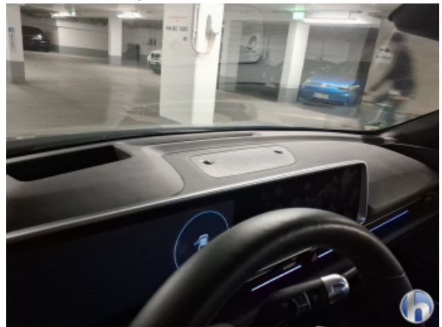
4. Innenraum Verschmutzt - Reinigen