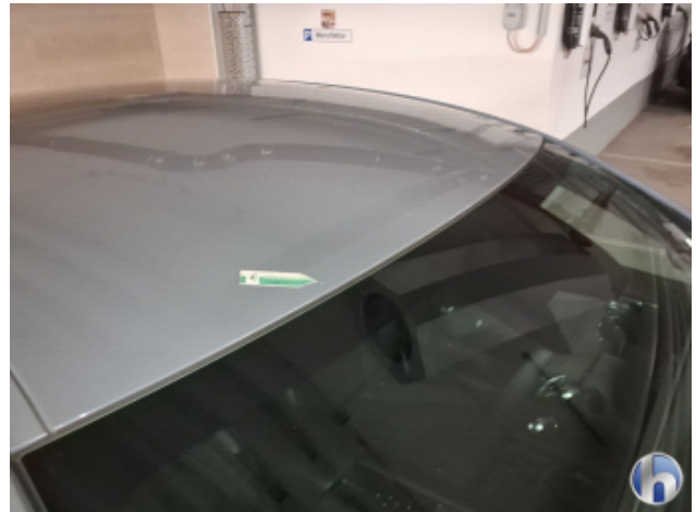
1. Dach Gebrauchsspuren - Ohne Reparatur