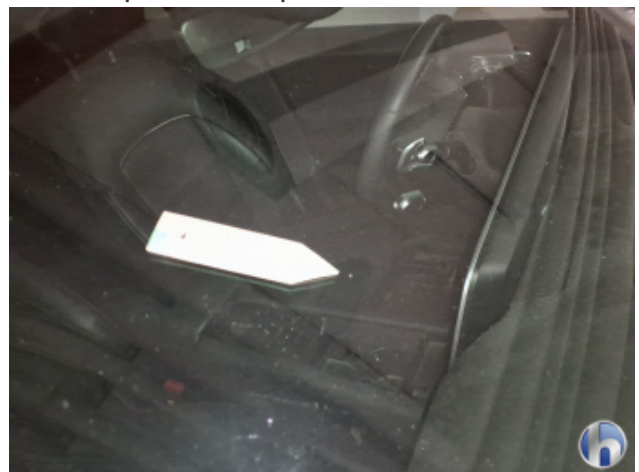
3. Windschutzscheibe Gebrauchsspuren - Ozonbehandlung