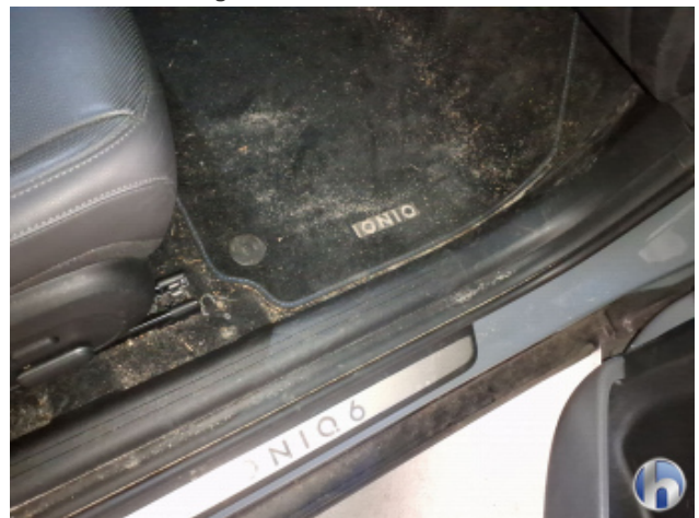
4. Innenraum Verschmutzt - Reinigen