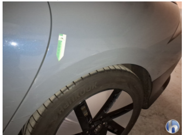
7. Seitenschaden Fahrerseite Unsachgemäß Instandgesetzt - Siehe Kalkulation