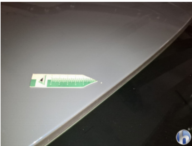
1. Dach Gebrauchsspuren - Ohne Reparatur