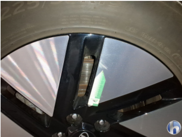
7. Seitenschaden Fahrerseite Unsachgemäß Instandgesetzt - Siehe Kalkulation