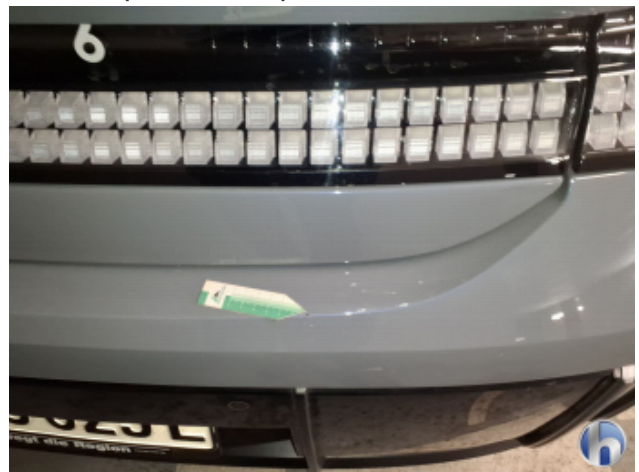
2. Stoßfänger Hinten Gebrauchsspuren - Ohne Reparatur