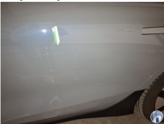
7. Seitenschaden Fahrerseite Unsachgemäß Instandgesetzt - Siehe Kalkulation