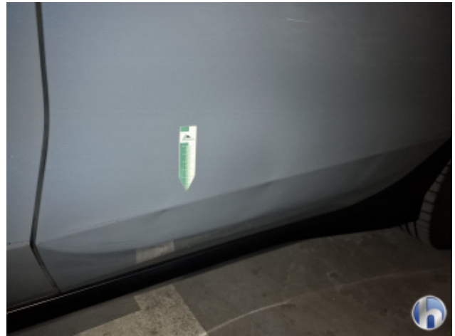
7. Seitenschaden Fahrerseite Unsachgemäß Instandgesetzt - Siehe Kalkulation