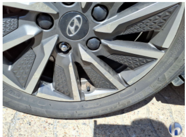
6. Felge Hinten - Rechts Korrodiert - Smart Repair