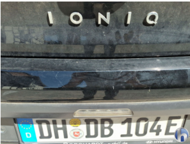
2. Stoßfänger Hinten Kratzer - Lackieren