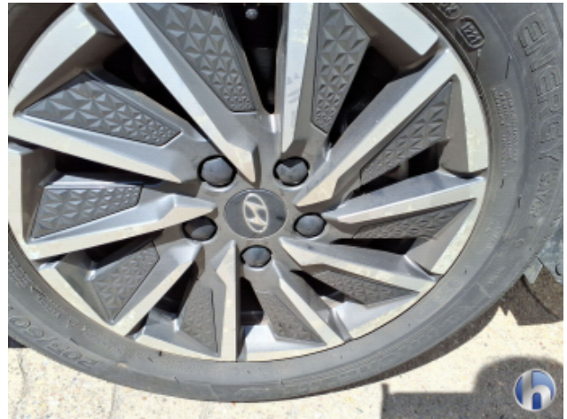
3. Felge Vorne - Rechts Korrodiert - Smart Repair