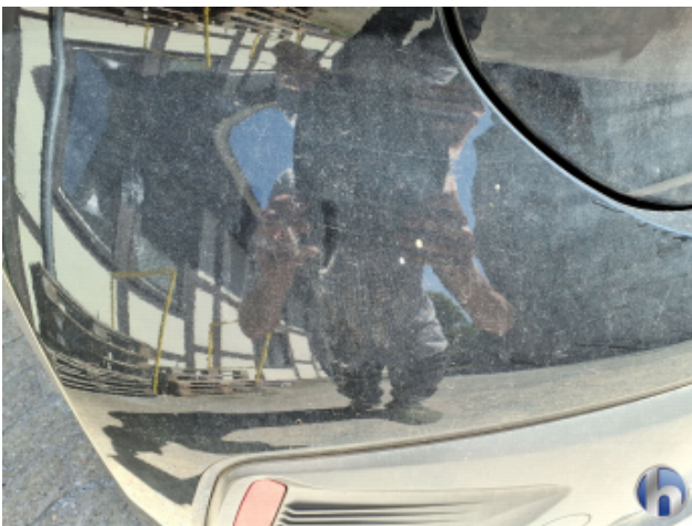
2. Stoßfänger Hinten Kratzer - Lackieren