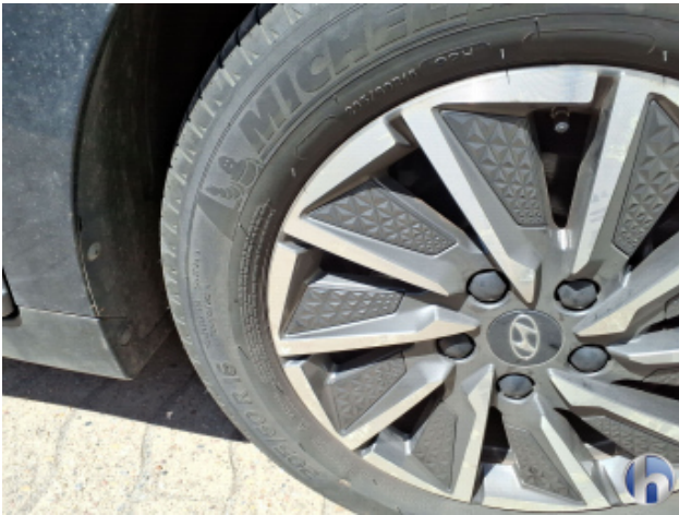
3. Felge Vorne - Rechts Korrodiert - Smart Repair