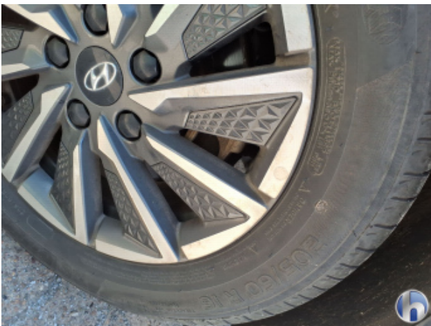
10. Felge Hinten - Links Korrodiert - Smart Repair