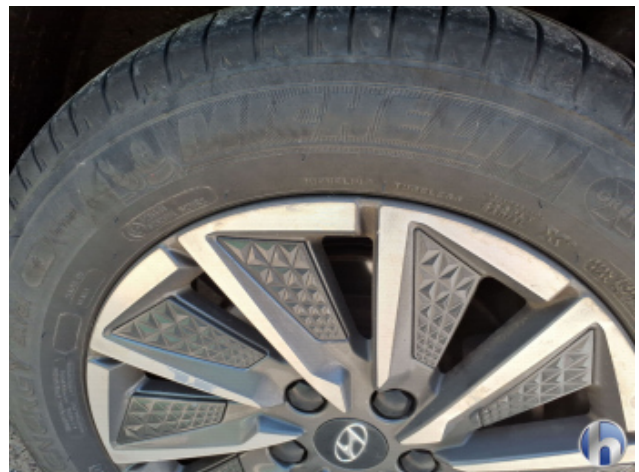
10. Felge Hinten - Links Korrodiert - Smart Repair