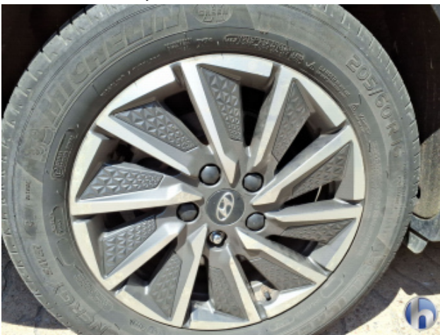
6. Felge Hinten - Rechts Korrodiert - Smart Repair