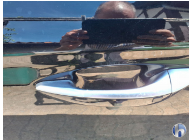
1. Tür Vorne - Links Kratzer - Smart Repair