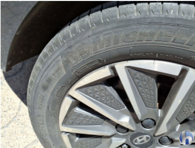
6. Felge Hinten - Rechts Korrodiert - Smart Repair