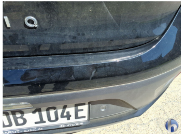
2. Stoßfänger Hinten Kratzer - Lackieren