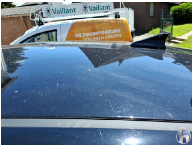
5. Dach Kratzer - Lackieren