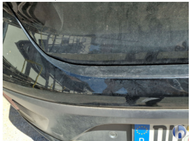
2. Stoßfänger Hinten Kratzer - Lackieren