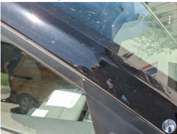
11. A-Säule Vorne - Rechts Kratzer - Smart Repair