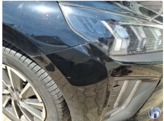
9. Stoßfänger Vorne Kratzer - Lackieren