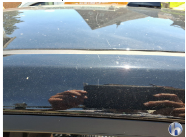
12. Dachrahmen - Links Kratzer - Lackieren