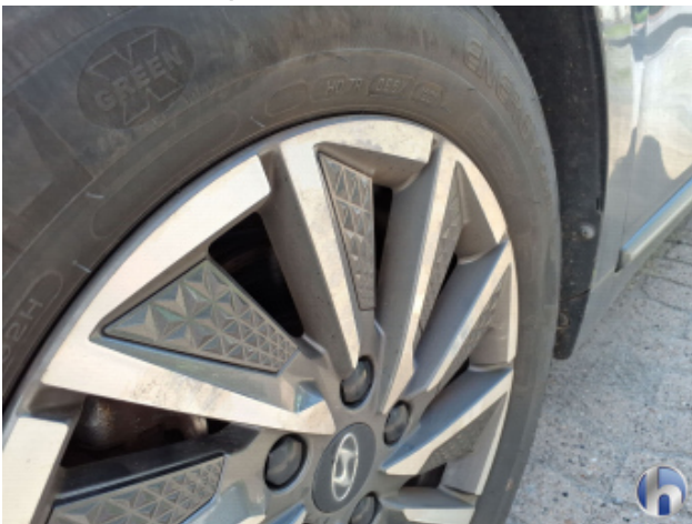
7. Felge Vorne - Links Korrodiert - Smart Repair