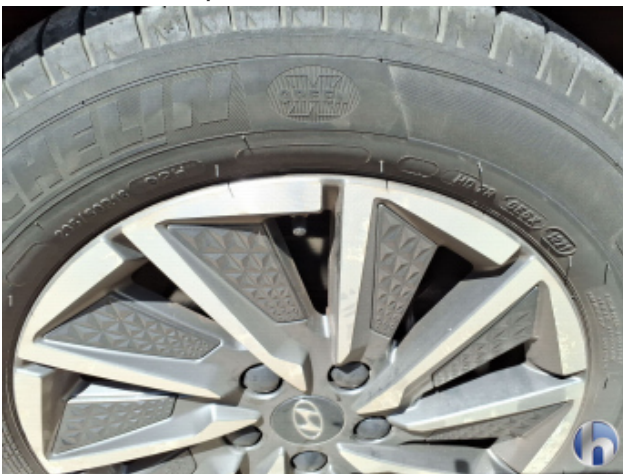
3. Felge Vorne - Rechts Korrodiert - Smart Repair