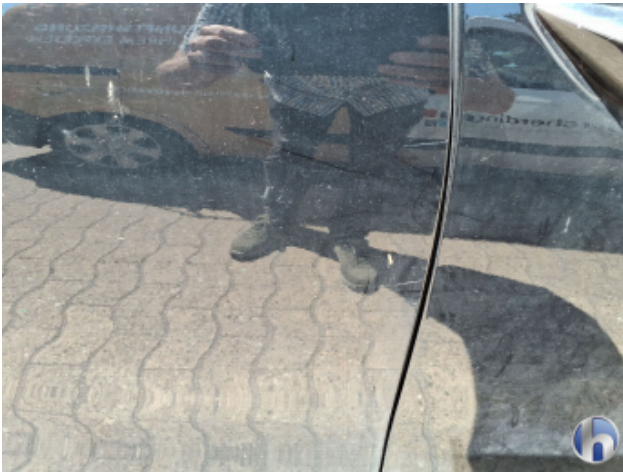
8. Tür Hinten - Rechts Kratzer - Lackieren