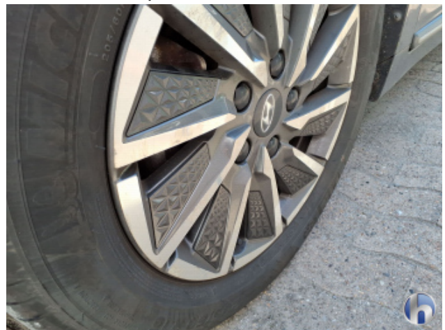
7. Felge Vorne - Links Korrodiert - Smart Repair