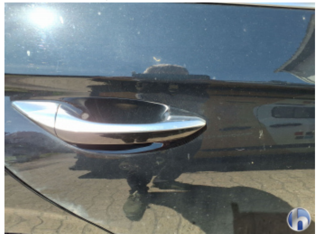
8. Tür Hinten - Rechts Kratzer - Lackieren