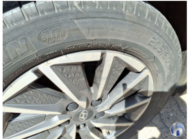
6. Felge Hinten - Rechts Korrodiert - Smart Repair