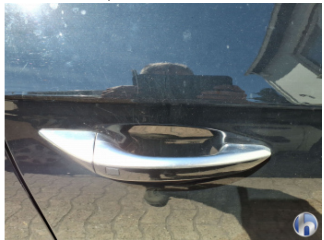
4. Tür Vorne - Rechts Kratzer - Lackieren