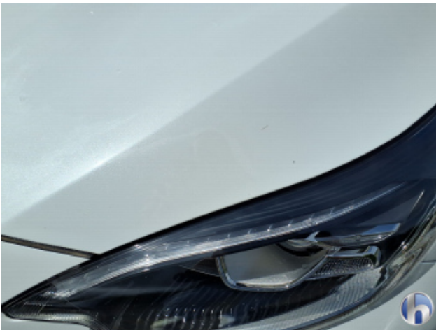
4. Motorhaube Steinschlag - Smart Repair