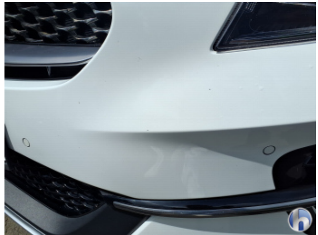
5. Stoßfänger Vorne Steinschlag - Smart Repair