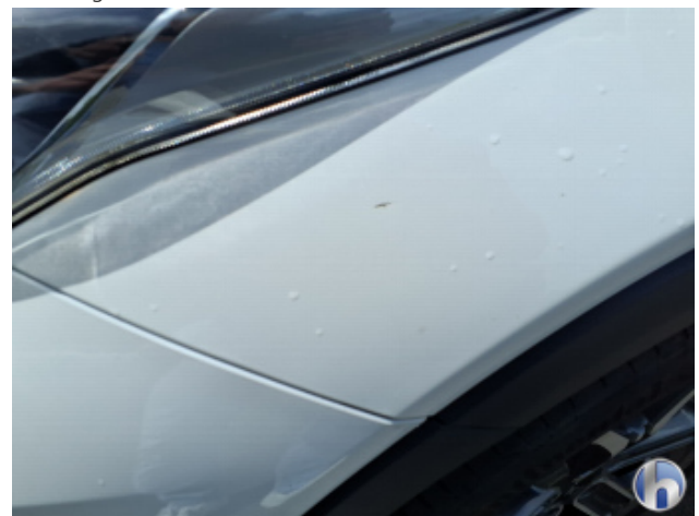
2. Kotflügel Vorne - Links Kratzer - Smart Repair