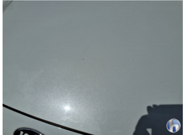
4. Motorhaube Steinschlag - Smart Repair