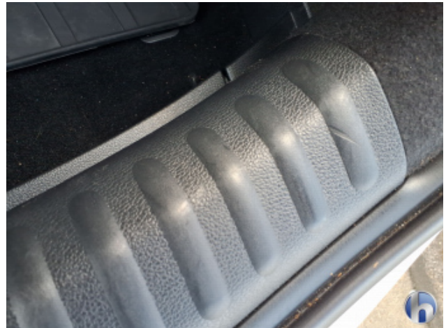
6. Innenraum Gebrauchsspuren - Ohne Reparatur