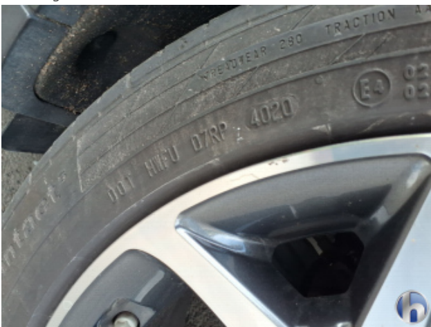
1. Felge Hinten - Links Kratzer - Smart Repair