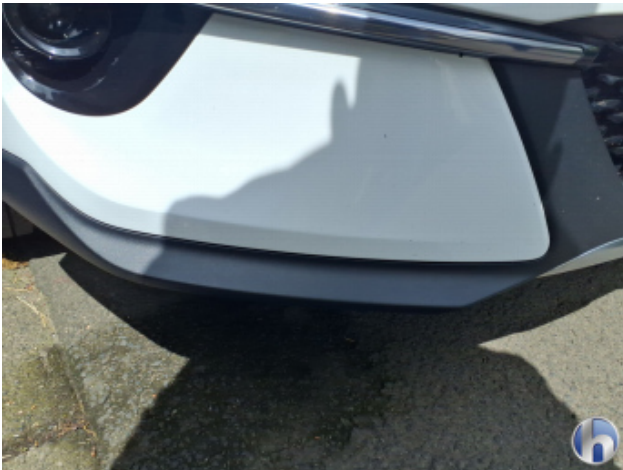
5. Stoßfänger Vorne Steinschlag - Smart Repair