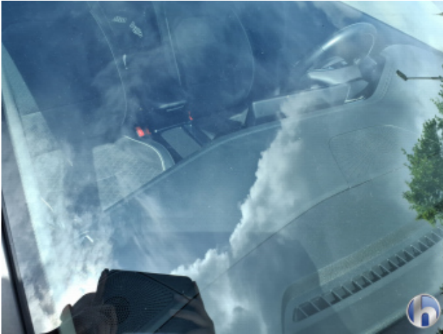
3. Windschutzscheibe Steinschlag - Smart Repair