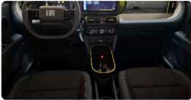
✓ Voor Interieur