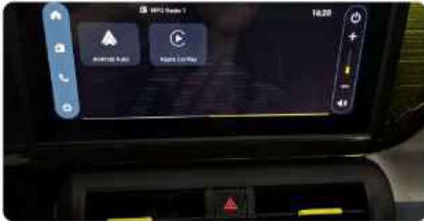
✓ Apple Carplay