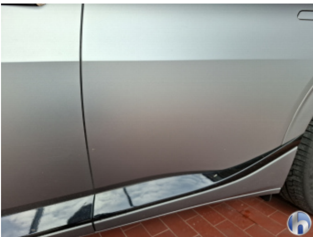
3. Tür Hinten - Links Kratzer - Smart Repair