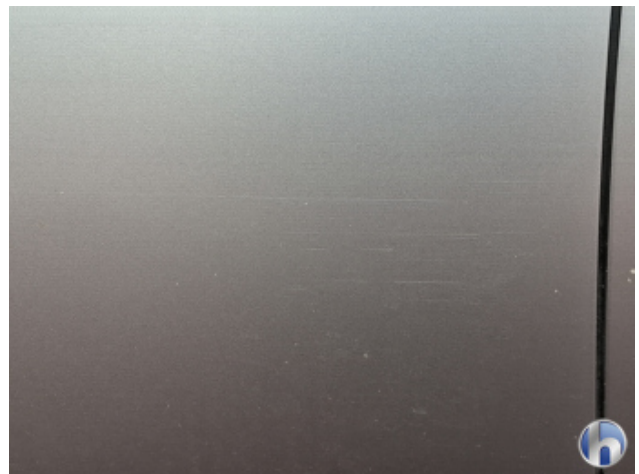
2. Tür Vorne - Links Kratzer - Lackieren