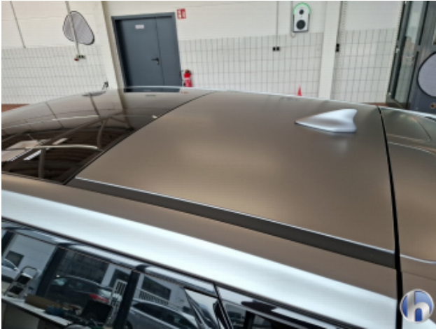
1. Dach 1 Delle - Sanft Instandsetzen