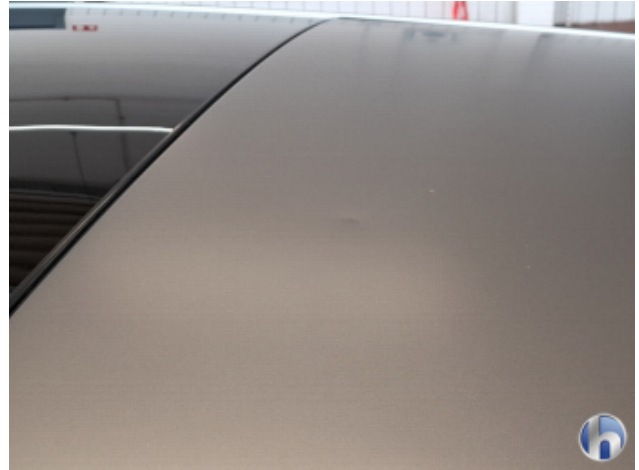
1. Dach 1 Delle - Sanft Instandsetzen