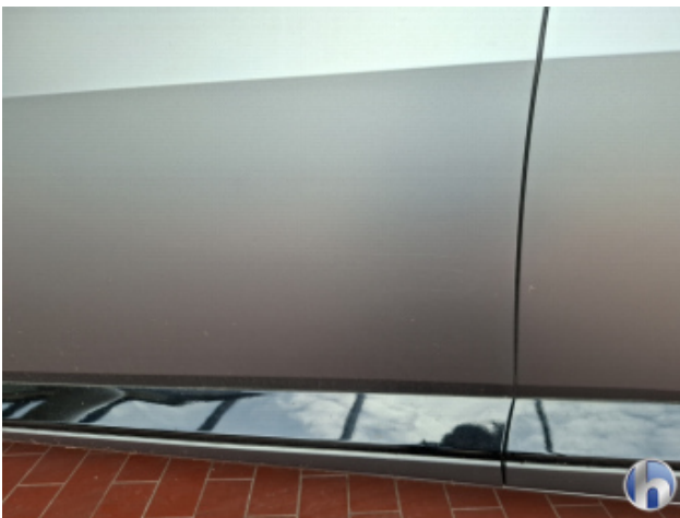
2. Tür Vorne - Links Kratzer - Lackieren