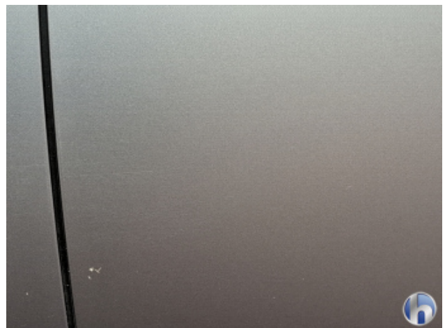
3. Tür Hinten - Links Kratzer - Smart Repair