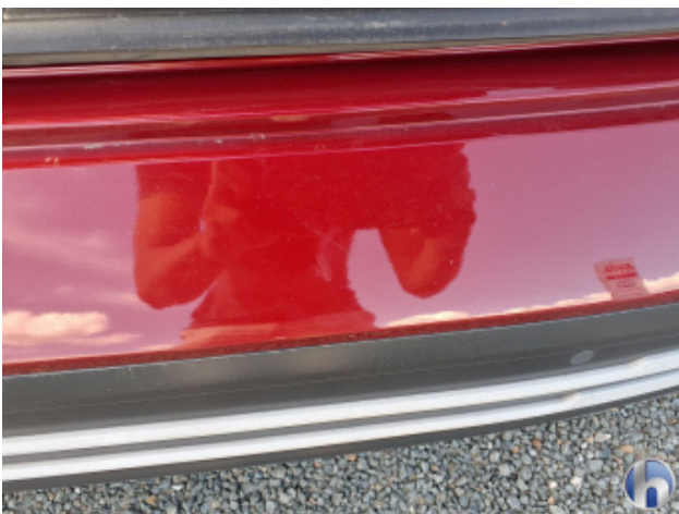
4. Stoßfänger Hinten Kratzer - Smart Repair