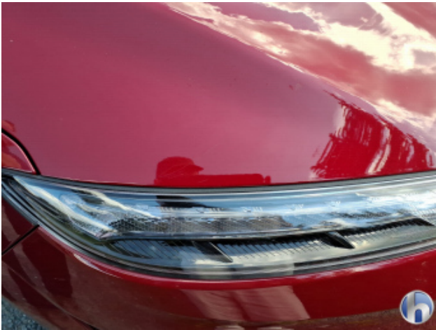
1. Motorhaube Kratzer - Lackieren