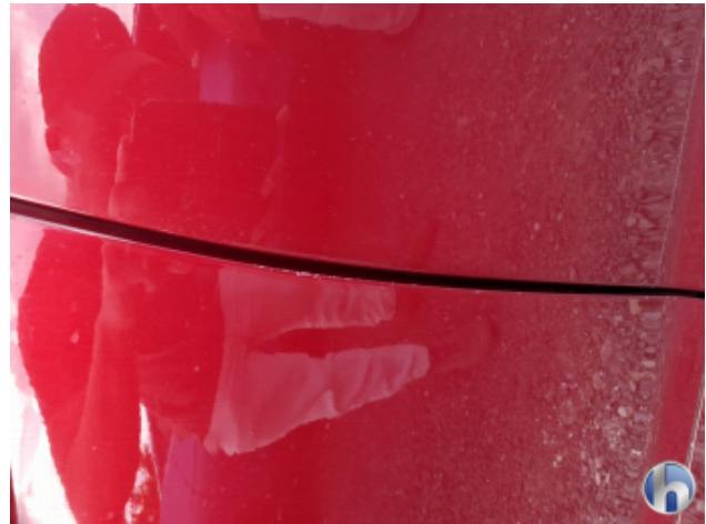
2. Tür Vorne - Links Gebrauchsspuren - Ohne Reparatur