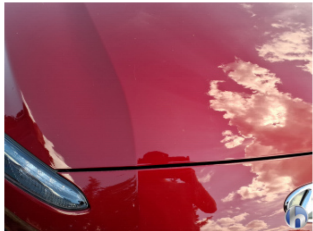
1. Motorhaube Kratzer - Lackieren