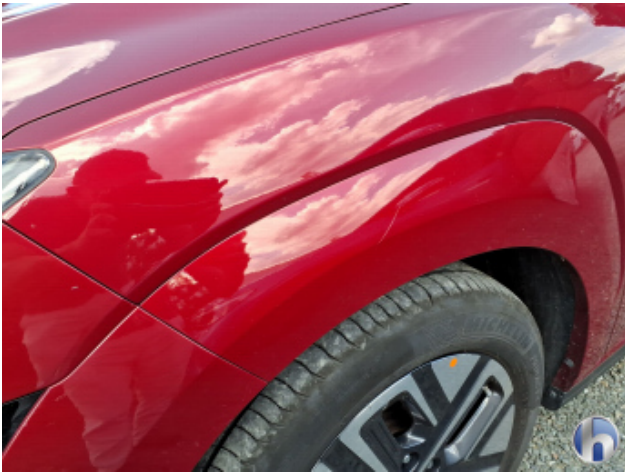
5. Kotflügel Vorne - Links Kratzer - Lackieren