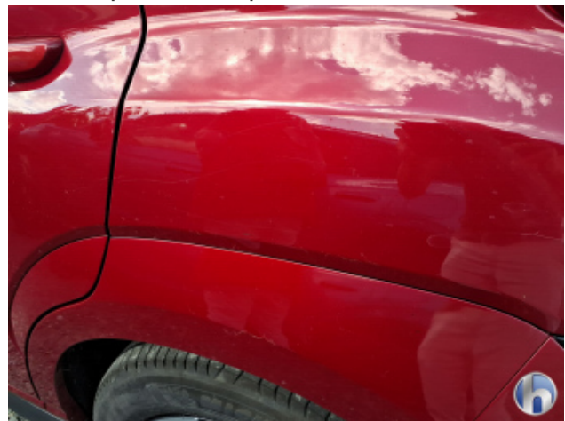
3. Seitenwand - Hinten - Links Kratzer - Lackieren