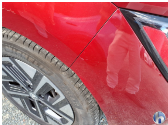
4. Stoßfänger Hinten Kratzer - Smart Repair