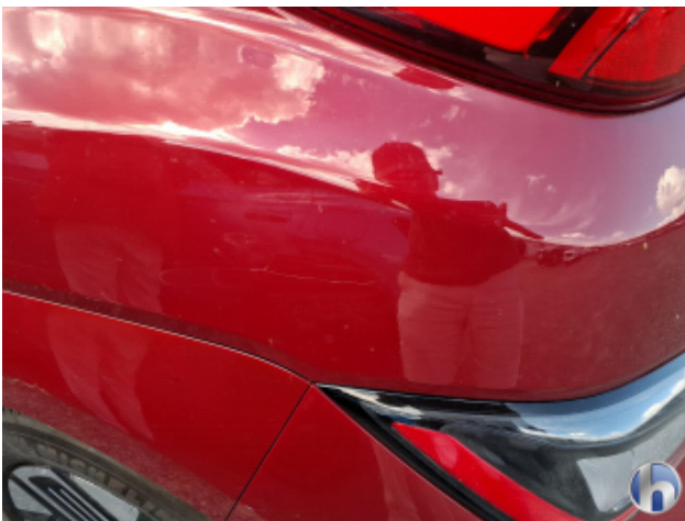
3. Seitenwand - Hinten - Links Kratzer - Lackieren