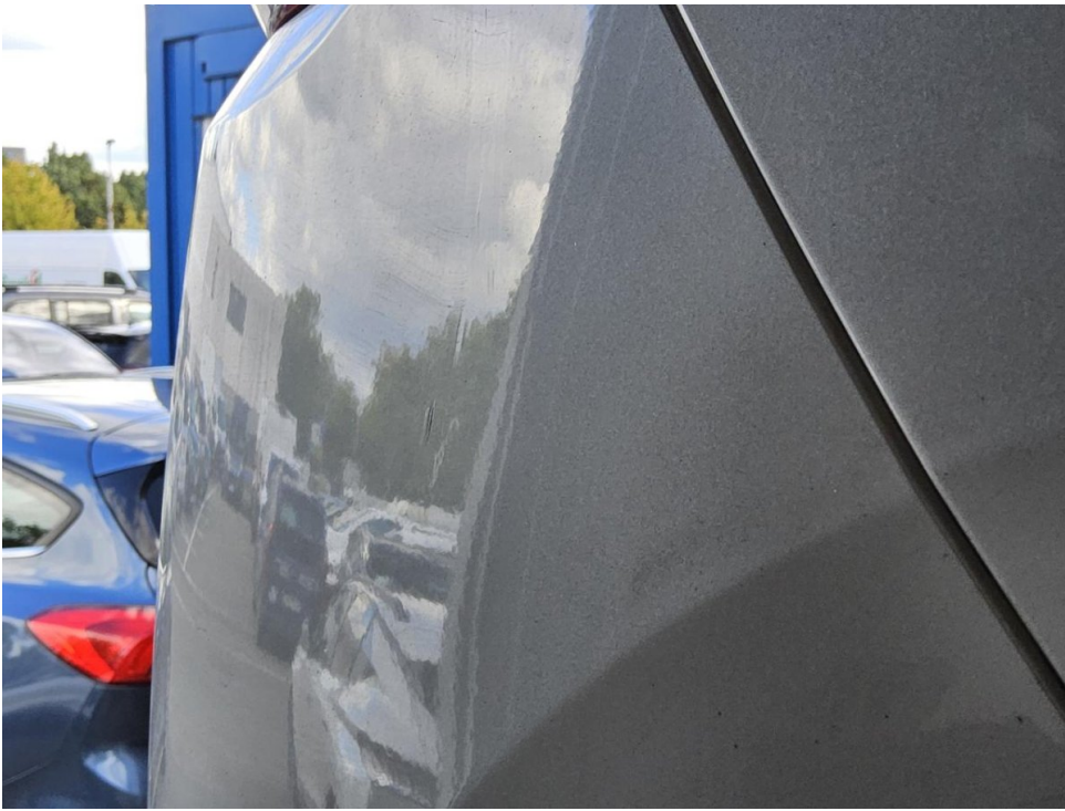
Stoßfänger hinten - Instands. und lackieren