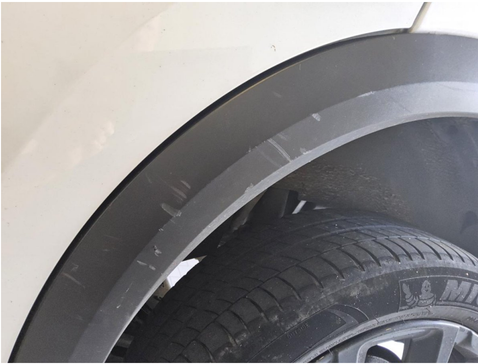
Radlaufblende HL Kratzer