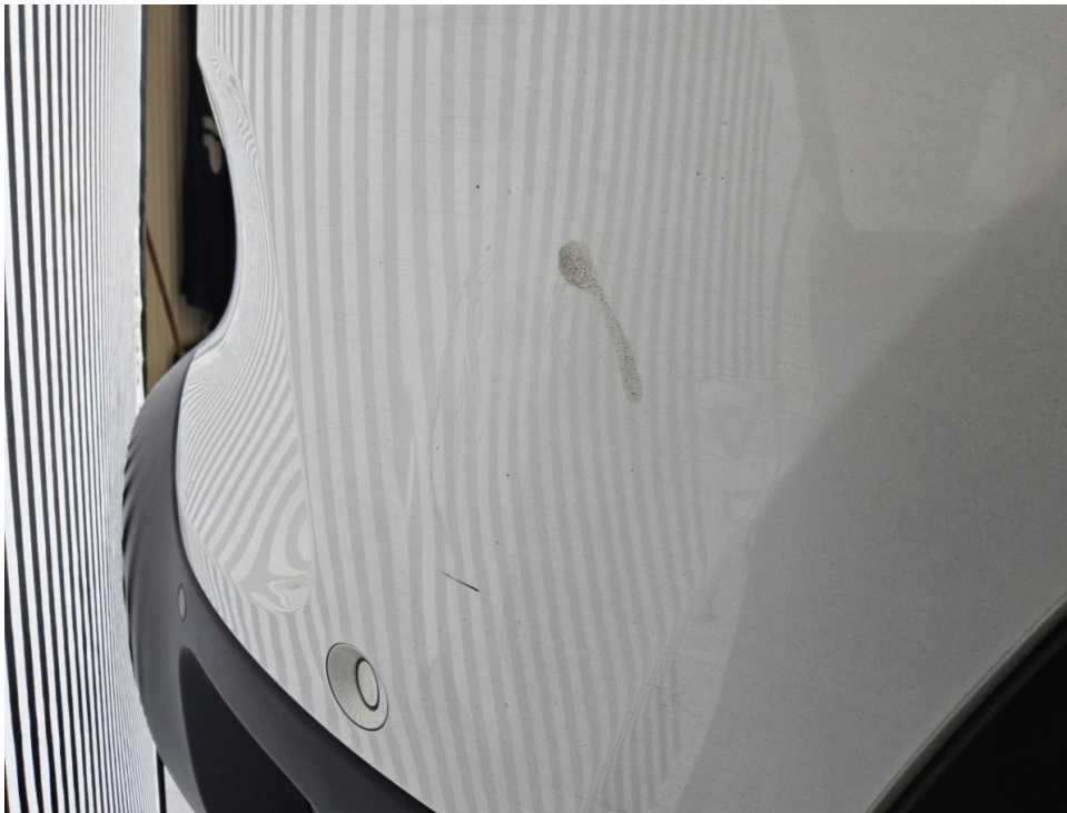
Stoßfänger hinten - Instands. und lackieren