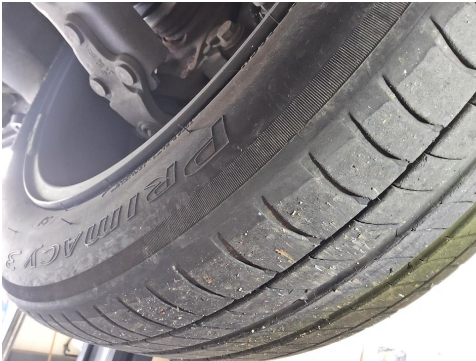
Reifen (Sommer-Radsatz) - Vorderachse links - Erneuern