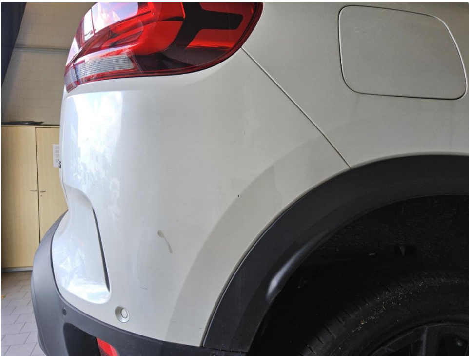
Stoßfänger hinten - Instands. und lackieren