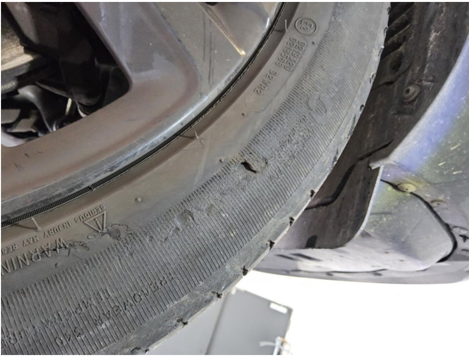
Reifen (Sommer-Radsatz) - Vorderachse rechts - Erneuern