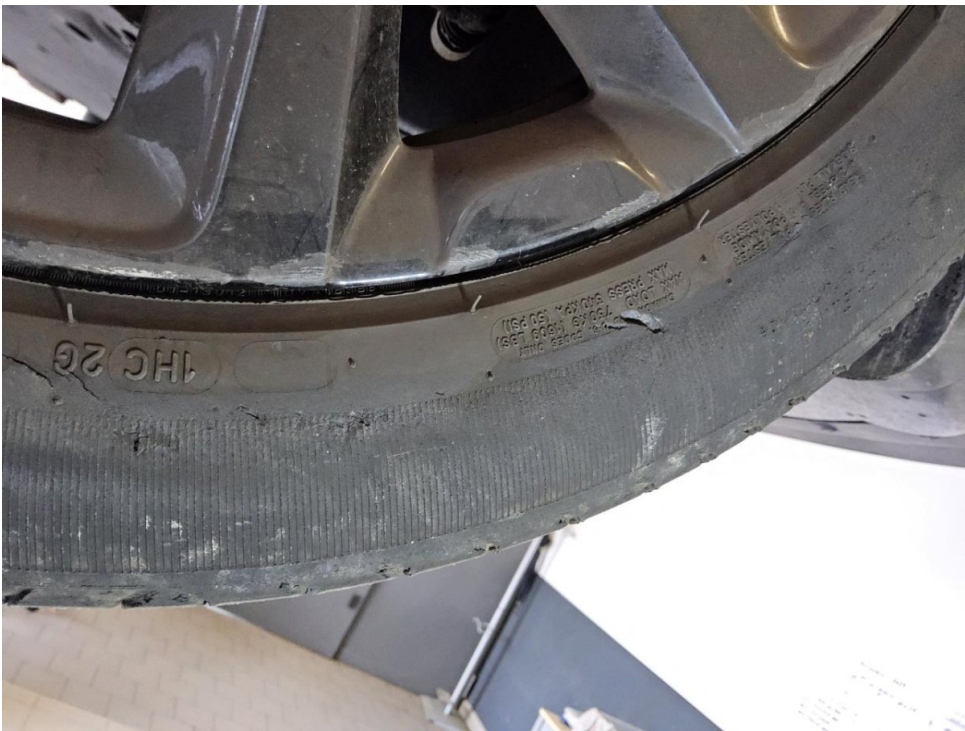
Reifen (Sommer-Radsatz) - Vorderachse rechts - Erneuern