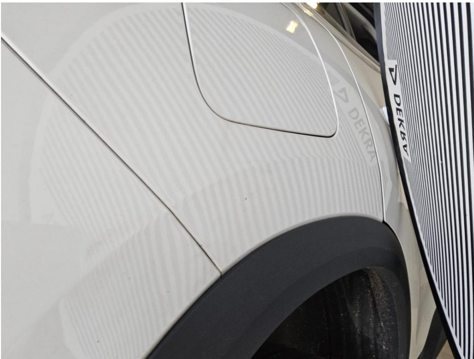
Fondseite rechts - SmartRepair