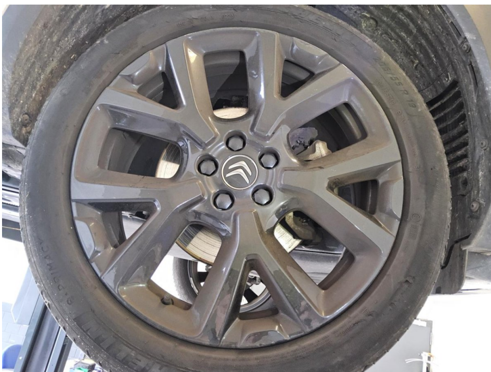
Felge (Sommer-Radsatz) - Vorderachse rechts - SmartRepair