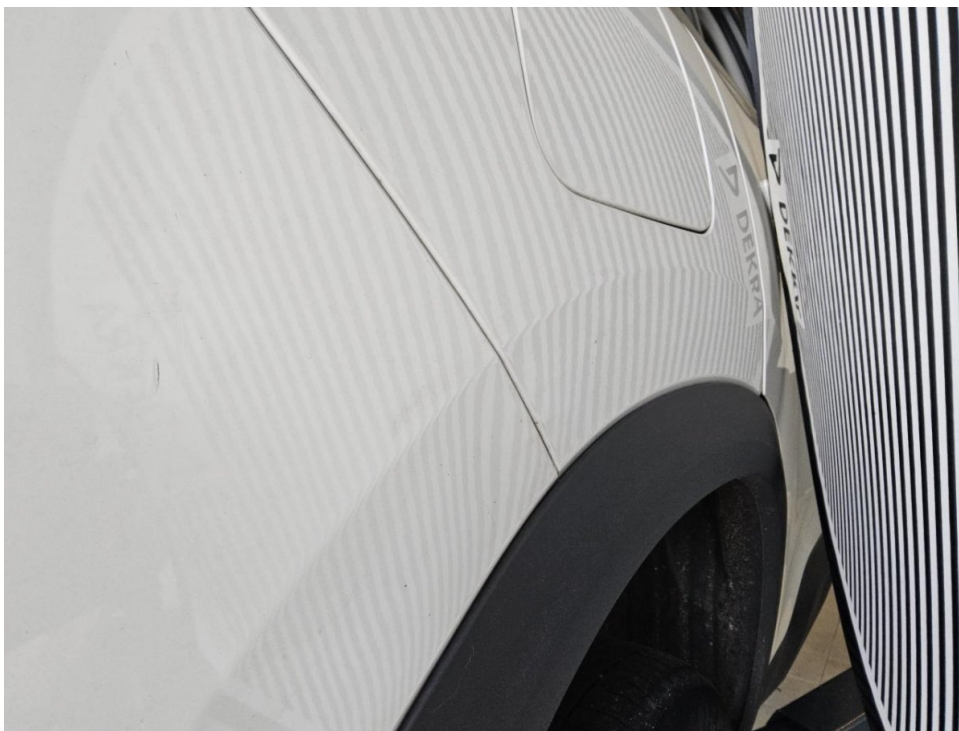
Stoßfänger hinten - Instands. und lackieren