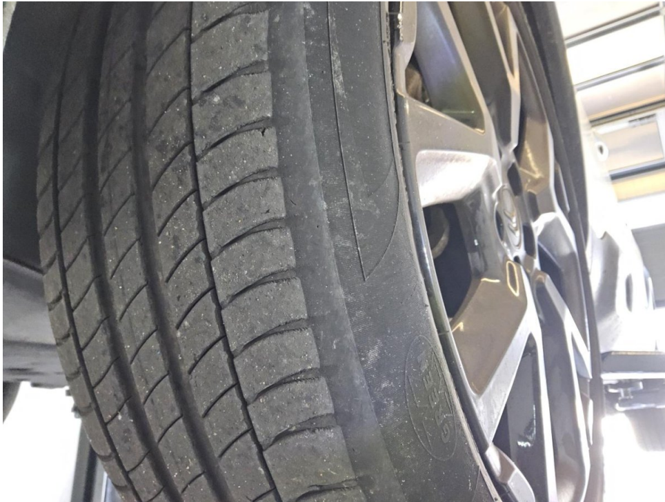
Reifen (Sommer-Radsatz) - Vorderachse links - Erneuern