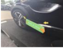
Porte ARG, Griffe(s), Peindre