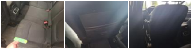
Porte AVG, Griffe(s), Acceptable