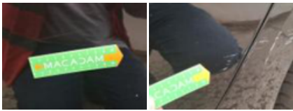
Aile ARG, Bosse(s), PDR - Débosselage ss peinture