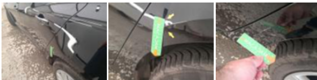
Porte AVD, Bosse(s), PDR - Débosselage ss peinture