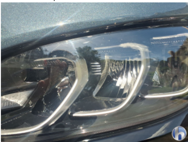
12. Scheinwerfer Halogen - Links Gebrauchsspuren - Ohne Reparatur