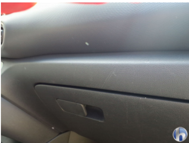
10. Armaturenbrett Kratzer - Smart Repair