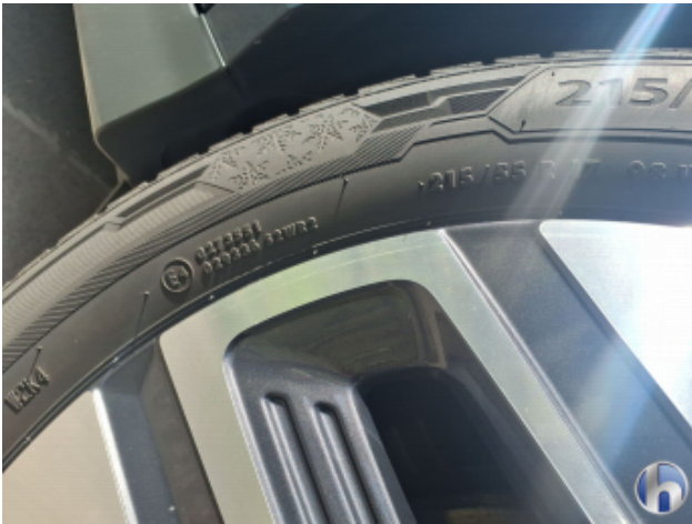
6. Felge Hinten - Links Kratzer - Smart Repair