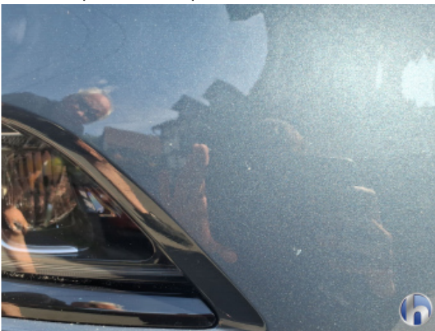
4. Stoßfänger Vorne Steinschlag - Lackieren