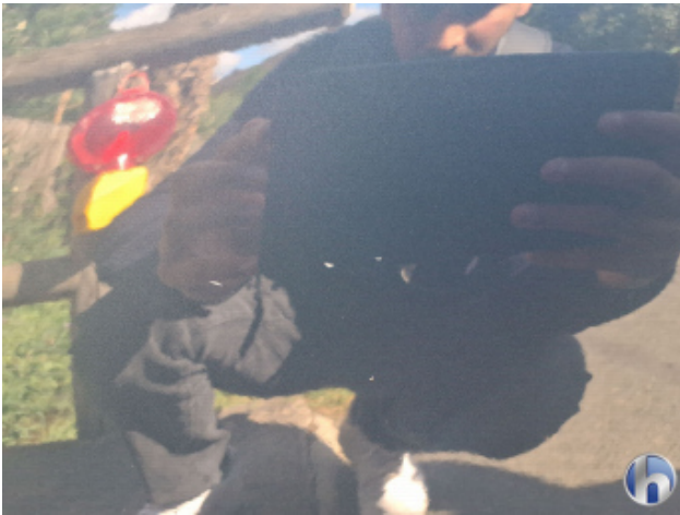
2. Tür Hinten - Rechts Gebrauchsspuren - Ohne Reparatur