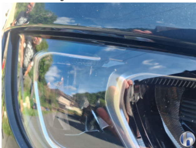
13. Scheinwerfer Halogen - Rechts Gebrauchsspuren - Ohne Reparatur