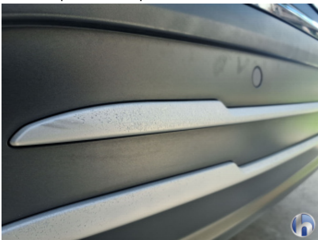
15. Zierelement Stoßfänger Heck Beschädigt - Erneuern