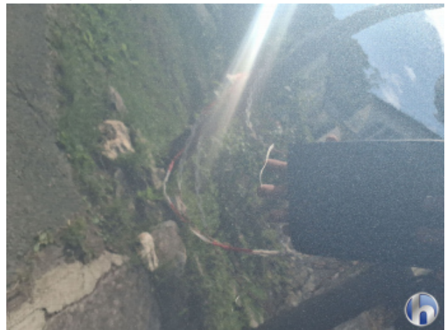
9. Tür Hinten - Links Kratzer - Smart Repair