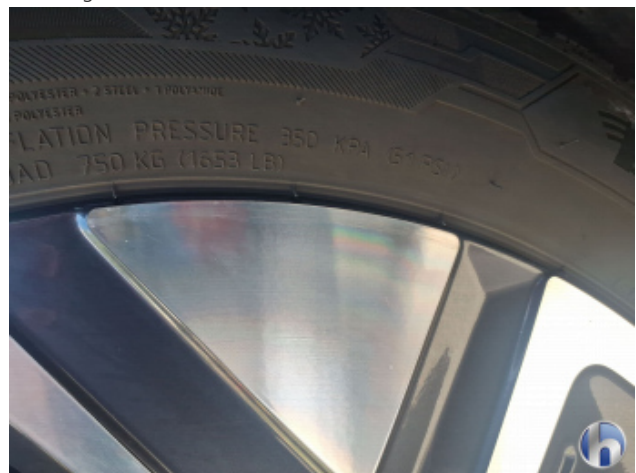
1. Felge Vorne - Rechts Kratzer - Smart Repair