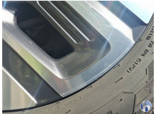
6. Felge Hinten - Links Kratzer - Smart Repair