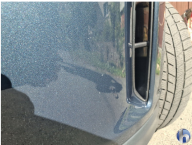
4. Stoßfänger Vorne Steinschlag - Lackieren