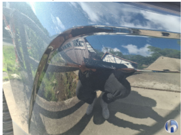
7. Stoßfänger Hinten Kratzer - Smart Repair