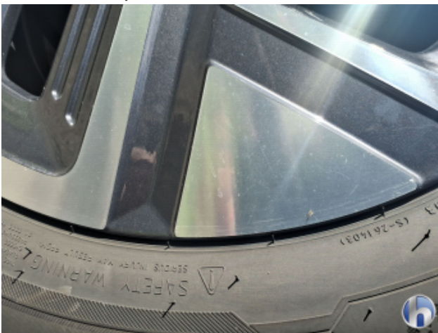
6. Felge Hinten - Links Kratzer - Smart Repair