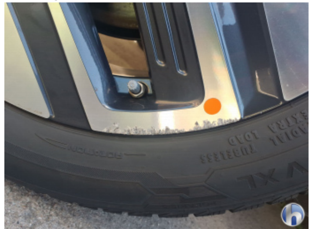
5. Felge Hinten - Rechts Kratzer - Smart Repair