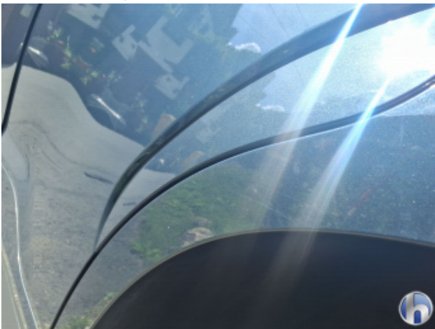
8. Seitenwand - Hinten - Links Oberflächenkratzer - Aufbereiten / Polieren