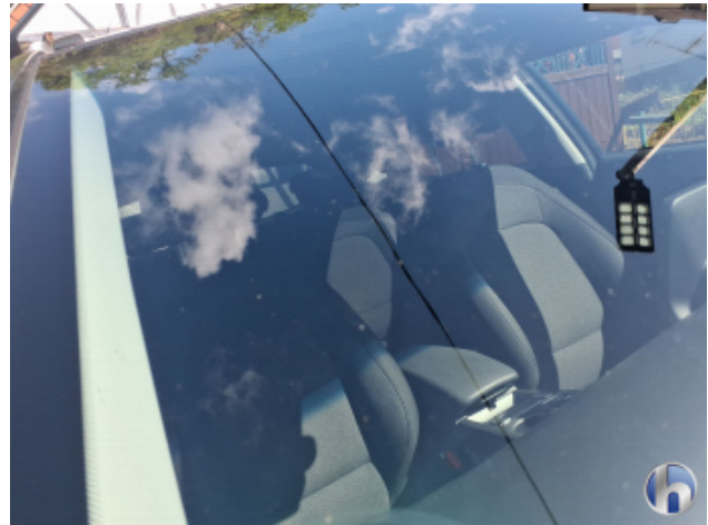
3. Windschutzscheibe Gebrauchsspuren - Ohne Reparatur