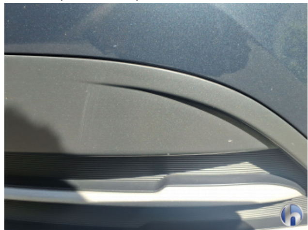
4. Stoßfänger Vorne Steinschlag - Lackieren