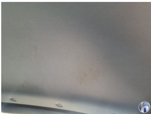
11. Dachhimmel Verschmutzt - Reinigen