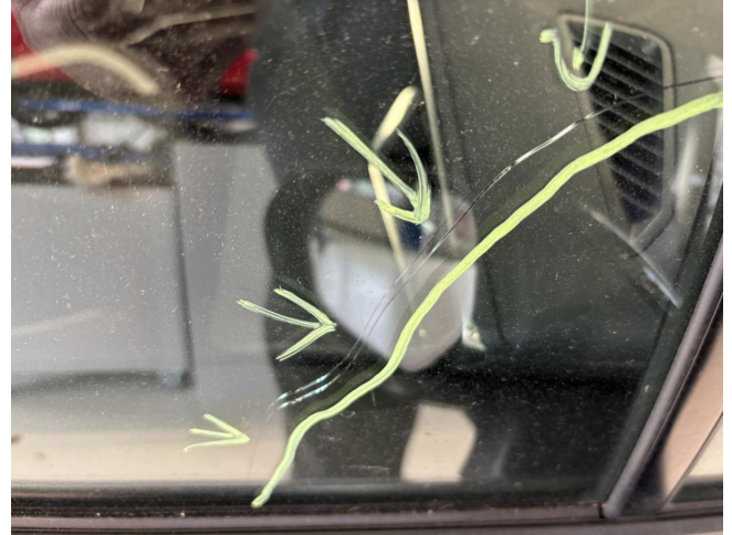
Seitenscheibe vorne rechts - Türscheibe vorne rechts verkratzt - erneuern