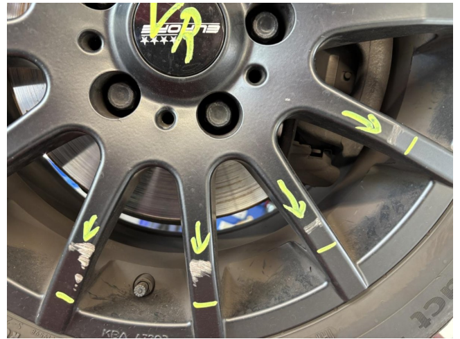
Felge (Winter-Radsatz) - Vorderachse rechts - Kratzer - lackieren