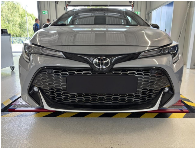
Stoßfänger vorne - verdellt / verkratzt - instandsetzen und lackieren