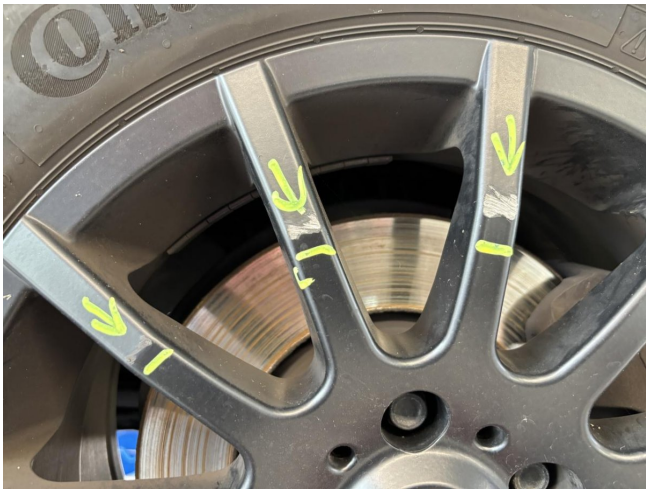
Felge (Winter-Radsatz) - Vorderachse rechts - Kratzer - lackieren