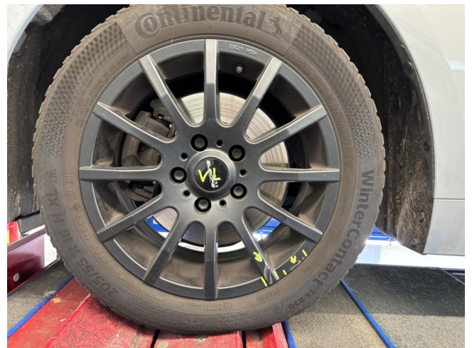
Felge (Winter-Radsatz) - Vorderachse links - Kratzer - lackieren