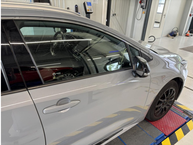
Seitenscheibe vorne rechts - Türscheibe vorne rechts verkratzt - erneuern

Auftr.-Nr: nicht vorhanden VIN: SB1Z53BE60E102364 Kilometerstand: 123.002 km Erstzulassung: 19.07.2022 Anzahl Halter lt. Kunde: 1 Anzahl Halter lt. Zulbesch. II: 1