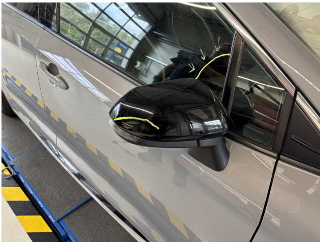
Außenspiegelgehäuse rechts - Spiegelkappe verkratzt - polieren