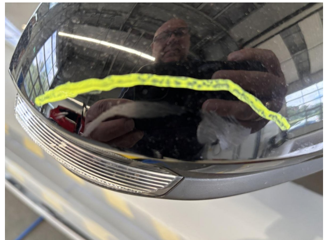
Außenspiegelgehäuse rechts - Spiegelkappe verkratzt - polieren