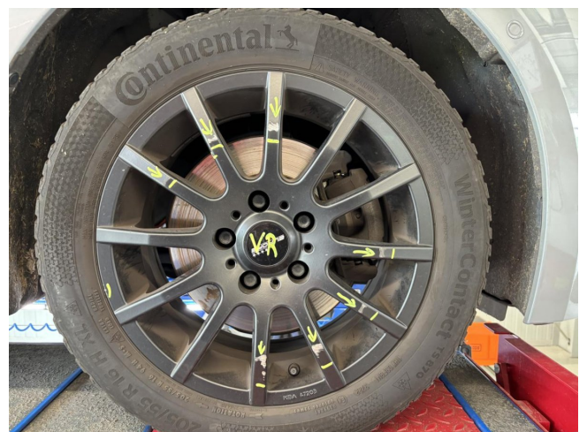
Felge (Winter-Radsatz) - Vorderachse rechts - Kratzer - lackieren