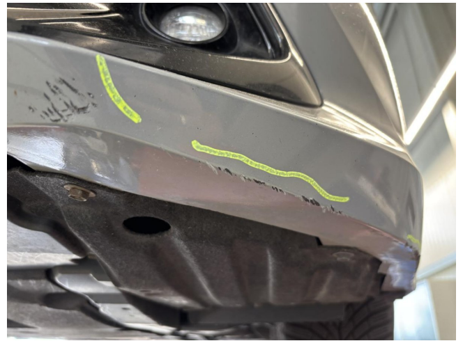
Stoßfänger vorne - verdellt / verkratzt - instandsetzen und lackieren