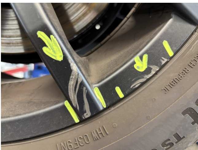
Felge (Winter-Radsatz) - Vorderachse links - Kratzer - lackieren