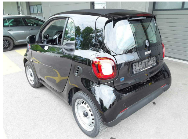
Abbildung 4: Schräg hinten