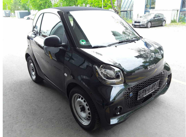
Abbildung 2: Schräg vorne