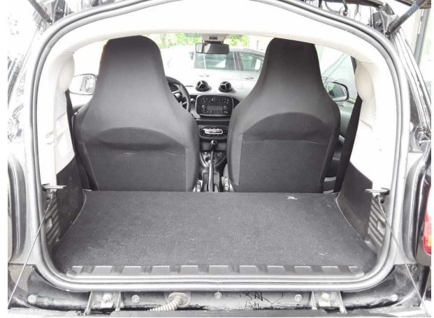
Abbildung 8: Laderaum