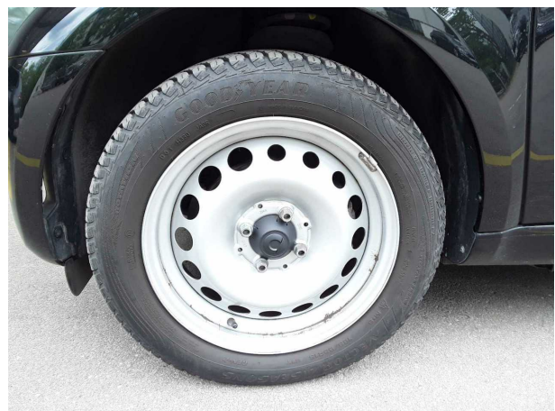
Abbildung 6: Montierte Bereifung