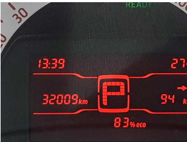
Abbildung 9: Kombiinstrument