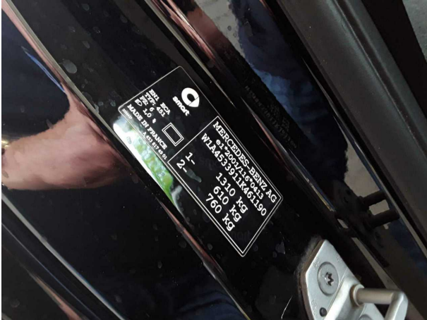
Abbildung 1: FIN