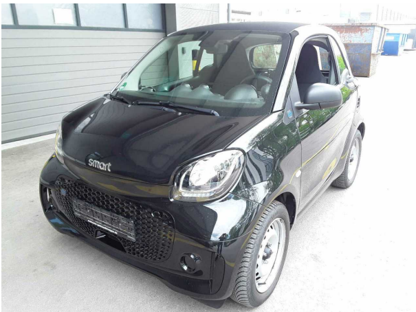
Abbildung 3: Schräg vorne