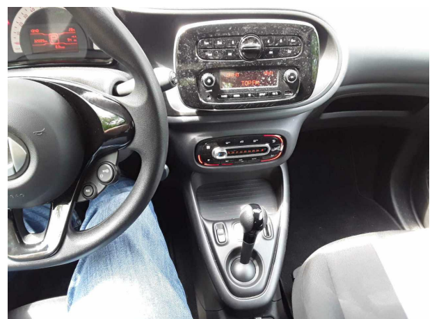
Abbildung 12: Instrumententafel