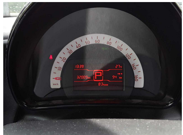
Abbildung 10: Kombiinstrument