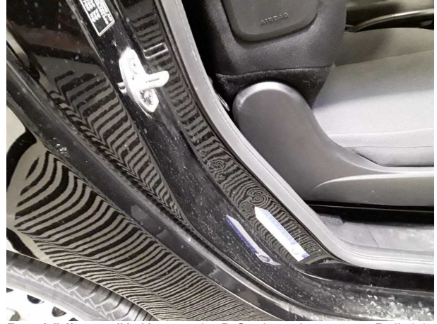
Beschädigung #1: Karosserie: B-Säule rechts unten - Delle(n) - Smart Repair