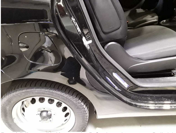
Beschädigung #1: Karosserie: B-Säule rechts unten - Delle(n) - Smart Repair