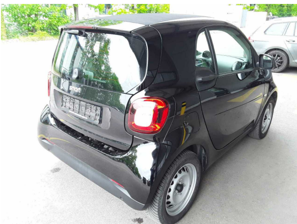
Abbildung 5: Schräg hinten