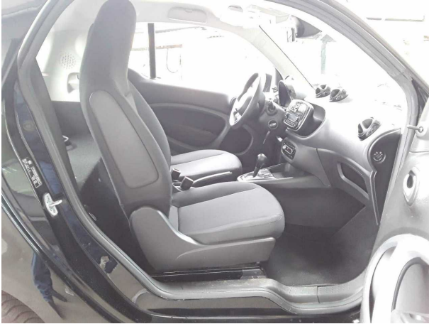
Abbildung 7: Innenraum vorne