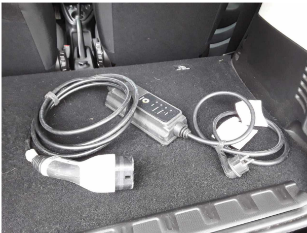
Abbildung 15: Sonstiges