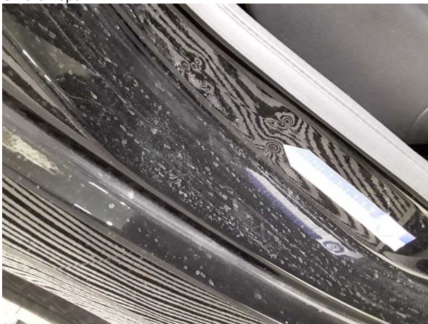
Beschädigung #1: Karosserie: B-Säule rechts unten - Delle(n) - Smart Repair