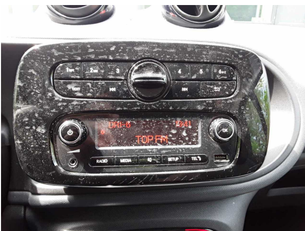
Abbildung 11: Instrumententafel