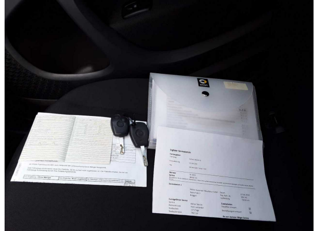
Abbildung 14: Dokumente