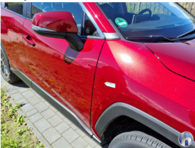
1. Kotflügel Vorne - Rechts Kratzer - Smart Repair