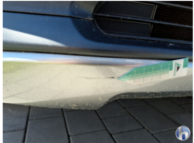
2. Stoßfänger Vorne Kratzer - Smart Repair