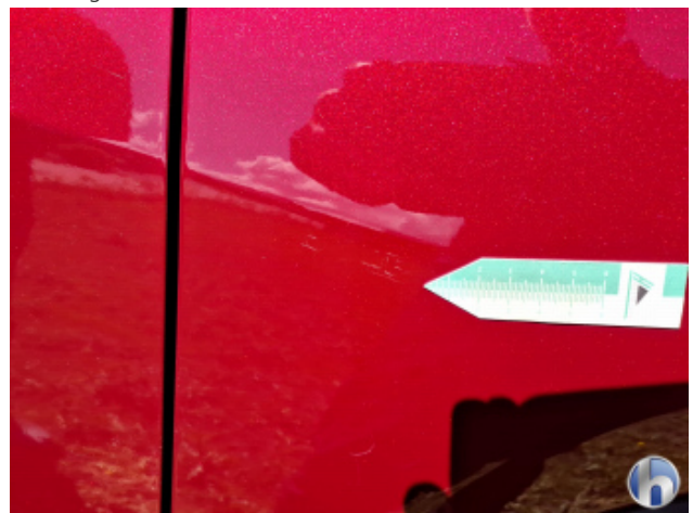
1. Kotflügel Vorne - Rechts Kratzer - Smart Repair