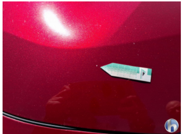
4. Motorhaube Gebrauchsspuren - Ohne Reparatur