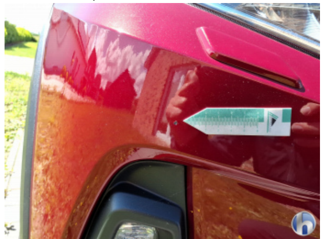
3. Stoßfänger Vorne Gebrauchsspuren - Ohne Reparatur