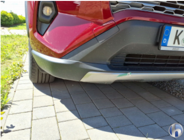
2. Stoßfänger Vorne Kratzer - Smart Repair