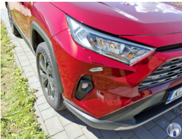
3. Stoßfänger Vorne Gebrauchsspuren - Ohne Reparatur