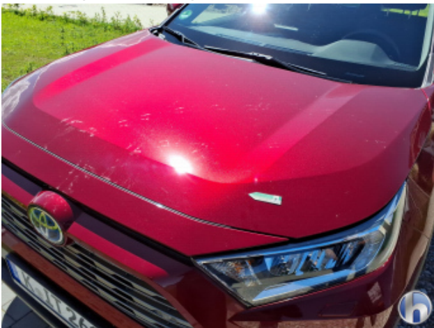
4. Motorhaube Gebrauchsspuren - Ohne Reparatur