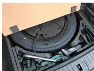
Räder - Ersatzrad