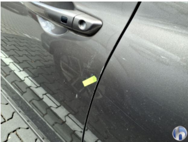
1. Tür Vorne - Links Kratzer - Smart Repair