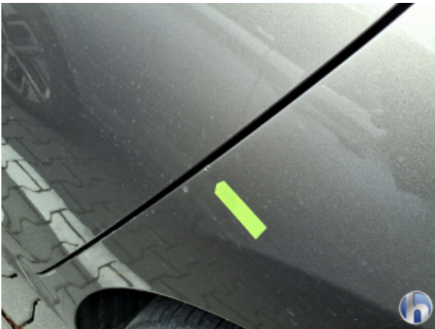
5. Seitenwand - Hinten - Links Kratzer - Smart Repair