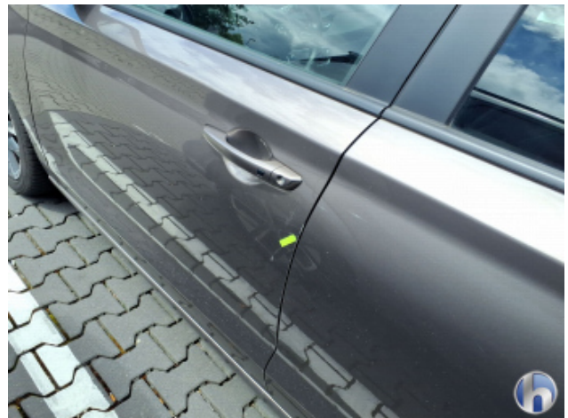
1. Tür Vorne - Links Kratzer - Smart Repair