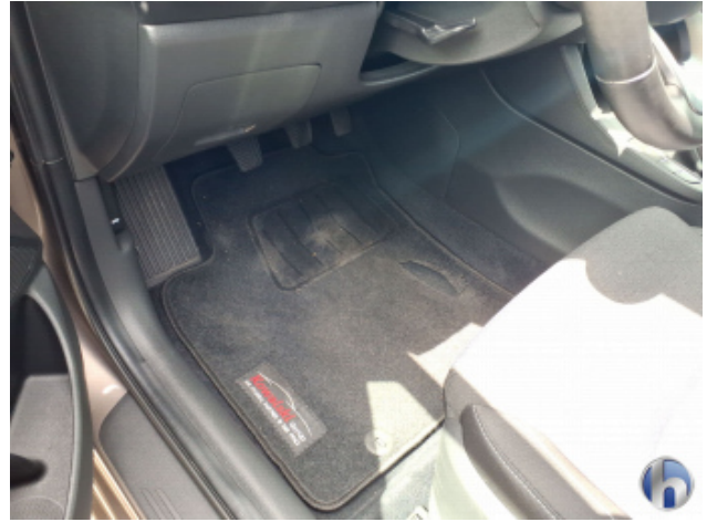
7. Fußraum Innenraum links vorne Loch - Erneuern