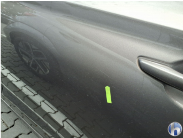
2. Tür Hinten - Links Kratzer - Smart Repair