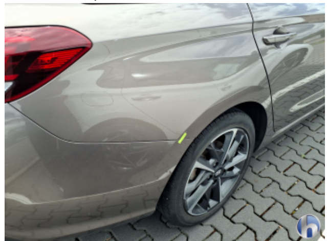
3. Seitenwand - Hinten - Rechts Kratzer - Smart Repair