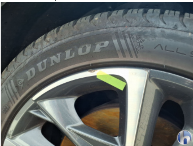
4. Felge Vorne - Rechts Kratzer - Smart Repair