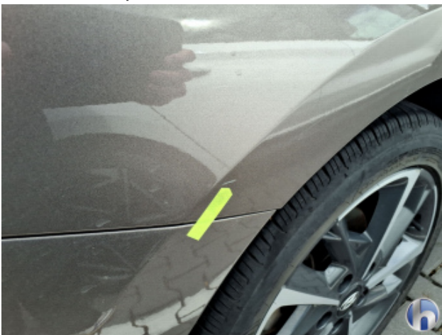
3. Seitenwand - Hinten - Rechts Kratzer - Smart Repair