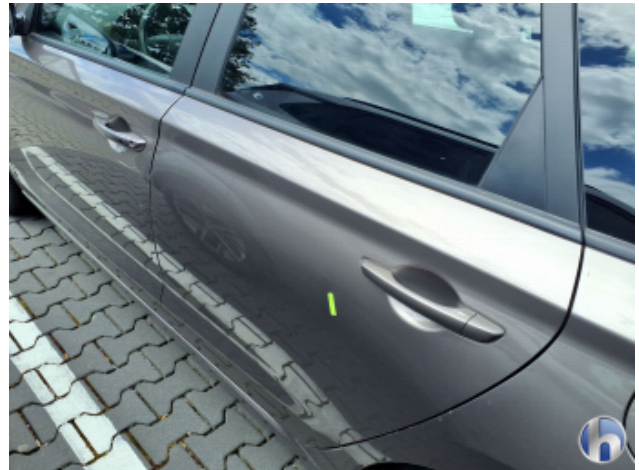
2. Tür Hinten - Links Kratzer - Smart Repair