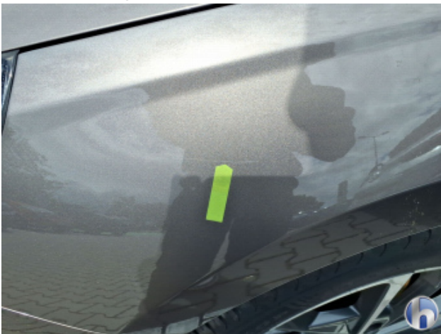
6. Kotflügel Vorne - Links Oberflächenkratzer - Aufbereiten / Polieren