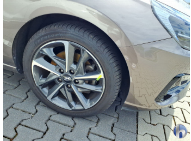
4. Felge Vorne - Rechts Kratzer - Smart Repair