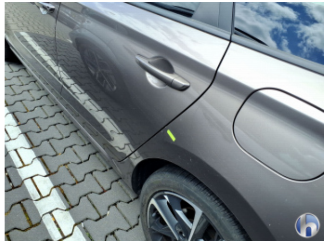
5. Seitenwand - Hinten - Links Kratzer - Smart Repair