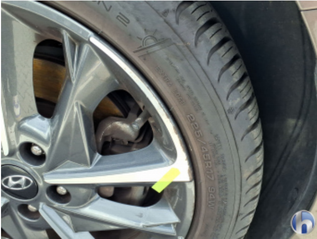
4. Felge Vorne - Rechts Kratzer - Smart Repair