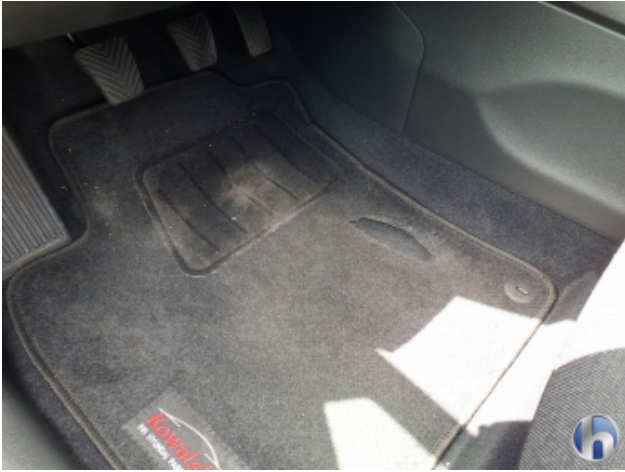
7. Fußraum Innenraum links vorne Loch - Erneuern