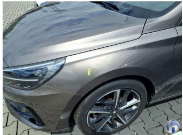
6. Kotflügel Vorne - Links Oberflächenkratzer - Aufbereiten / Polieren