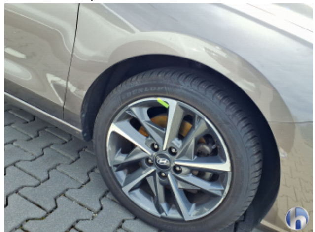
4. Felge Vorne - Rechts Kratzer - Smart Repair