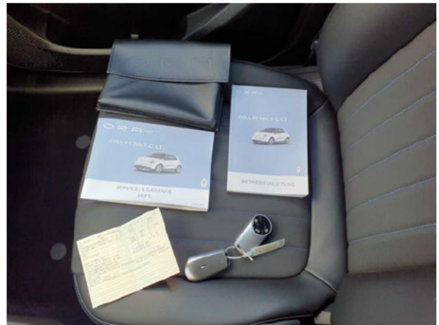
Abbildung 20: Sonstiges