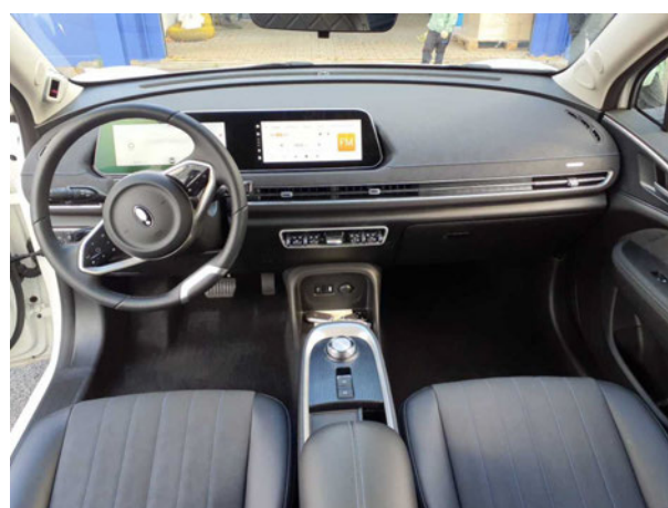
Abbildung 12: Instrumententafel