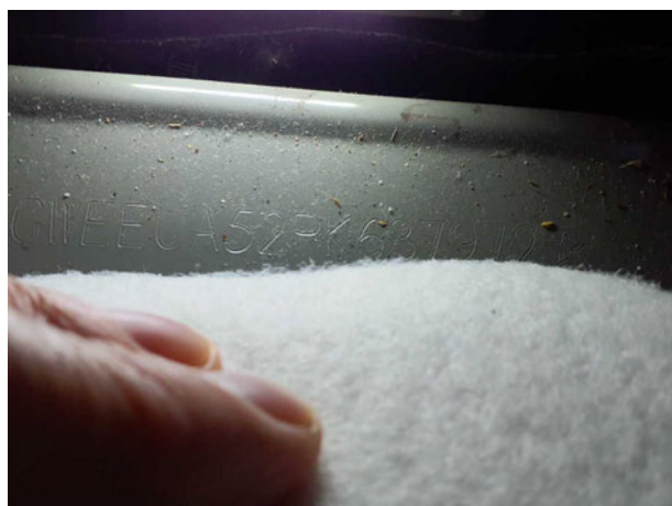
Abbildung 7: FIN