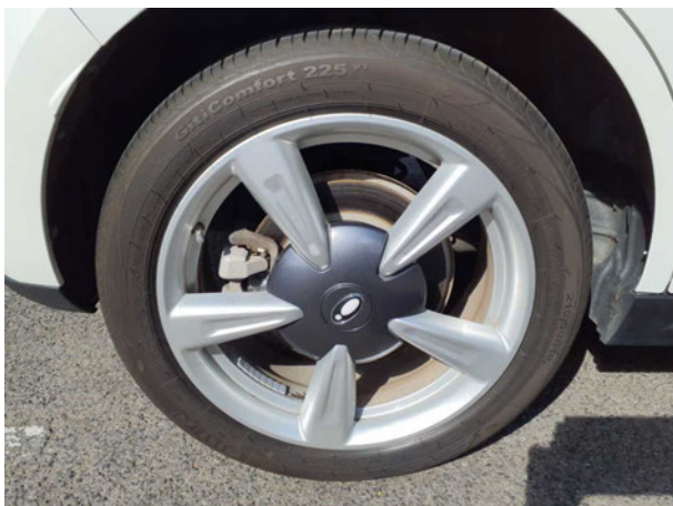
Abbildung 17: Montierte Bereifung