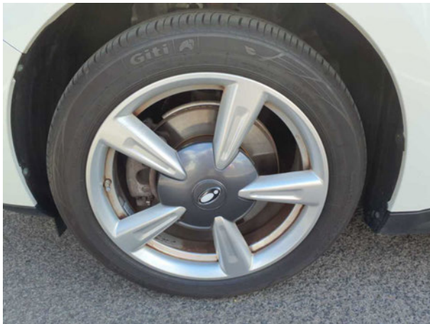
Abbildung 15: Montierte Bereifung