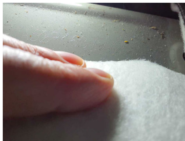
Abbildung 8: FIN