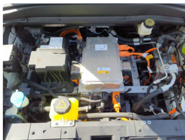
Abbildung 6: Motorraum