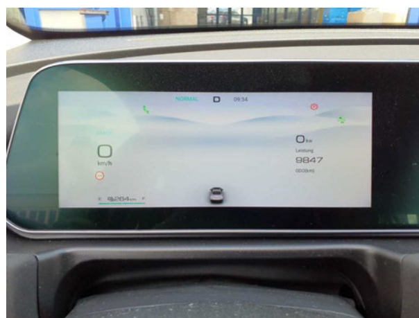
Abbildung 10: Kombiinstrument