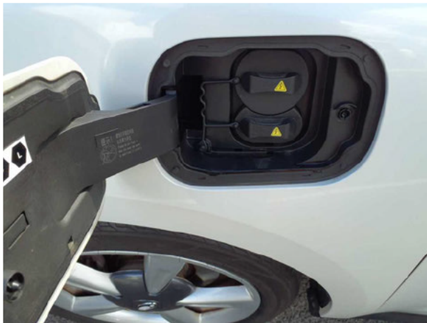
Abbildung 19: Ladebuchse/Tankstutzen