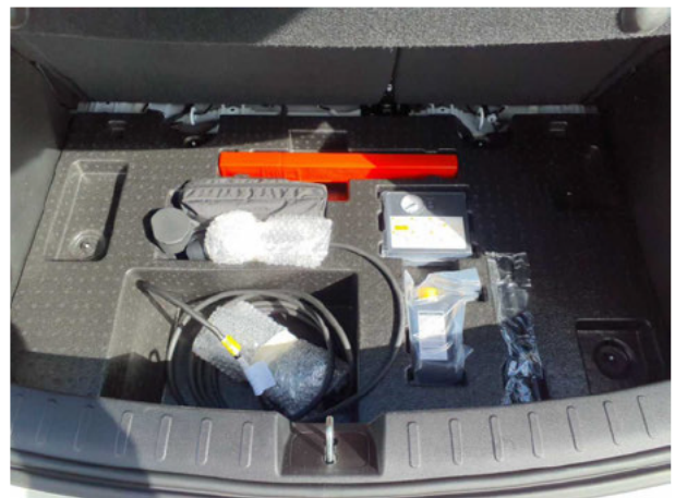
Abbildung 22: Sonstiges