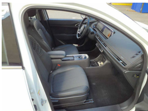
Abbildung 9: Innenraum vorne