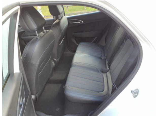
Abbildung 14: Innenraum hinten