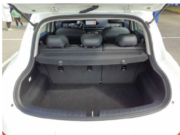
Abbildung 5: Laderraum