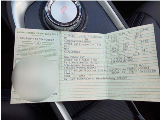
Abbildung 13: Zulassungsdokument(e)