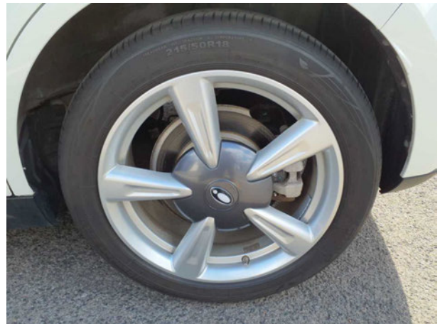
Abbildung 16: Montierte Bereifung