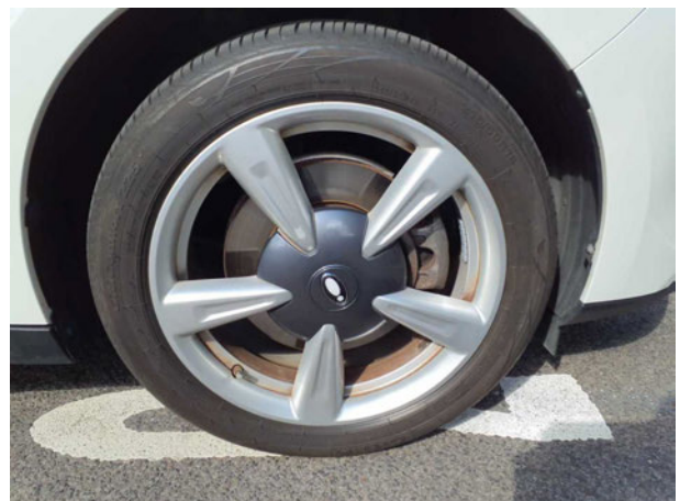
Abbildung 18: Montierte Bereifung