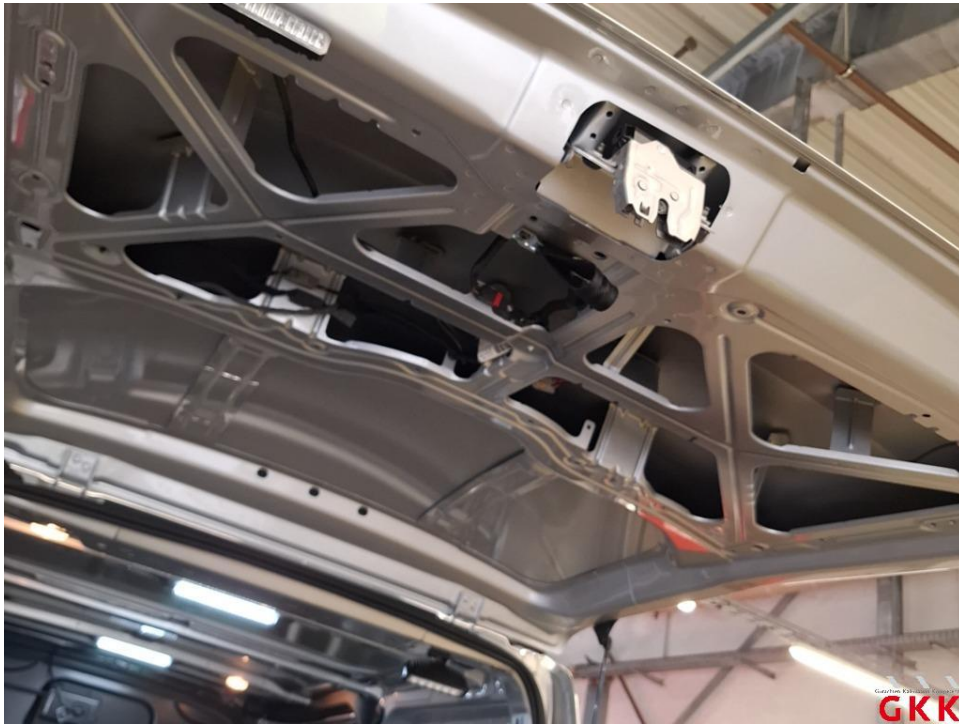
Bild 13 Heckklappe, Innenverkleidung, fehlt, ersetzen