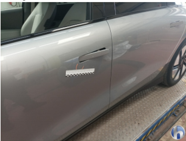
1. Tür Vorne - Links Lackabplatzer - Smart Repair