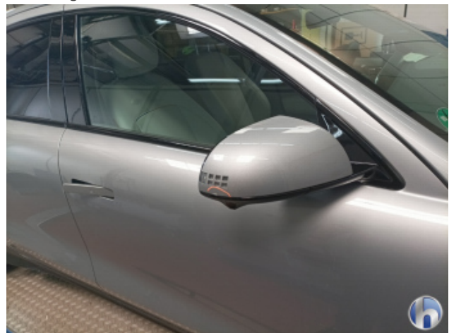
3. Außenspiegel Gehäuse - Rechts Beschädigt - Smart Repair