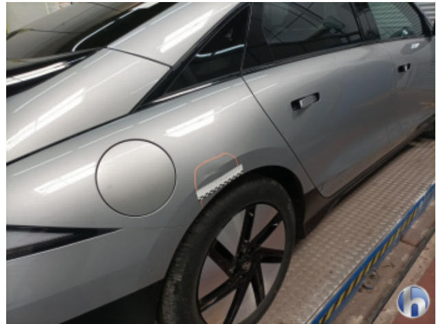
2. Seitenwand - Hinten - Rechts Beschädigt - Instandsetzen und Lackieren