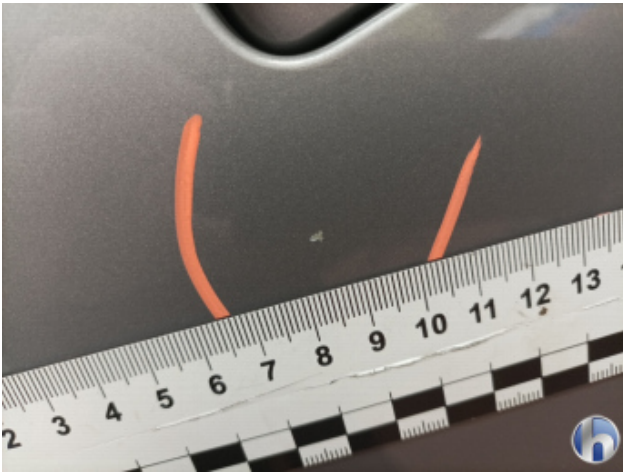
1. Tür Vorne - Links Lackabplatzer - Smart Repair