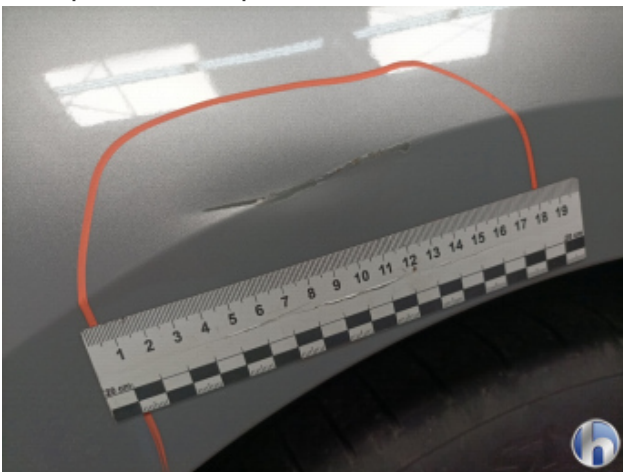
2. Seitenwand - Hinten - Rechts Beschädigt - Instandsetzen und Lackieren