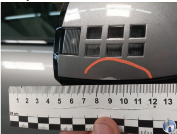
3. Außenspiegel Gehäuse - Rechts Beschädigt - Smart Repair