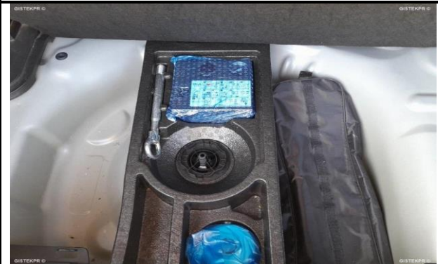
DAÑOS INTERNOS 2