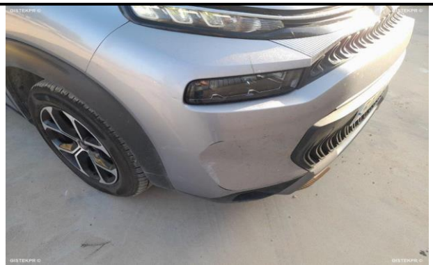
DAÑOS EXTERNOS 2