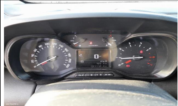
CUADRO DE MANDO