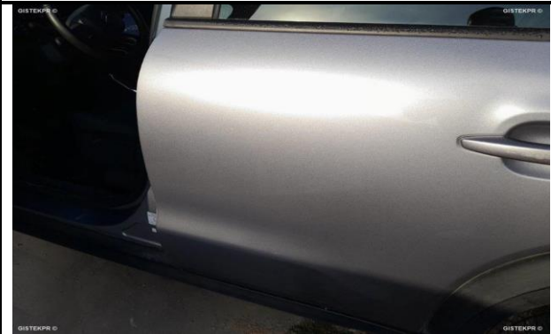
DAÑOS EXTERNOS 9