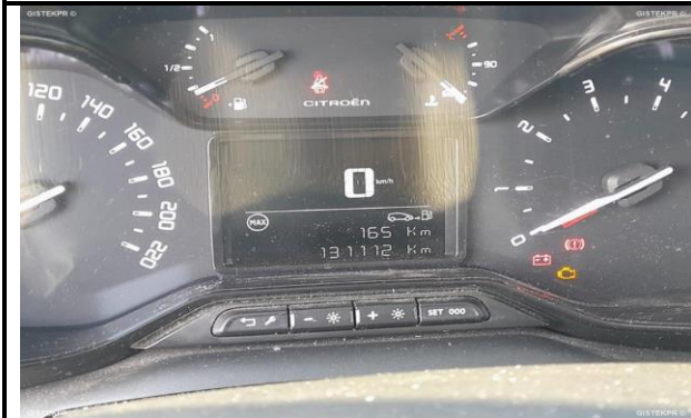
CUADRO DE MANDOS