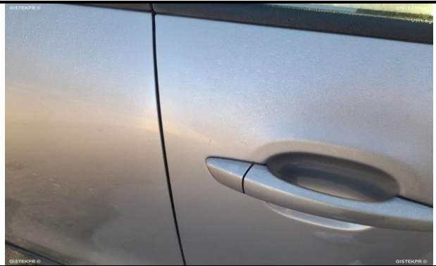
DAÑOS EXTERNOS 5