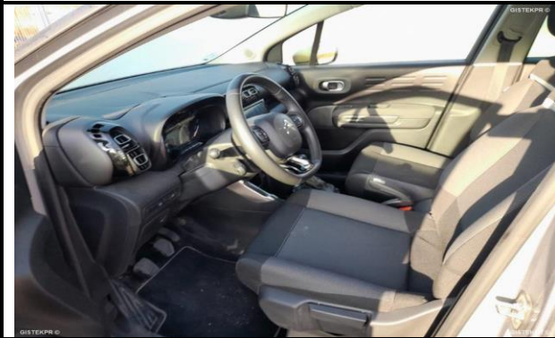
DAÑOS INTERNOS DEL

INFORME-STELL-RE-1047- 2025_(9514841612- 5122MBM).DOC