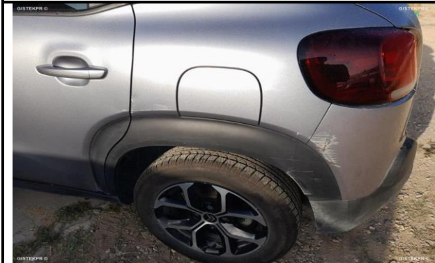
DAÑOS EXTERNOS 8