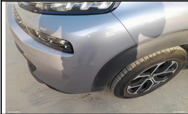
DAÑOS EXTERNOS 1

INFORME-STELL-RE-1047- 2025_(9514841612- 5122MBM).DOC