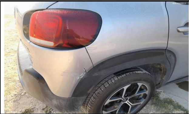
DAÑOS EXTERNOS 6