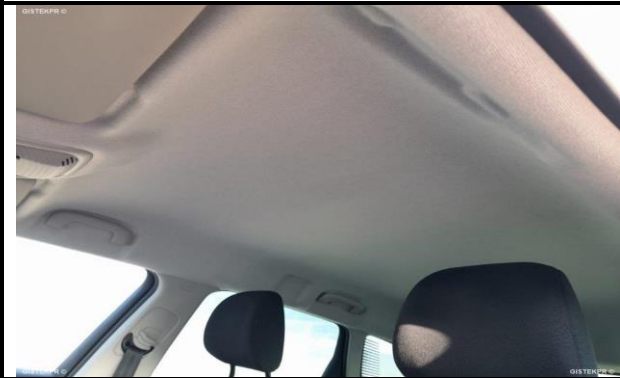
DAÑOS INTERNOS 3

INFORME-STELL-RE-1047- 2025_(9514841612- 5122MBM).DOC