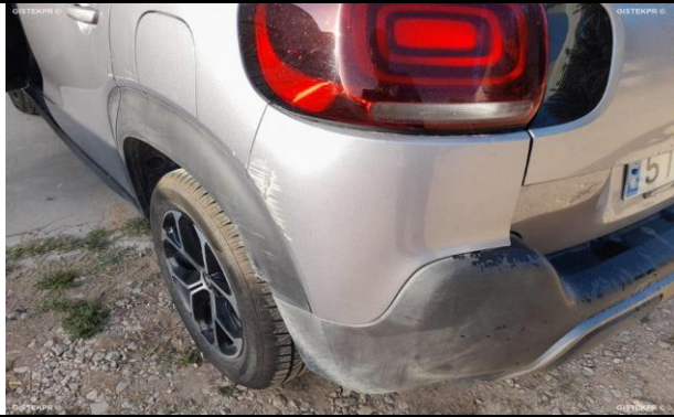
DAÑOS EXTERNOS 7