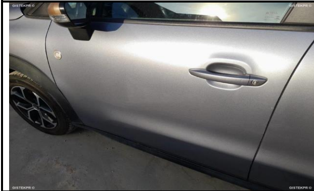
DAÑOS EXTERNOS 10

INFORME-STELL-RE-1047- 2025_(9514841612- 5122MBM).DOC