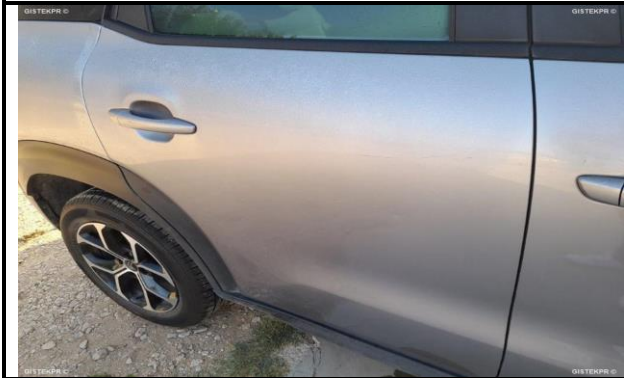
DAÑOS EXTERNOS 4

INFORME-STELL-RE-1047- 2025_(9514841612- 5122MBM).DOC