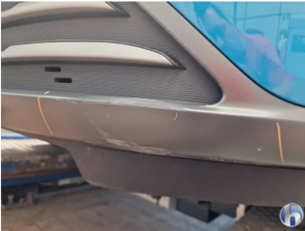
1. Stoßfänger Vorne Kratzer - Smart Repair