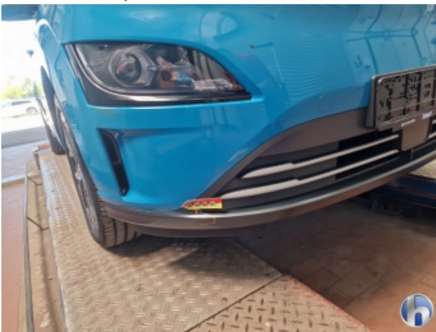
1. Stoßfänger Vorne Kratzer - Smart Repair