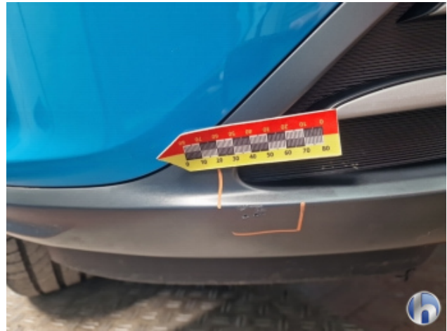
1. Stoßfänger Vorne Kratzer - Smart Repair