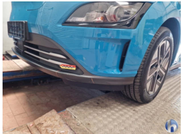
1. Stoßfänger Vorne Kratzer - Smart Repair