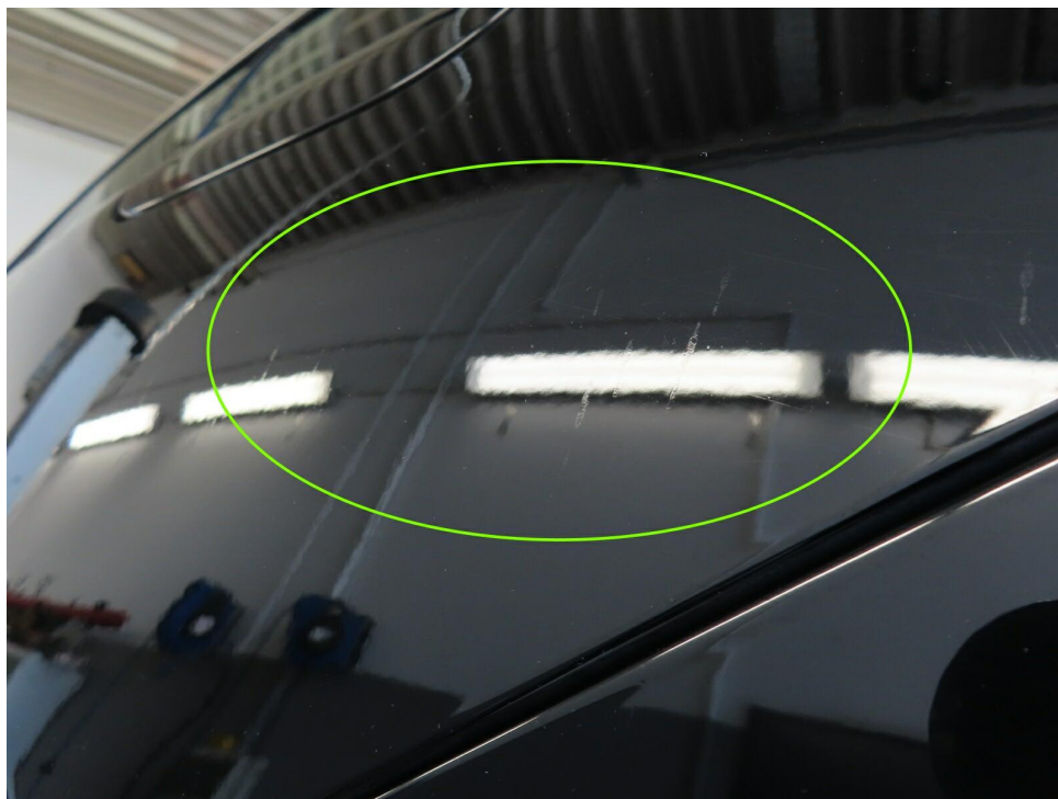
Bild 9 : Seitenteil hinten links Lackierung, Umweltschaden, lackieren