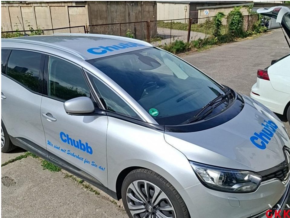
Bild 14. Beschriftungs- / Werbefolie, beklebt, entkleben