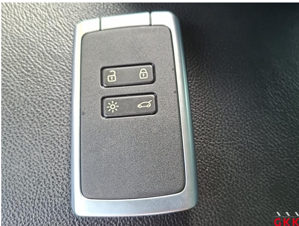
Bild 12. Hauptschlüssel, mit Fernbedienung, funktionsuntüchtig, prüfen