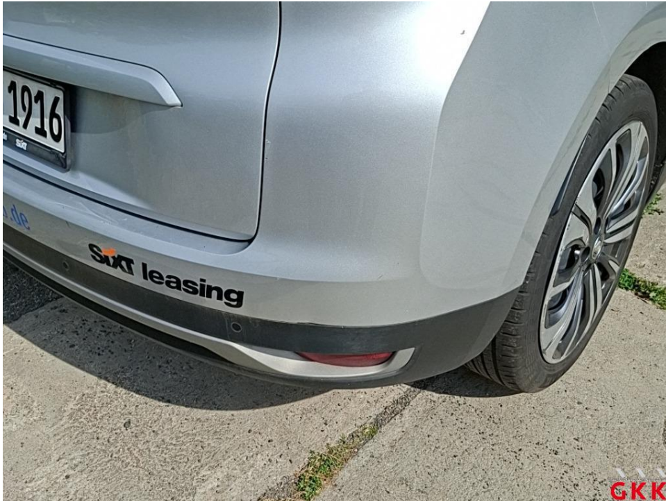
Bild 15. Stoßfänger hinten, Verkleidung oberhalb -lackiert-, beschädigt, ersetzen