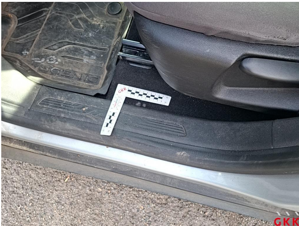
Bild 20. Teppich, vorne links, Brandloch, Smartrepair