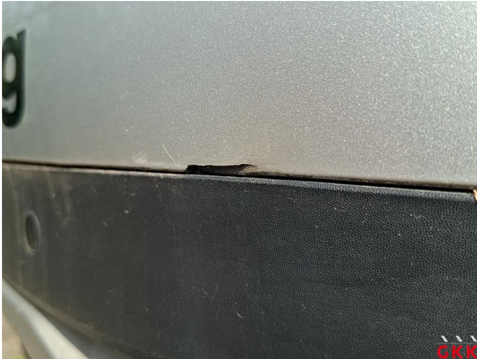
Bild 17. Stoßfänger hinten, Verkleidung oberhalb -lackiert-, beschädigt, ersetzen