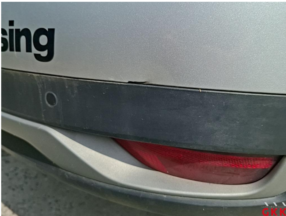
Bild 16. Stoßfänger hinten, Verkleidung oberhalb -lackiert-, beschädigt, ersetzen