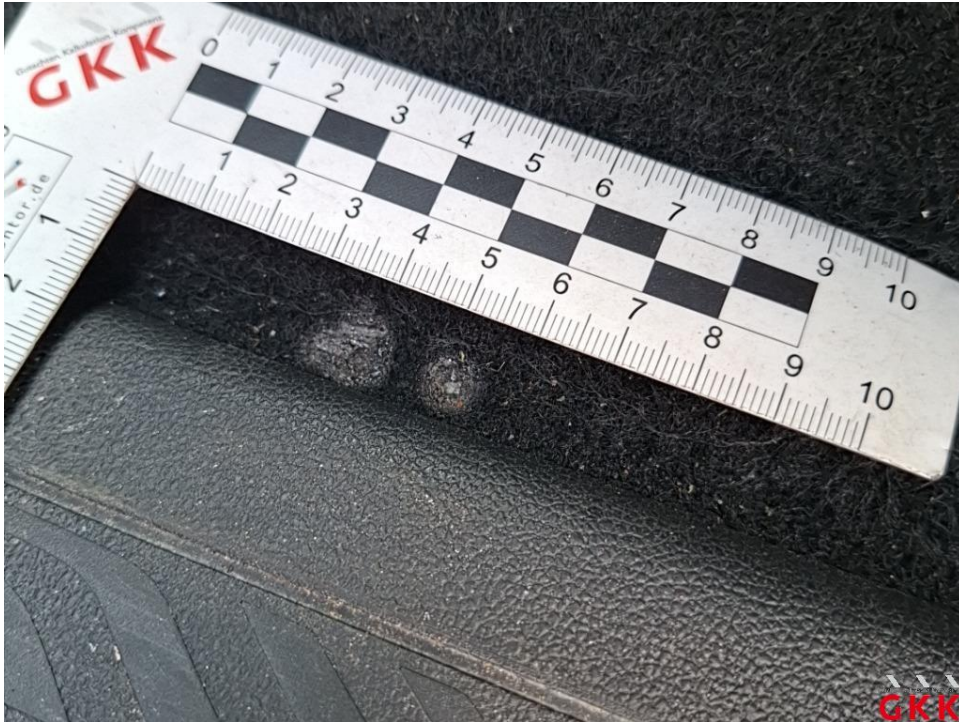
Bild 21. Teppich, vorne links, Brandloch, Smartrepair