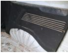
Guarnic int IZ maletero