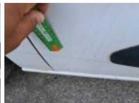
Embellecedor Aleta Tras IZ