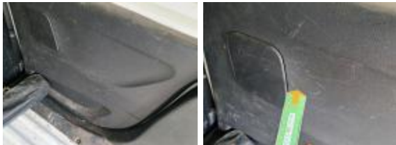
Guarnic Tapa Tras Rayado Reemplazar