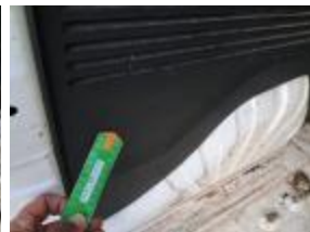
Guarnic int DER maletero