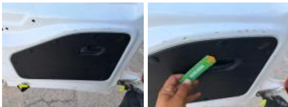
Interior Sucio Limpiar