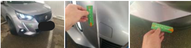
Moulure de pare-chocs AVG, Griffe(s), Peindre