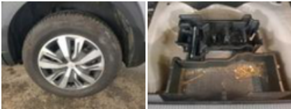
Kit réparation pneu, Manque, Réparer/rempl. (montant forfaitaire)