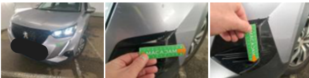
Capot, Bosse(s), PDR - Débosselage ss peinture