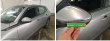
Porte AVG, Bosse(s), LI - Réparer et peindre (complet)