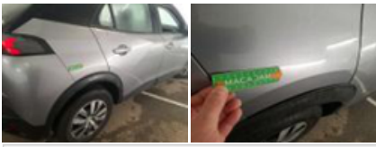
Porte ARD, Bosse(s) et griffe(s), LI - Réparer et peindre (complet)