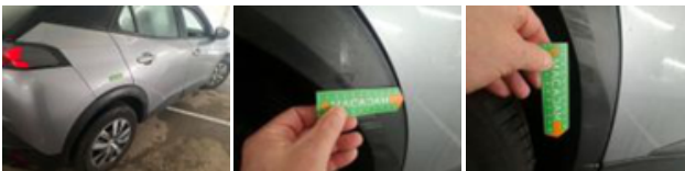
Aile ARD, Griffe(s), 67 - Lustrage