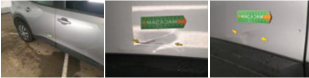
Aile AVD, Griffe(s), 67 - Lustrage