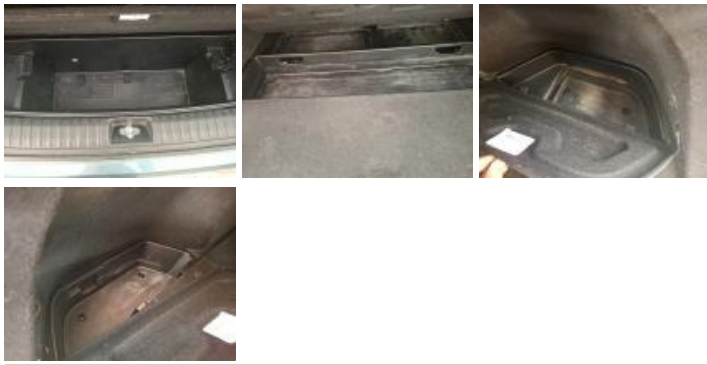
Kit réparation pneu, Manque, Réparer/rempl. (montant forfaitaire)