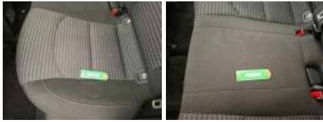
Garniture montant Mil G, Griffe(s), Réparer/rempl. (montant forfaitaire)