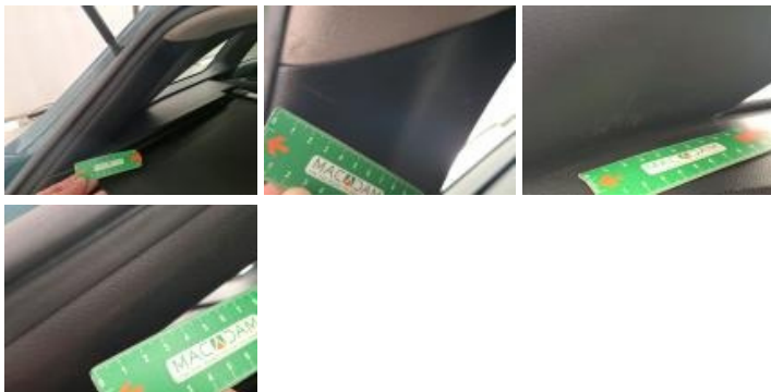
Garn mont pavillon ARD, Griffe(s), Réparer/rempl. (montant forfaitaire)