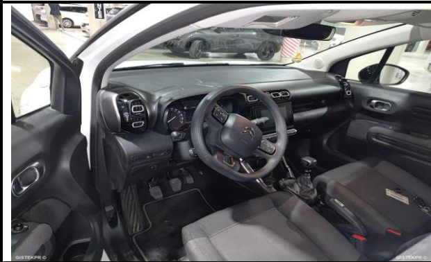
Foto daños internos 13