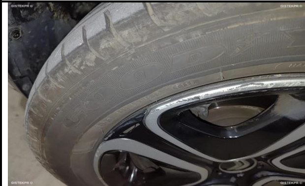
FLLAN_WHATSAPP IMAGE 2025-11-17 AT 16.25.00 (5).JPEG