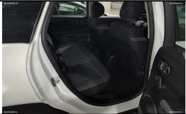
FASTRAS_WHATSAPP IMAGE 2025-11-17 AT 16.25.01 (5).JPEG