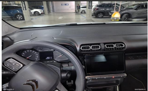
Foto daños internos 13