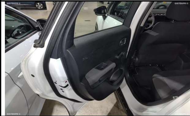
Foto daños internos 13