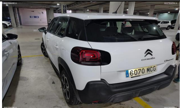
FTLTI_WHATSAPP IMAGE 2025-11-17 AT 16.25.03 (2).JPEG