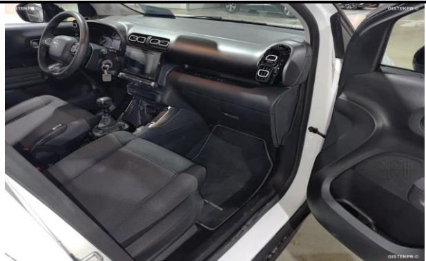
FSALP_WHATSAPP IMAGE 2025-11-17 AT 16.25.01 (1).JPEG