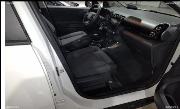
FASDEL_WHATSAPP IMAGE 2025-11-17 AT 16.25.01 (2).JPEG