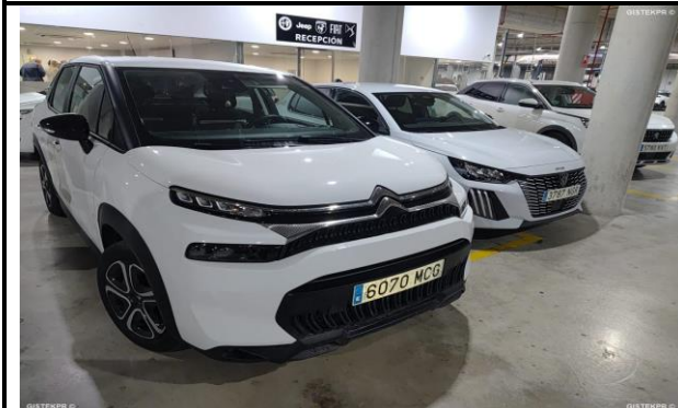
FFLTD_WHATSAPP IMAGE 2025-11-17 AT 16.25.03 (1).JPEG