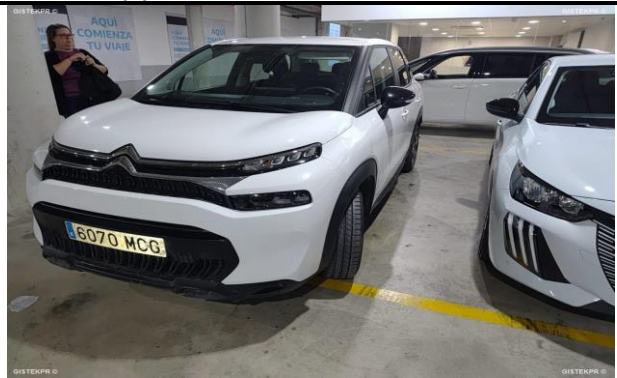
FFLTI_WHATSAPP IMAGE 2025-11-17 AT 16.25.02 (8).JPEG