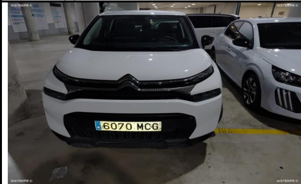
FDEL_WHATSAPP IMAGE 2025-11-17 AT 16.25.02 (7).JPEG