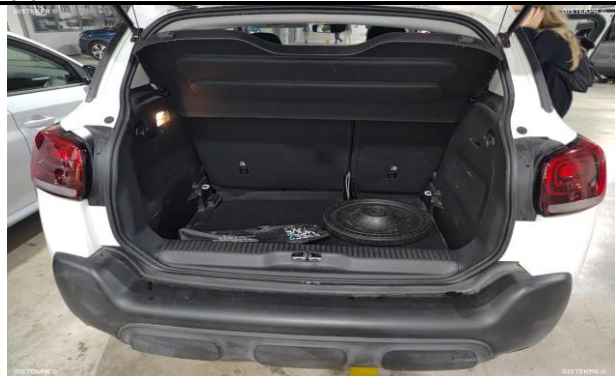
FMLTRO_WHATSAPP IMAGE 2025-11-17 AT 16.25.03 (4).JPEG