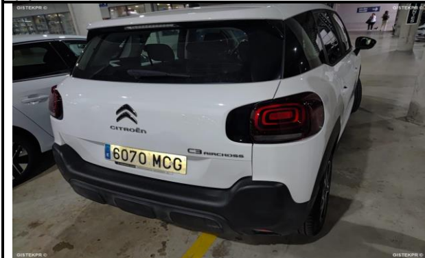
FLTD_WHATSAPP IMAGE 2025-11-17 AT 16.25.03 (3).JPEG