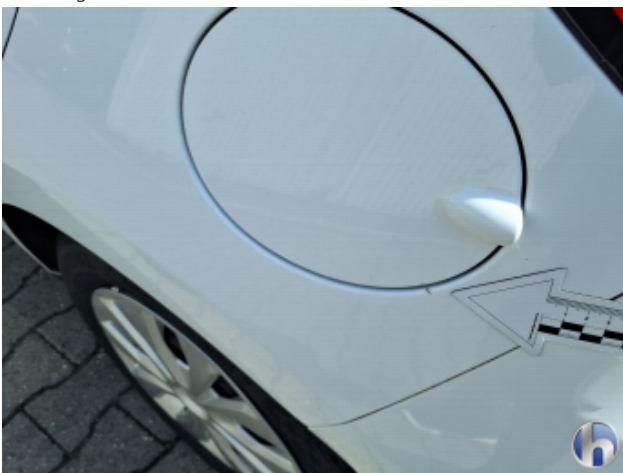
1. Seitenwand - Hinten - Links Kratzer - Auslegen / Polieren