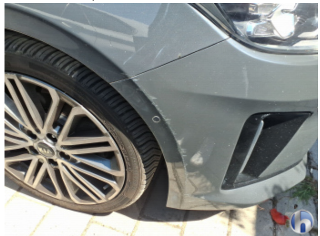
5. Stoßfänger Vorne Beschädigt - Lackieren