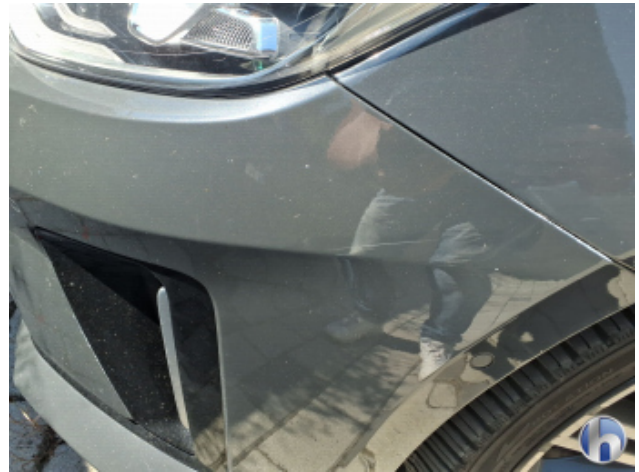
3. Stoßfänger Vorne Kratzer - Smart Repair