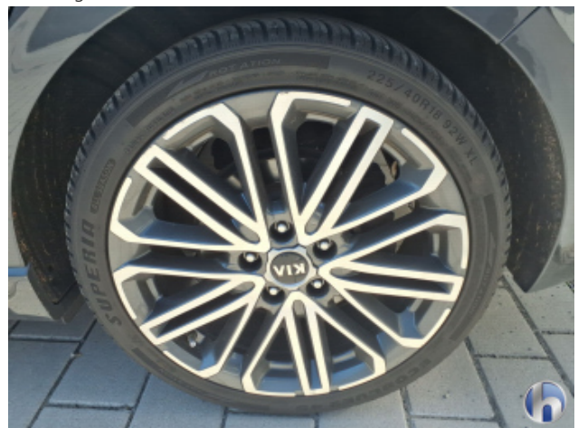
1. Felge Hinten - Links Kratzer - Smart Repair