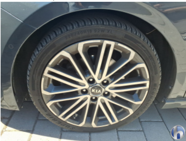
4. Felge Vorne - Links Kratzer - Smart Repair