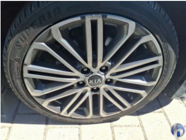
2. Felge Vorne - Rechts Kratzer - Smart Repair