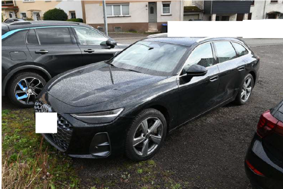
Bild 1 Frontansicht links