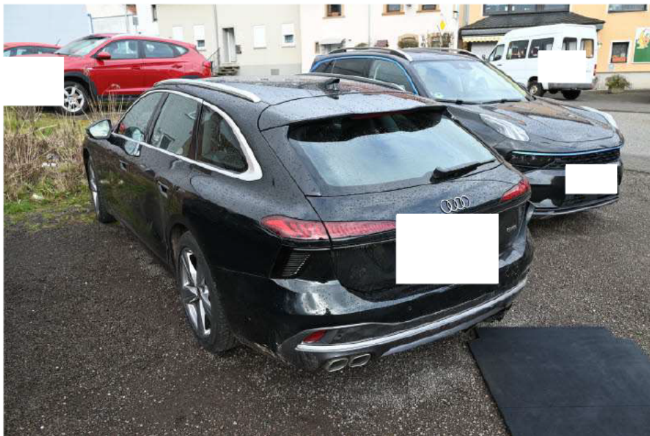
Bild 4 Heckansicht links