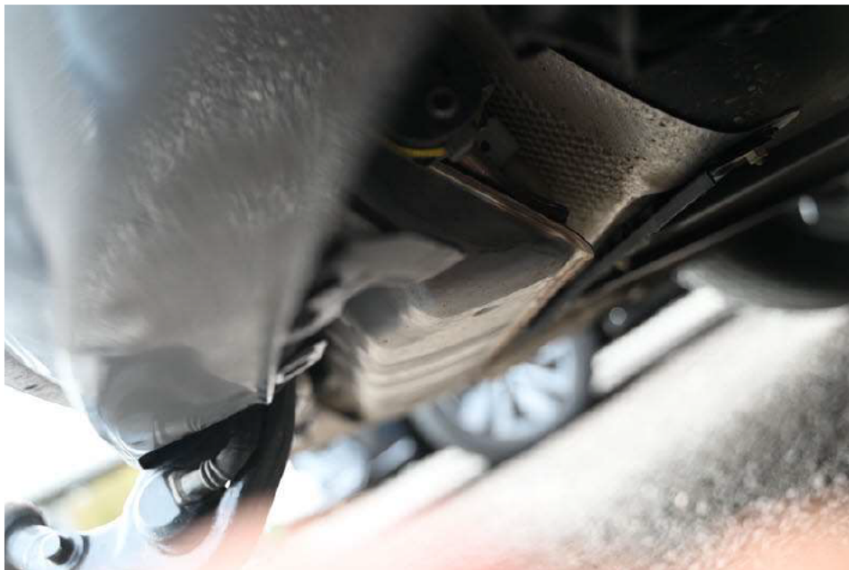
Bild 14 Anhängerkupplung beschädigt