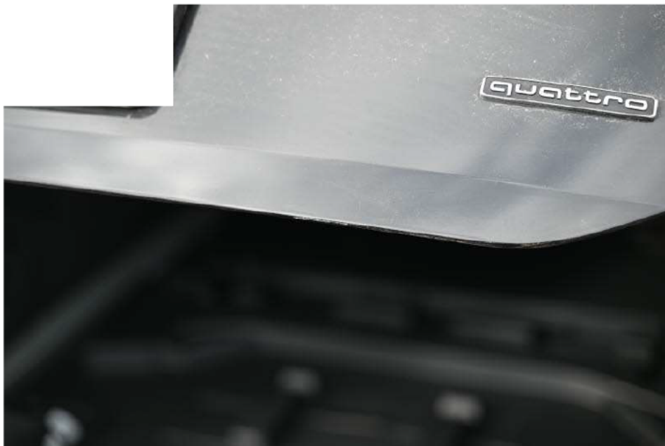
Bild 8 Heckklappe unten Lackschaden