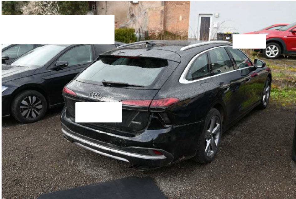
Bild 3 Heckansicht rechts