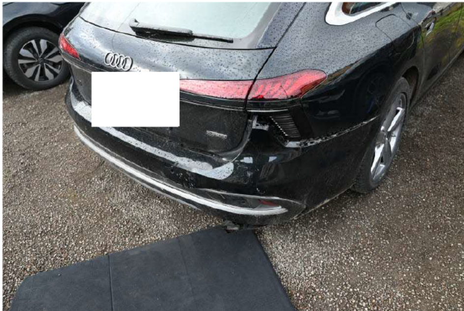
Bild 6 Stossfänger hinten rechts gerissen