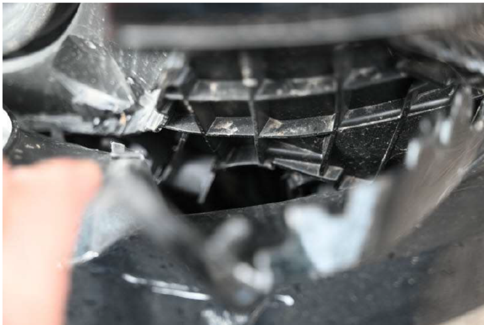
Bild 10 Heckwand rechts gedellt