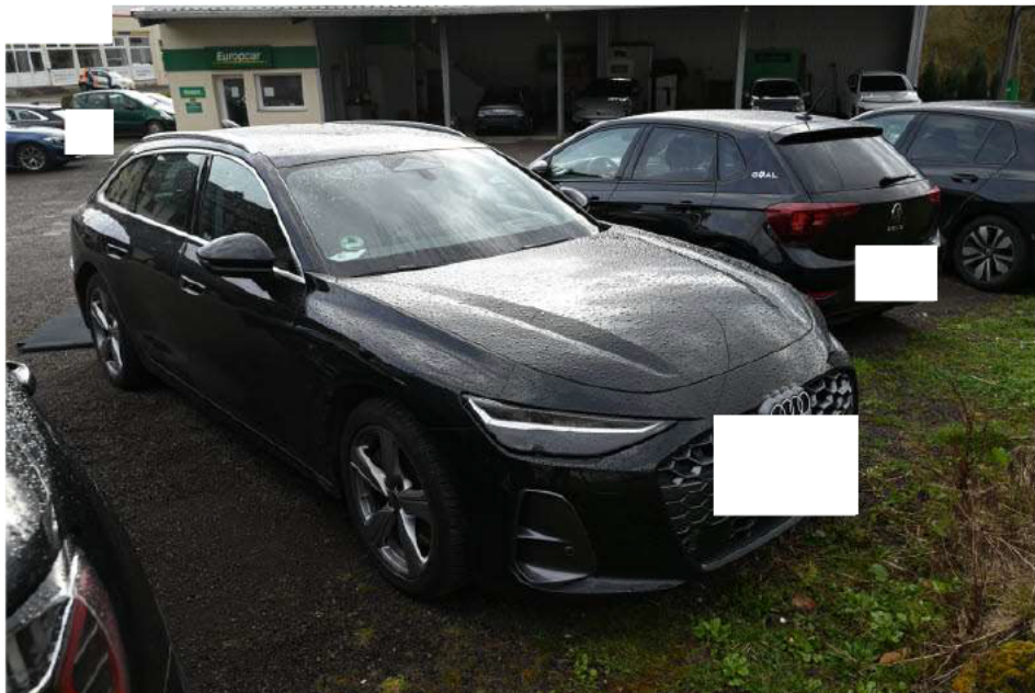
Bild 2 Frontansicht rechts