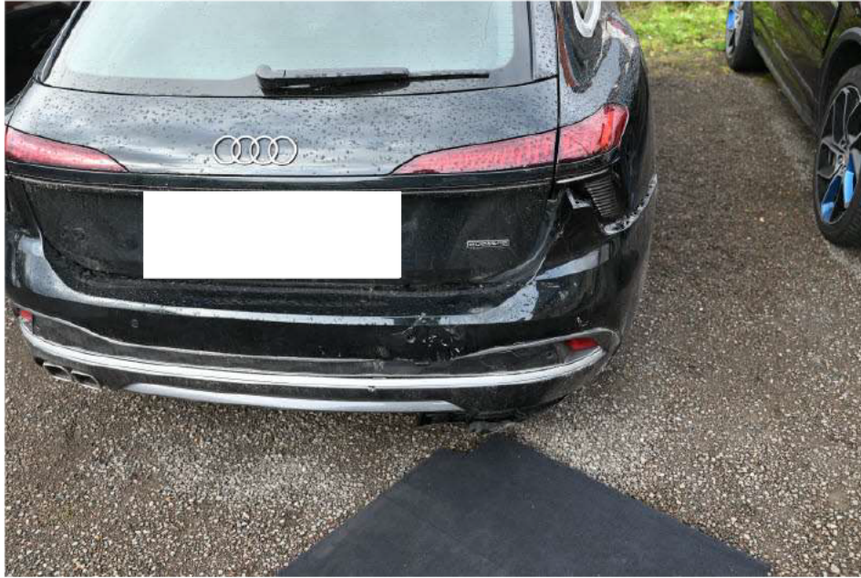
Bild 5 Übersicht Schadenbereich hinten rechts