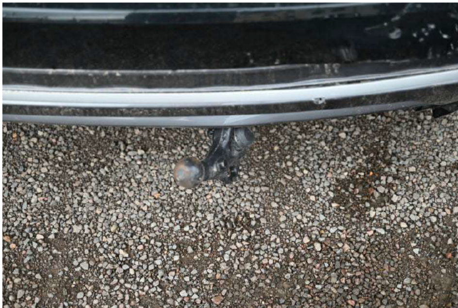
Bild 12 Anhängerkupplung