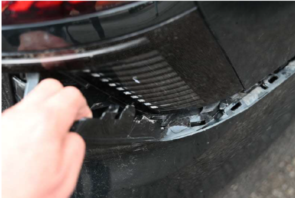
Bild 17 Rücklicht aussen rechts Kratzer