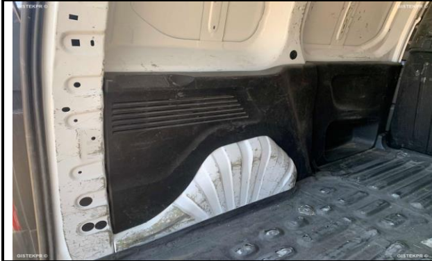
Foto daños internos 24