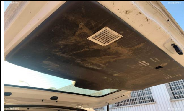
Foto daños internos 24