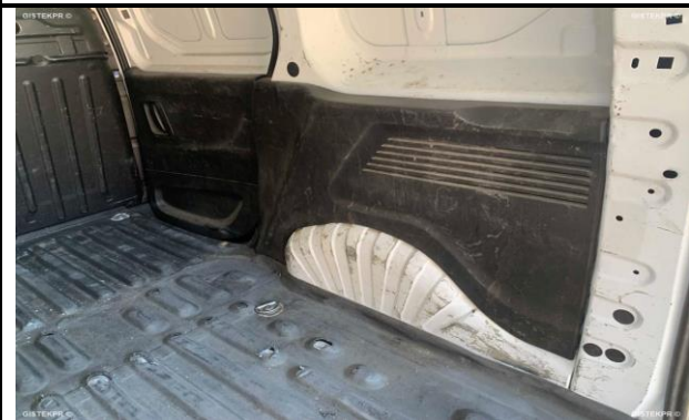
Foto daños internos 24