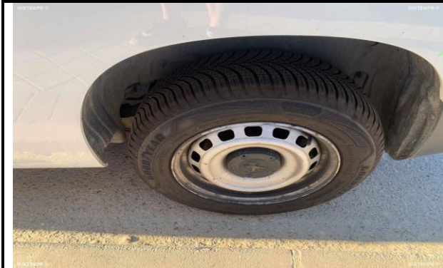
FESD IMG 0029