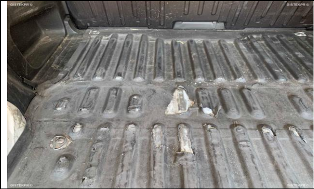
Foto daños internos 24