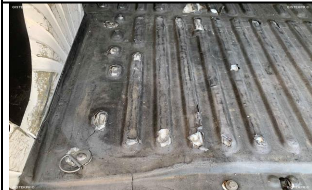
Foto daños internos 24