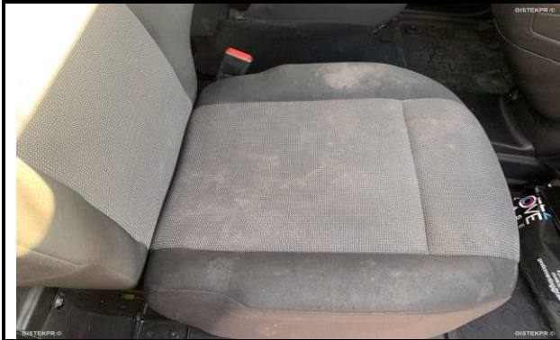
Foto daños internos 24