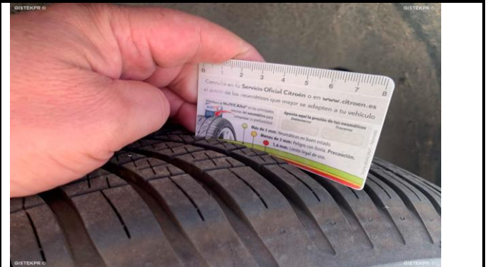
FESD IMG 0030