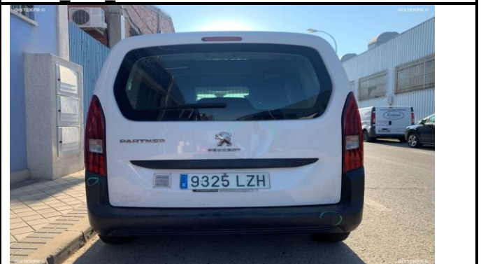
FTRAS IMG 0035