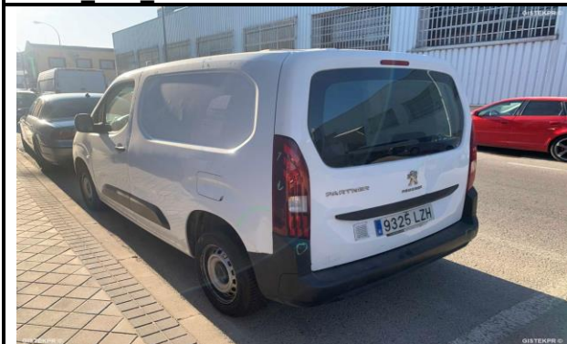
FTLTI IMG 0034