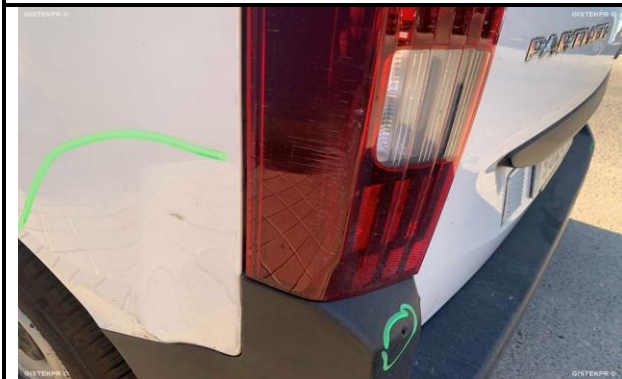
Foto daños externos 1