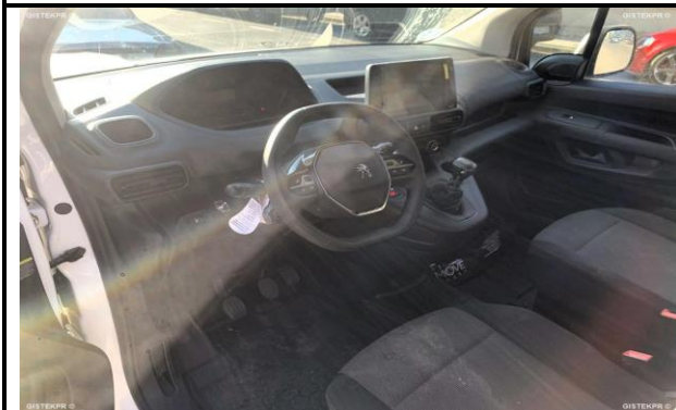
Foto daños internos 24