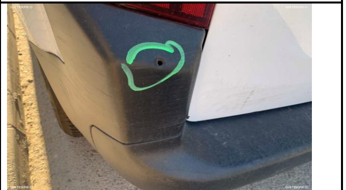
Foto daños externos 1