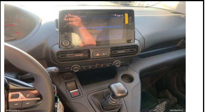
Foto daños internos 24