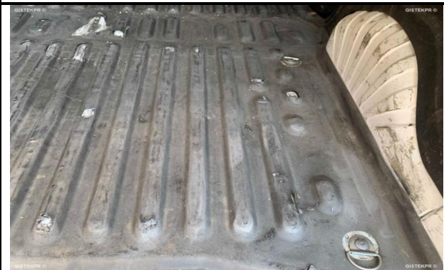
Foto daños internos 24