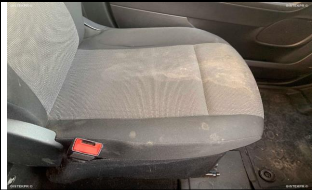
Foto daños internos 24