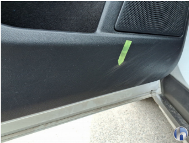
9. Verkleidung Gebrauchsspuren - Ohne Reparatur