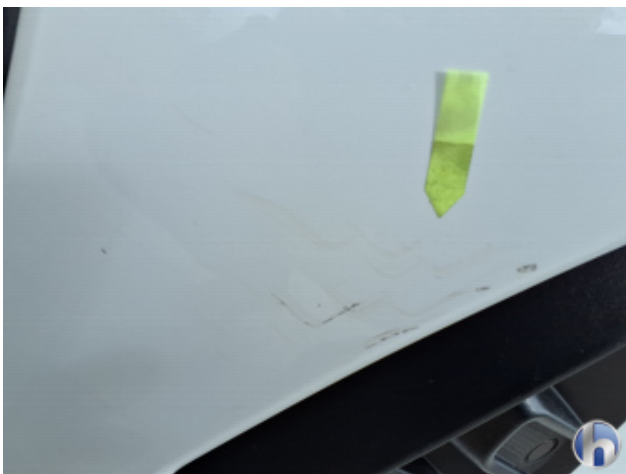
1. Stoßfänger Vorne Kratzer - Instandsetzen und Lackieren