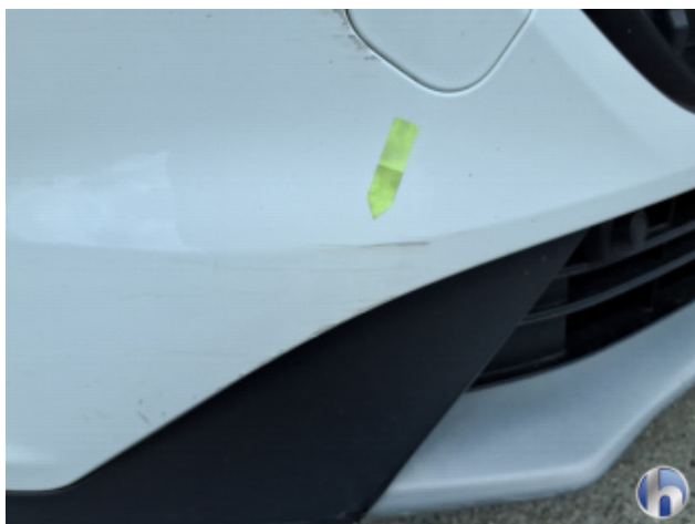
1. Stoßfänger Vorne Kratzer - Instandsetzen und Lackieren