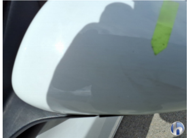
6. Tür Vorne - Links Oberflächenkratzer - Aufbereiten / Polieren