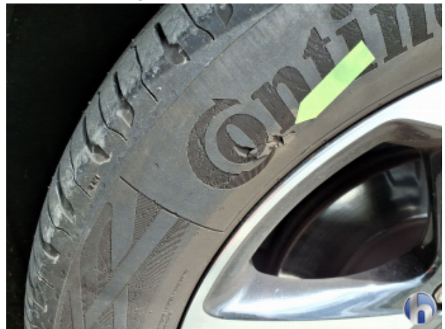
11. Reifen Vorne - Rechts Riss - Erneuern