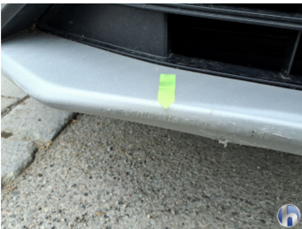
1. Stoßfänger Vorne Kratzer - Instandsetzen und Lackieren