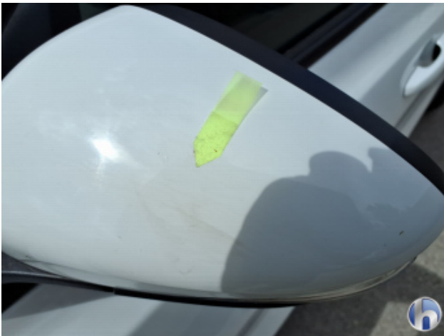
6. Tür Vorne - Links Oberflächenkratzer - Aufbereiten / Polieren