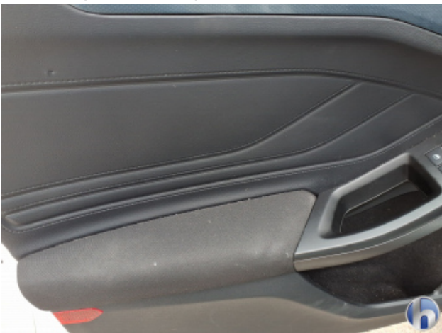
9. Verkleidung Gebrauchsspuren - Ohne Reparatur