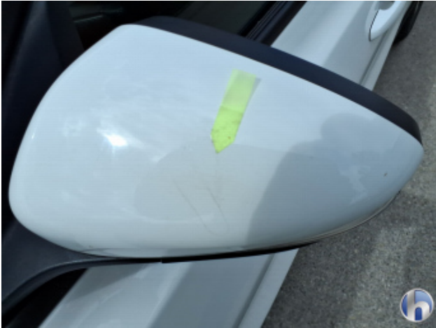
6. Tür Vorne - Links Oberflächenkratzer - Aufbereiten / Polieren