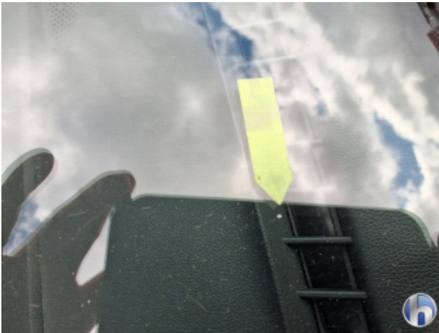
3. Windschutzscheibe Steinschlag - Smart Repair