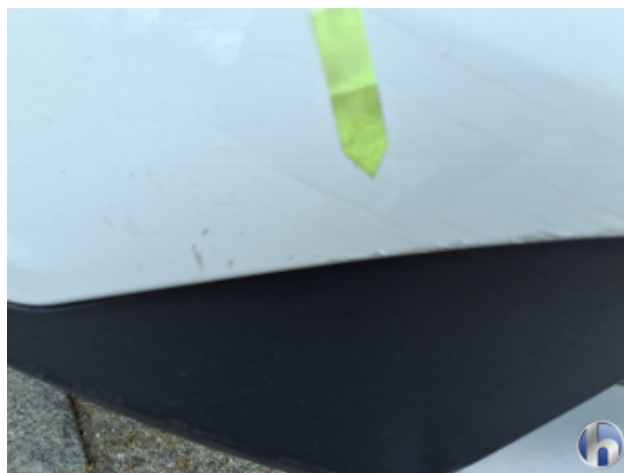
1. Stoßfänger Vorne Kratzer - Instandsetzen und Lackieren