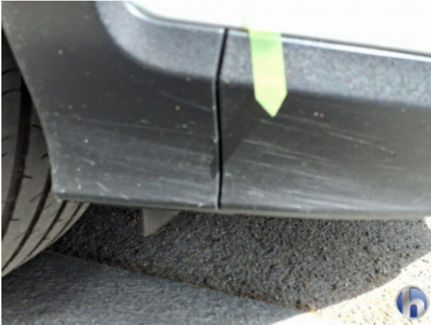
1. Stoßfänger Vorne Kratzer - Instandsetzen und Lackieren