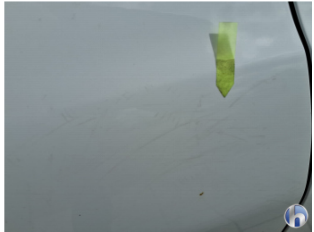
4. Tür Hinten - Rechts Oberflächenkratzer - Aufbereiten / Polieren