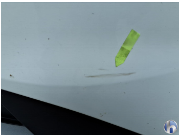
1. Stoßfänger Vorne Kratzer - Instandsetzen und Lackieren