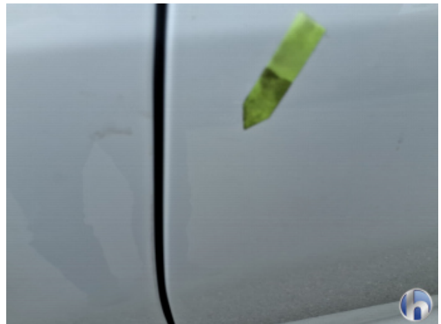
7. Tür Hinten - Links Oberflächenkratzer - Aufbereiten / Polieren