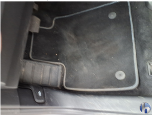
10. Sitz Innenraum rechts vorne Verschmutzt - Reinigen