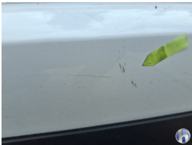
2. Stoßfänger Hinten Kratzer - Smart Repair