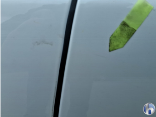
7. Tür Hinten - Links Oberflächenkratzer - Aufbereiten / Polieren