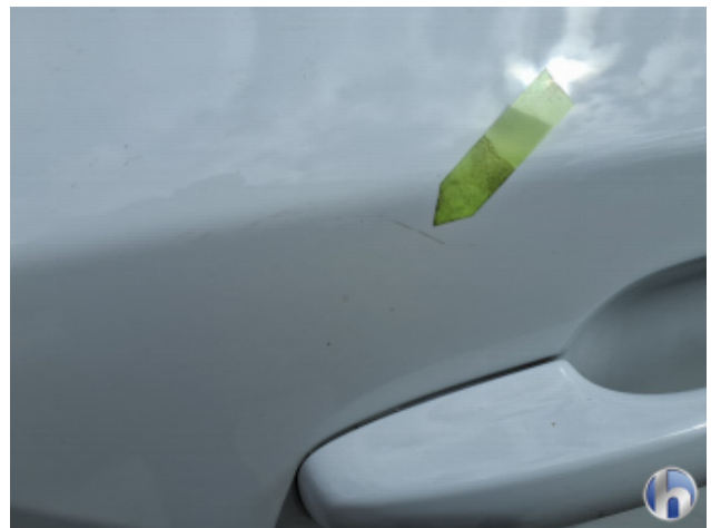
4. Tür Hinten - Rechts Oberflächenkratzer - Aufbereiten / Polieren