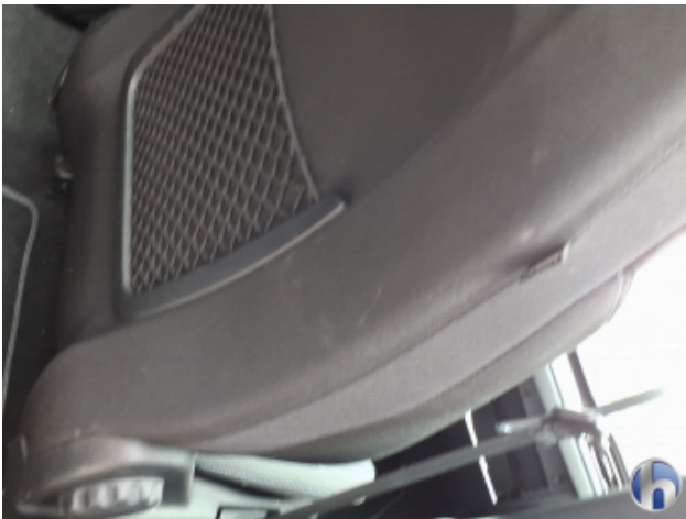
10. Sitz Innenraum rechts vorne Verschmutzt - Reinigen