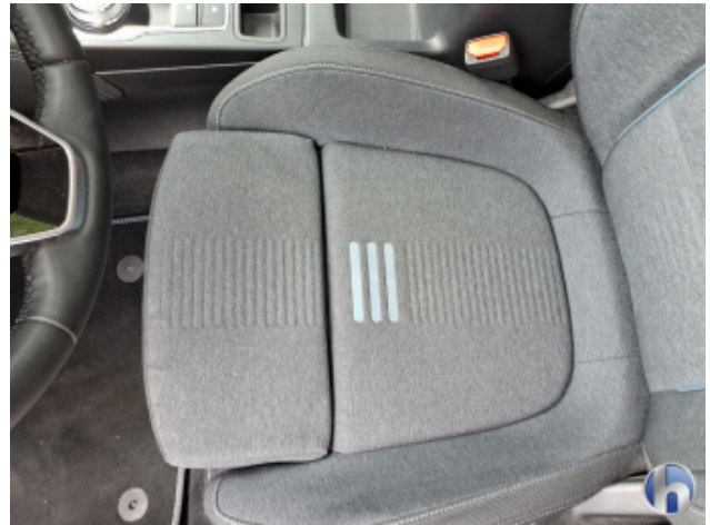
10. Sitz Innenraum rechts vorne Verschmutzt - Reinigen