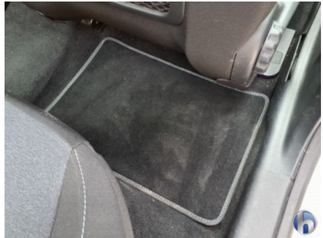
10. Sitz Innenraum rechts vorne Verschmutzt - Reinigen