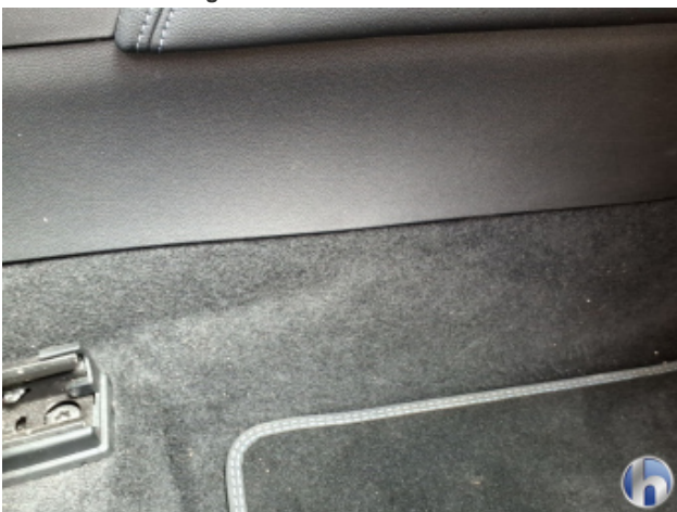
10. Sitz Innenraum rechts vorne Verschmutzt - Reinigen