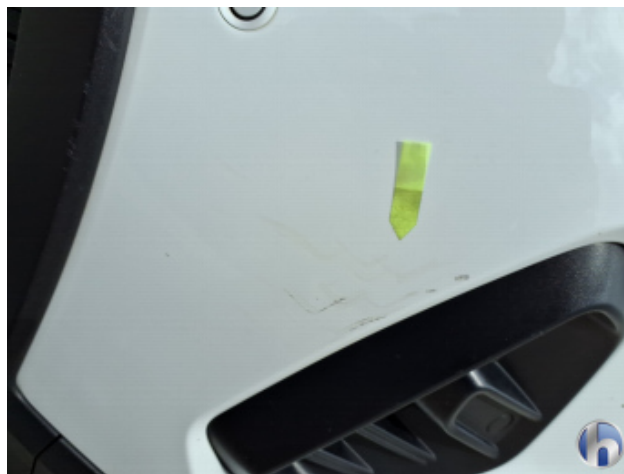
1. Stoßfänger Vorne Kratzer - Instandsetzen und Lackieren