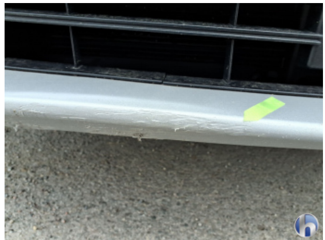
1. Stoßfänger Vorne Kratzer - Instandsetzen und Lackieren