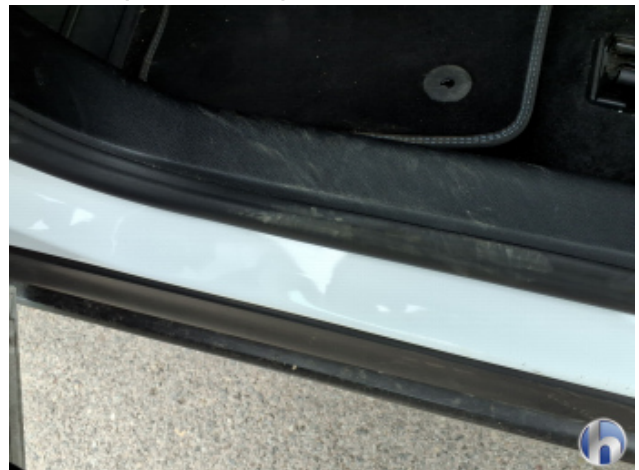
9. Verkleidung Gebrauchsspuren - Ohne Reparatur