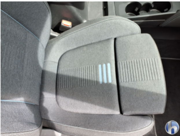
10. Sitz Innenraum rechts vorne Verschmutzt - Reinigen