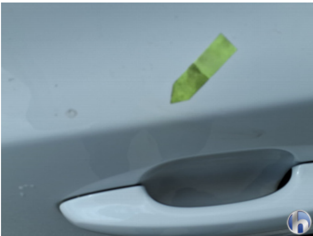
7. Tür Hinten - Links Oberflächenkratzer - Aufbereiten / Polieren