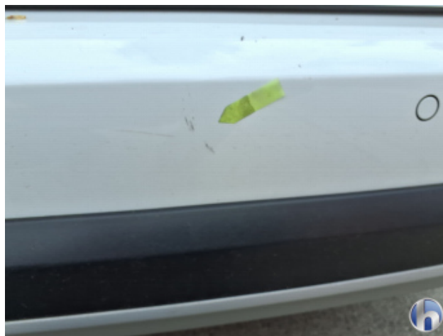
2. Stoßfänger Hinten Kratzer - Smart Repair