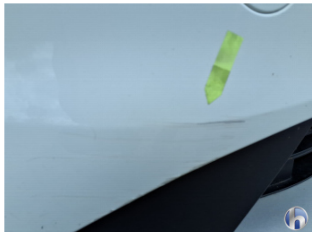
1. Stoßfänger Vorne Kratzer - Instandsetzen und Lackieren