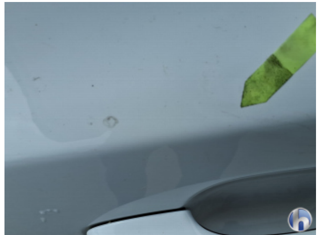
7. Tür Hinten - Links Oberflächenkratzer - Aufbereiten / Polieren