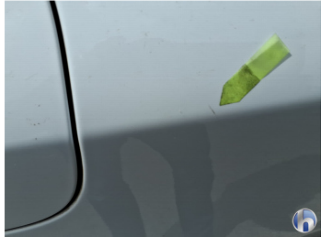
8. Seitenwand - Hinten - Links Krater - Smart Repair