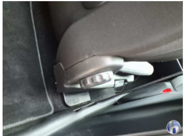
10. Sitz Innenraum rechts vorne Verschmutzt - Reinigen