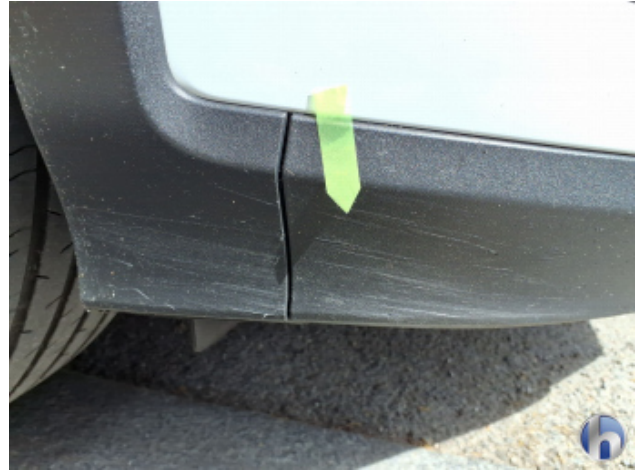
1. Stoßfänger Vorne Kratzer - Instandsetzen und Lackieren