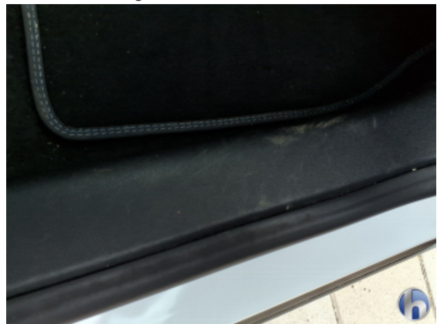
10. Sitz Innenraum rechts vorne Verschmutzt - Reinigen