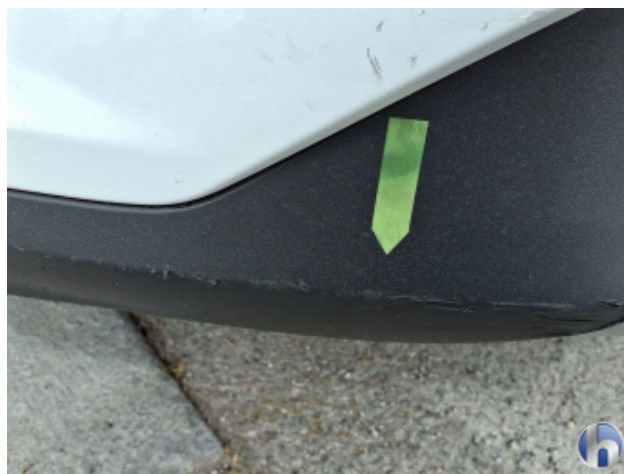
1. Stoßfänger Vorne Kratzer - Instandsetzen und Lackieren