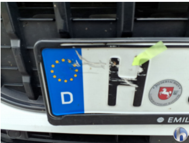
1. Stoßfänger Vorne Kratzer - Instandsetzen und Lackieren