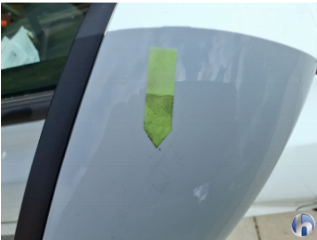
5. Tür Vorne - Rechts Gebrauchsspuren - Ohne Reparatur