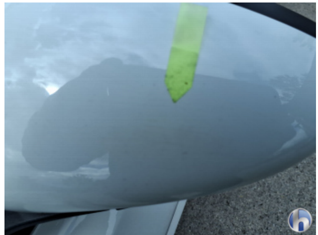
6. Tür Vorne - Links Oberflächenkratzer - Aufbereiten / Polieren