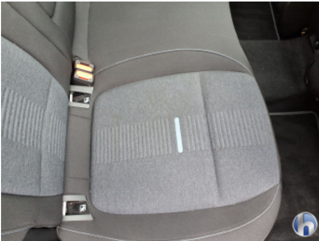
10. Sitz Innenraum rechts vorne Verschmutzt - Reinigen