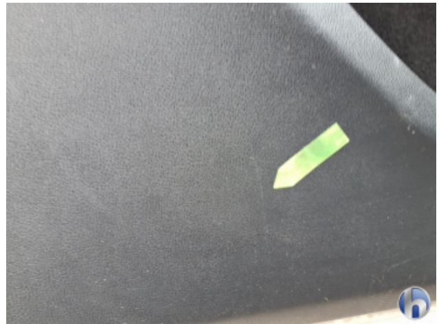
9. Verkleidung Gebrauchsspuren - Ohne Reparatur