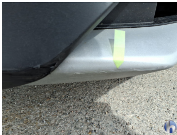
1. Stoßfänger Vorne Kratzer - Instandsetzen und Lackieren