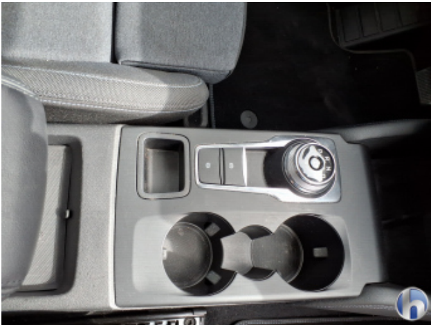
10. Sitz Innenraum rechts vorne Verschmutzt - Reinigen