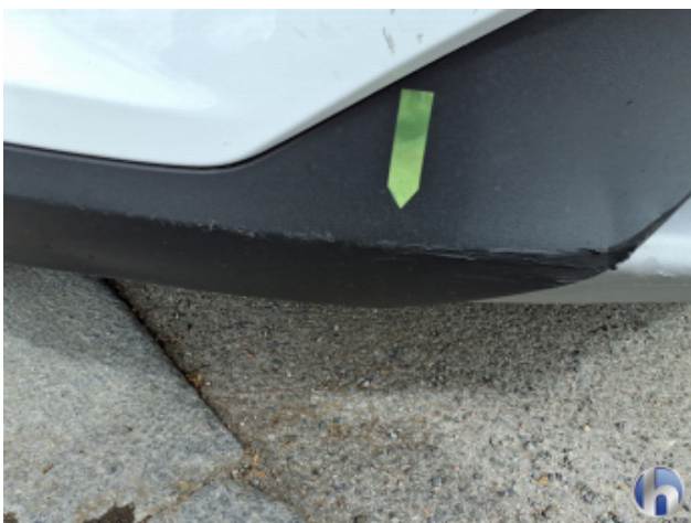
1. Stoßfänger Vorne Kratzer - Instandsetzen und Lackieren