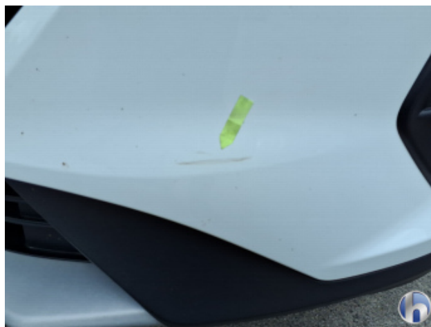
1. Stoßfänger Vorne Kratzer - Instandsetzen und Lackieren