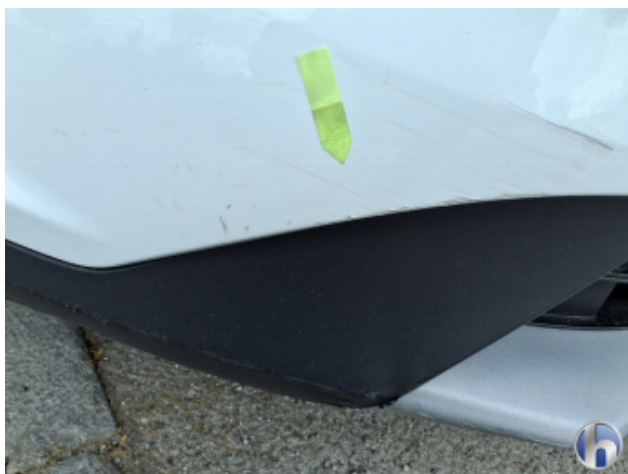
1. Stoßfänger Vorne Kratzer - Instandsetzen und Lackieren