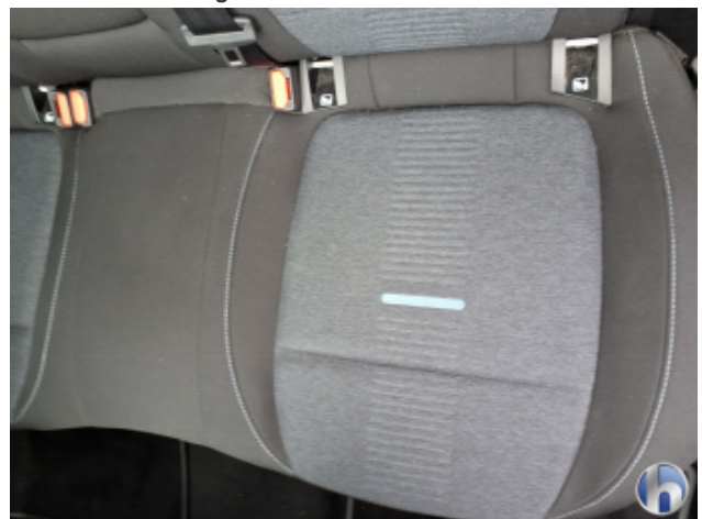
10. Sitz Innenraum rechts vorne Verschmutzt - Reinigen