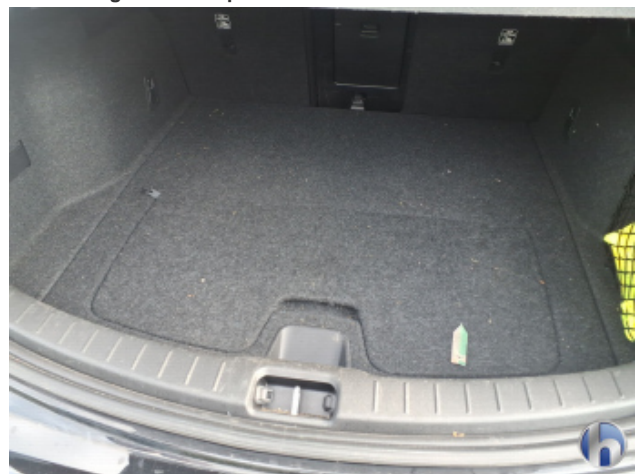
7. Innenraum Verschmutzt - Reinigen