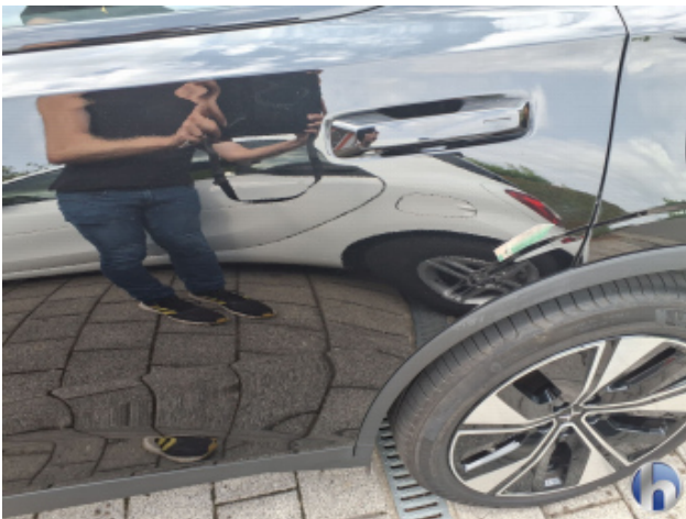
1. Tür Hinten - Links Kratzer - Lackieren