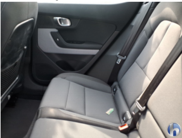
8. Sitz Innenraum links vorne Verschmutzt - Reinigen