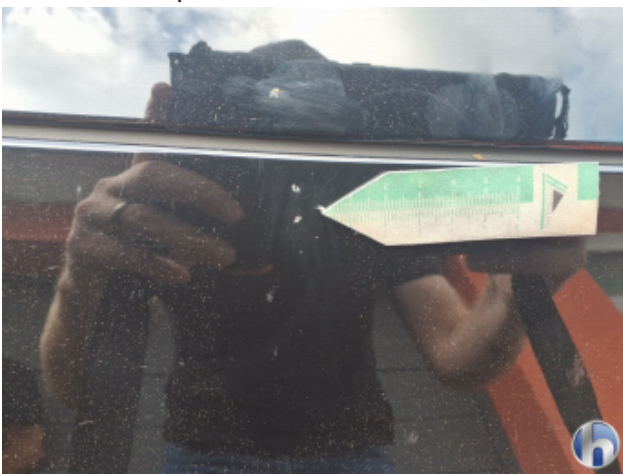
6. Stoßfänger Vorne Steinschlag - Smart Repair