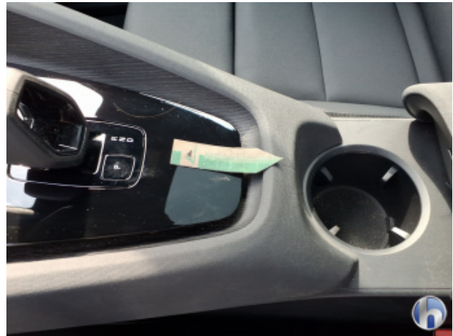
8. Sitz Innenraum links vorne Verschmutzt - Reinigen