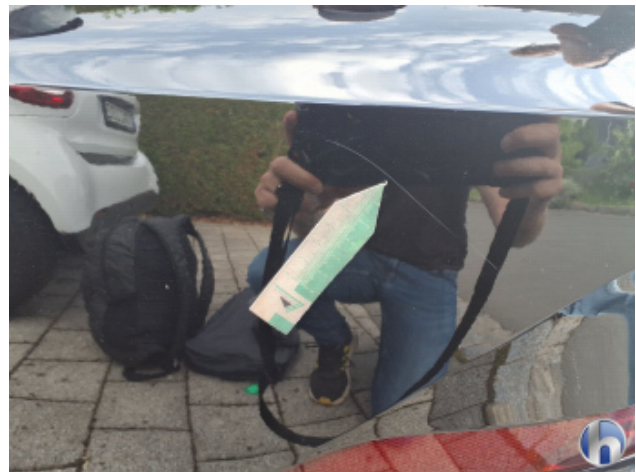
4. Stoßfänger Hinten Kratzer - Lackieren