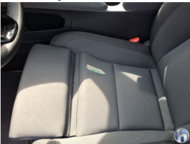
8. Sitz Innenraum links vorne Verschmutzt - Reinigen