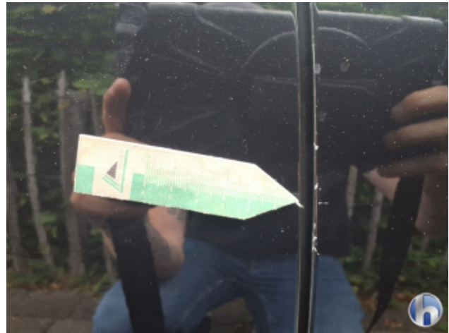
3. Tür Vorne - Rechts Kratzer - Smart Repair