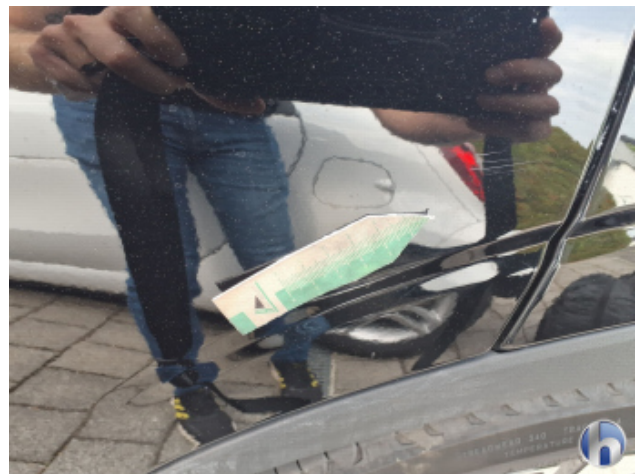
1. Tür Hinten - Links Kratzer - Lackieren