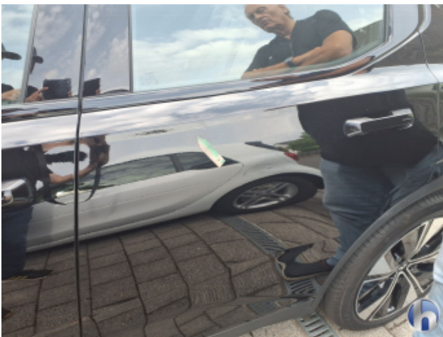
1. Tür Hinten - Links Kratzer - Lackieren