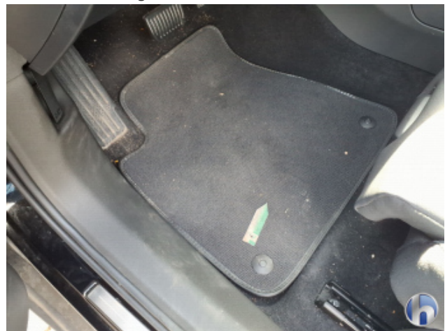
8. Sitz Innenraum links vorne Verschmutzt - Reinigen