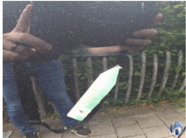
5. Tür Hinten - Rechts Kratzer - Smart Repair