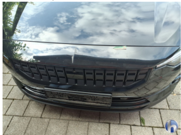
6. Stoßfänger Vorne Steinschlag - Smart Repair