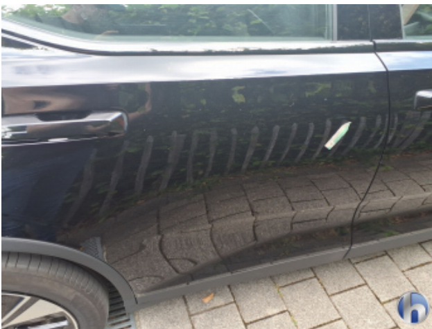
5. Tür Hinten - Rechts Kratzer - Smart Repair