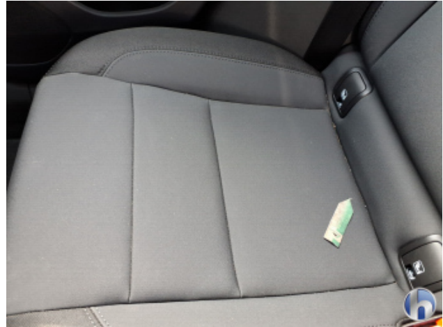
8. Sitz Innenraum links vorne Verschmutzt - Reinigen