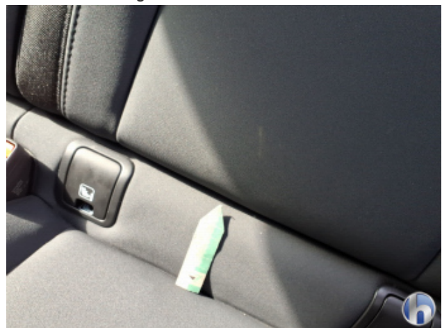
8. Sitz Innenraum links vorne Verschmutzt - Reinigen