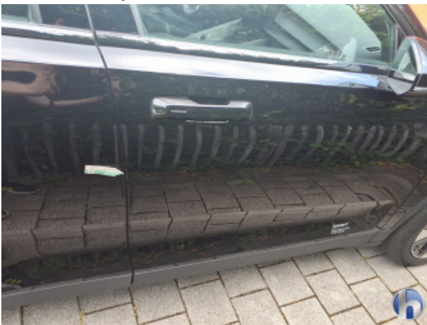
3. Tür Vorne - Rechts Kratzer - Smart Repair