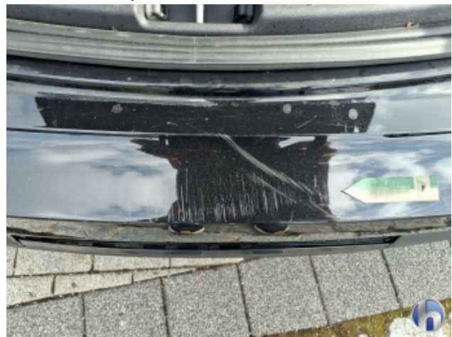
4. Stoßfänger Hinten Kratzer - Lackieren