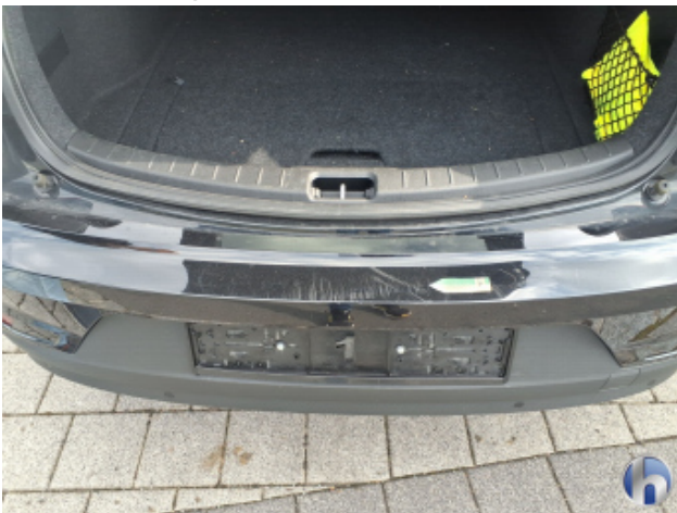
4. Stoßfänger Hinten Kratzer - Lackieren