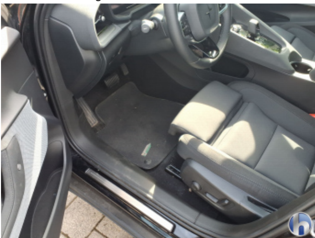
8. Sitz Innenraum links vorne Verschmutzt - Reinigen