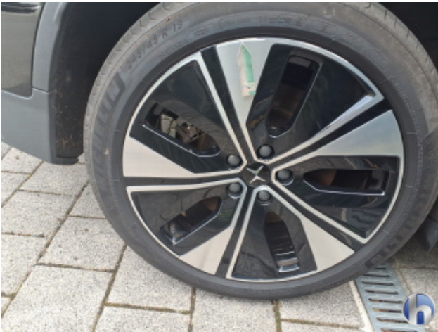
2. Felge Hinten - Rechts Kratzer - Smart Repair