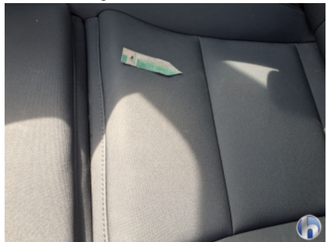
8. Sitz Innenraum links vorne Verschmutzt - Reinigen