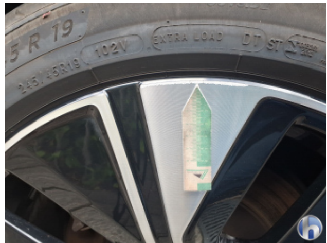
2. Felge Hinten - Rechts Kratzer - Smart Repair