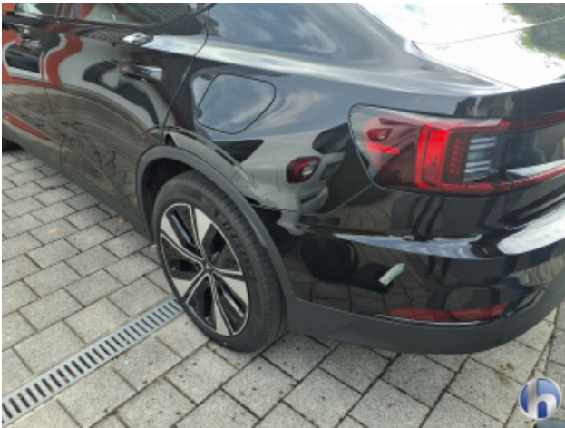
4. Stoßfänger Hinten Kratzer - Lackieren