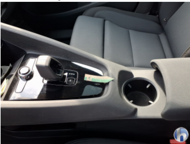
8. Sitz Innenraum links vorne Verschmutzt - Reinigen