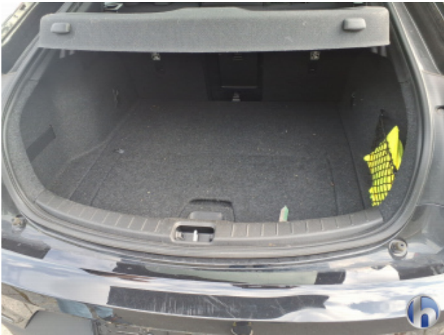
7. Innenraum Verschmutzt - Reinigen