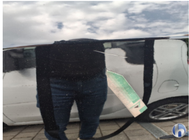
1. Tür Hinten - Links Kratzer - Lackieren