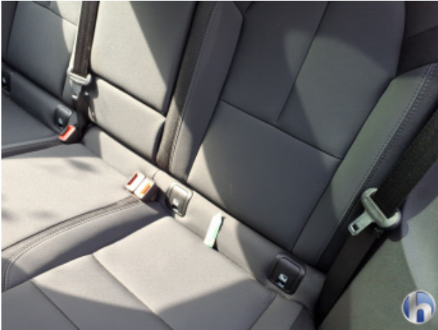
8. Sitz Innenraum links vorne Verschmutzt - Reinigen