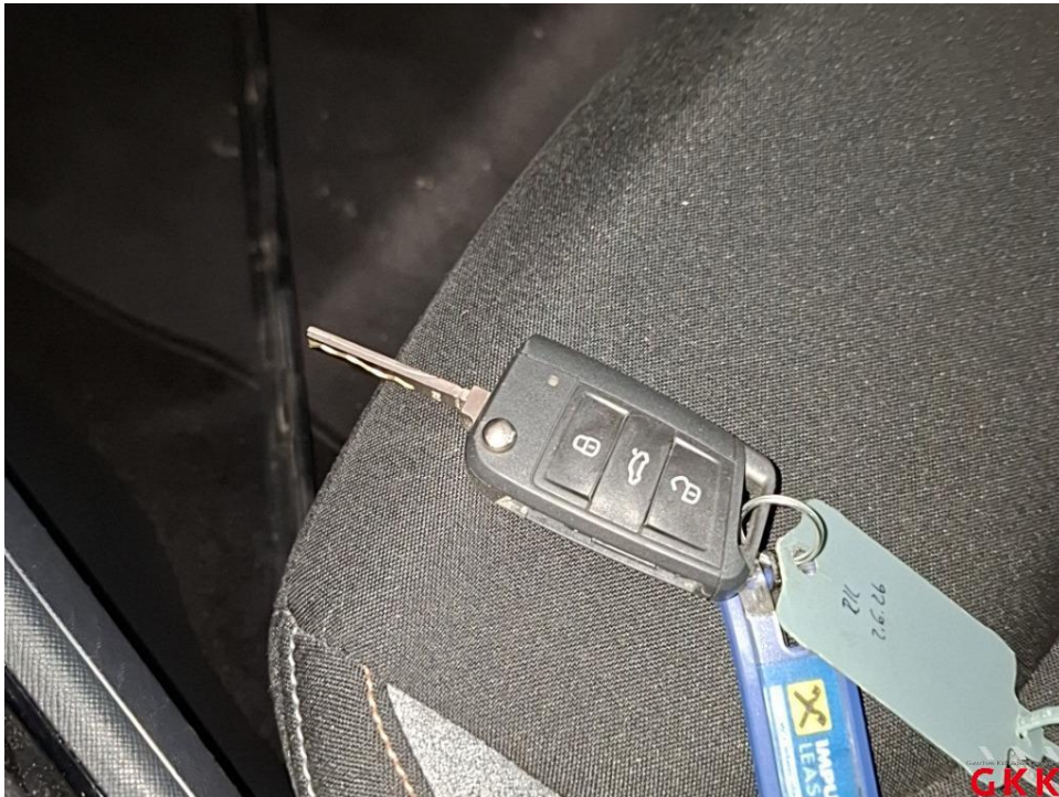
Bild 15 Hauptschlüssel, mit Fernbedienung, fehlt, ersetzen