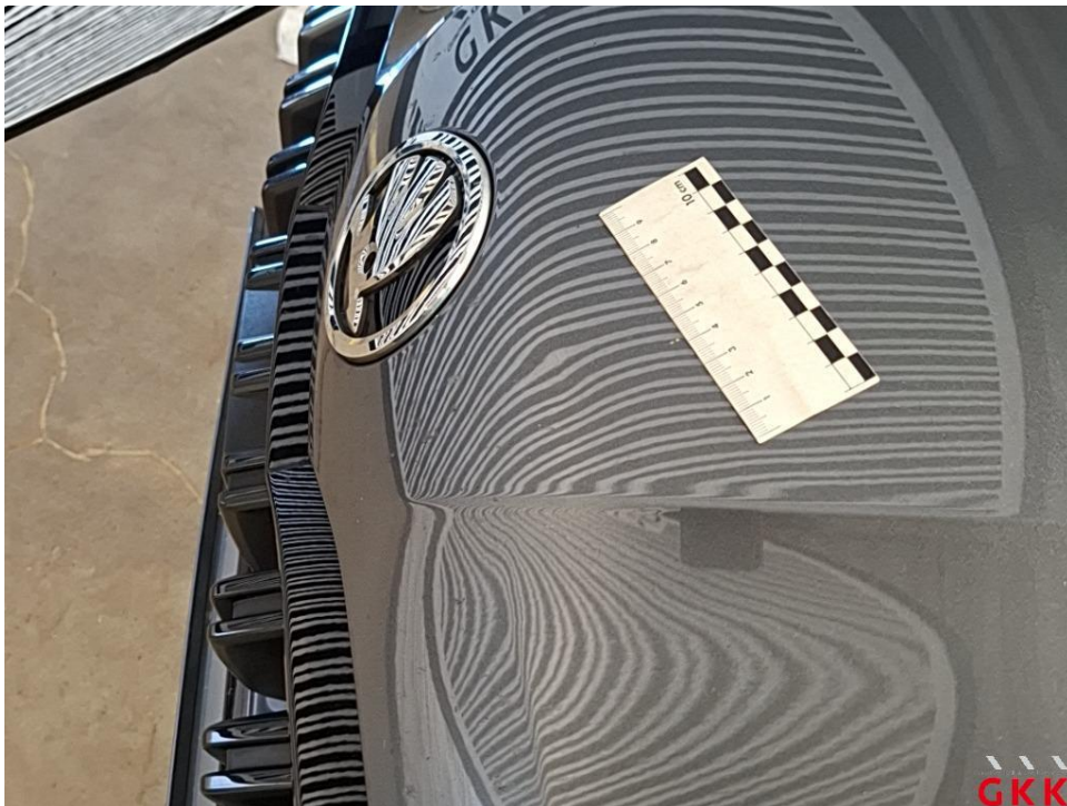
Bild 20 Motorhaube, beschädigt, kalt drücken