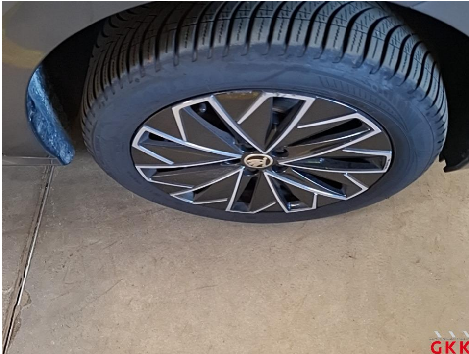
Bild 17 LM-Rad, vorne rechts, Materialabtrag, ersetzen