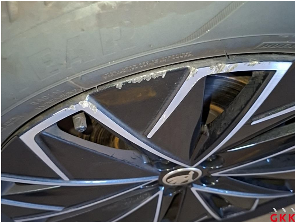
Bild 19 LM-Rad, vorne rechts, Materialabtrag, ersetzen