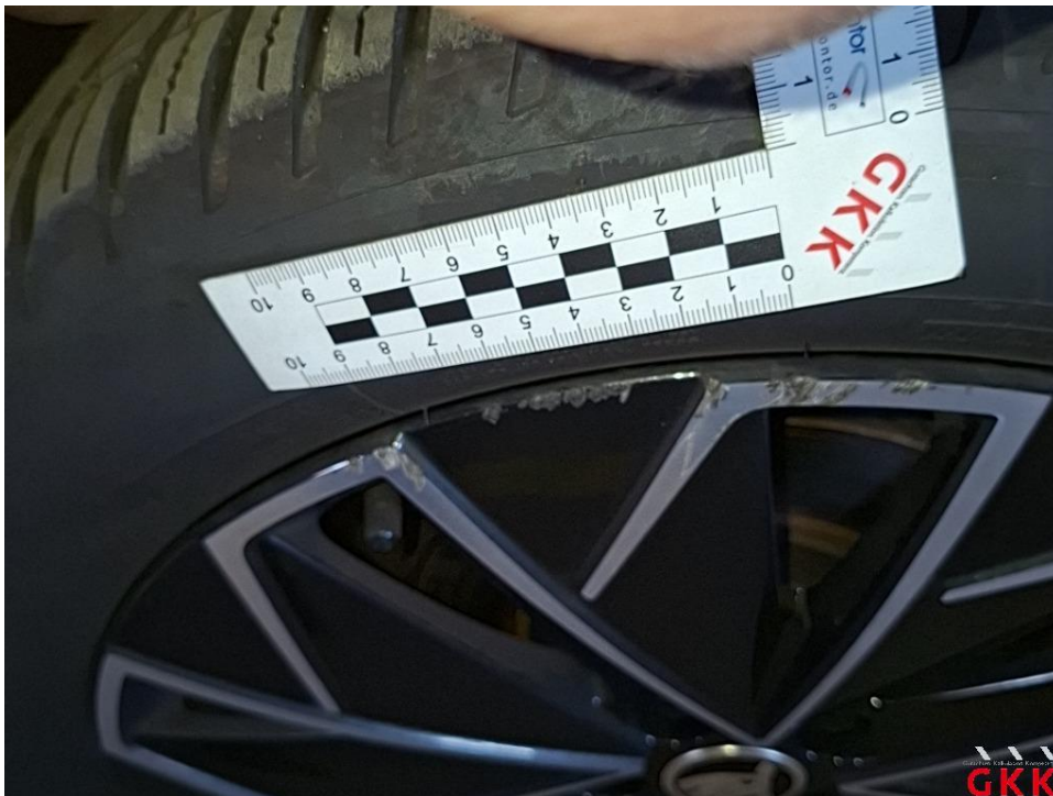
Bild 18 LM-Rad, vorne rechts, Materialabtrag, ersetzen