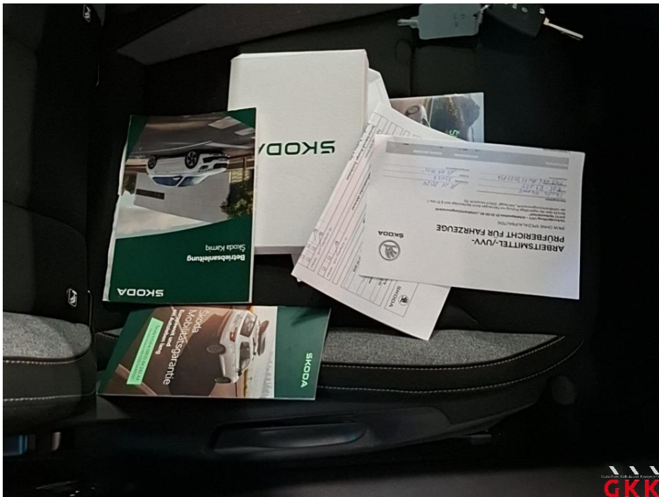
Bild 16 HU (Hauptunters.), PKW / Transporter, kein gültiger Nachweis vorhanden, durchführen