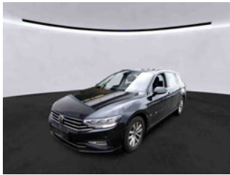
Fahrzeugansicht - diagonal vorne links