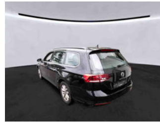
Fahrzeugansicht - diagonal hinten links