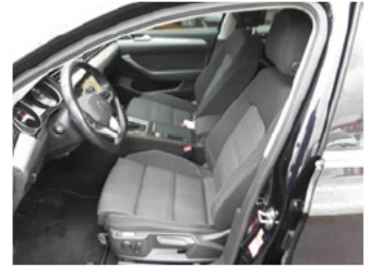
Innenraum - vorne