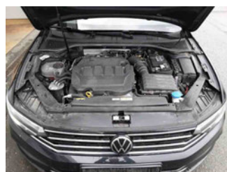
Fahrzeug - Motorraum offen