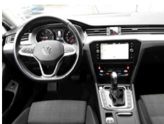
Innenraum - Mittelkonsole