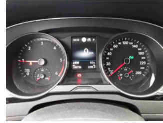
Innenraum - Cockpit mit Laufleistung