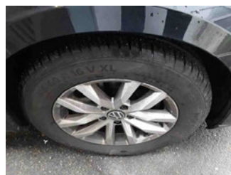
Räder - Rad montiert vorne rechts