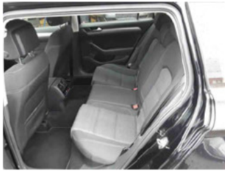
Innenraum - hinten