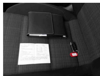
Equipment - Boardmappe/ Securitybag