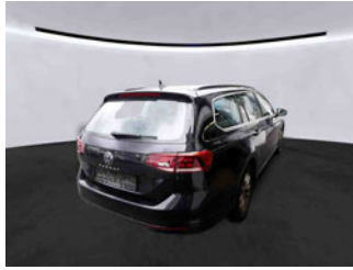
Fahrzeugansicht - diagonal hinten rechts