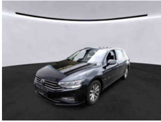
Fahrzeugansicht - diagonal vorne links

Auftrags-Nr: 1002380512 Besichtigt am: 25.03.2026 15:08 Berichts-Nr: 10301763 FIN: WVVZZZ3CZNE038338