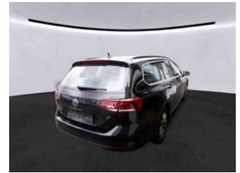
Fahrzeugansicht - diagonal hinten rechts