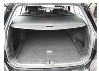
Innenraum - Kofferraum