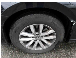
Räder - Rad montiert vorne links