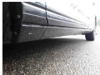
Seitenansicht - Schweller links