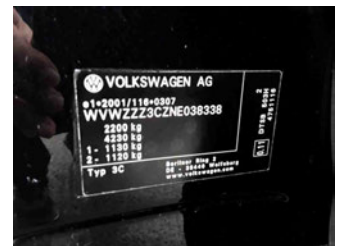
Fahrzeug - Typenschild/Fahrgestellnummer