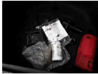
Räder - Haltbarkeitsdatum Tirefit