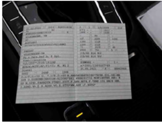
Fahrzeug - abgegebene ZB1