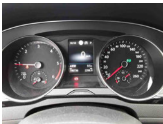
Innenraum - Cockpit mit Laufleistung