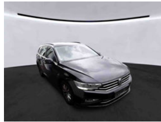
Fahrzeugansicht - diagonal vorne rechts