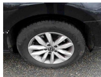
Räder - Rad montiert hinten links