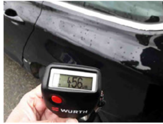
Lackstärke Seitenwand hinten links