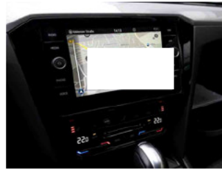
Innenraum - Navigationsgerät/Radio