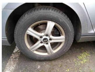
Räder - Rad montiert hinten rechts