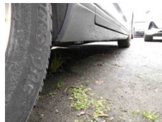
Seitenansicht - Schweller rechts