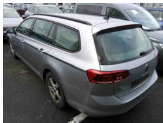
Fahrzeugansicht - diagonal hinten links