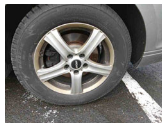
Räder - Rad montiert hinten links