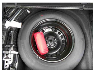
Räder - Ersatzrad