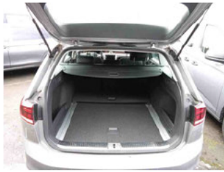
Innenraum - Kofferraum