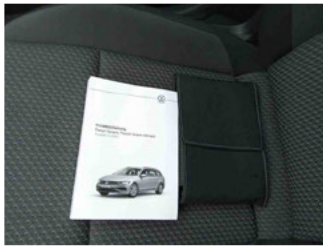
Equipment - Boardmappe/ Securitybag