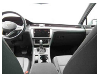
Innenraum - Mittelkonsole