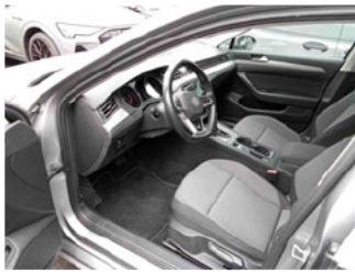
Innenraum - vorne