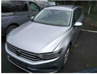
Fahrzeugansicht - diagonal vorne links

Auftrags-Nr: 1002333541 Besichtigt am: 25.02.2026 13:04 Berichts-Nr: 10123393 FIN: WVVZZZ3CZPE042188