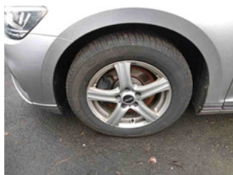
Räder - Rad montiert vorne links