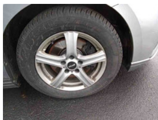
Räder - Rad montiert vorne rechts