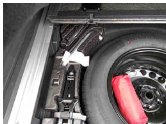
Equipment - Bordwerkzeug