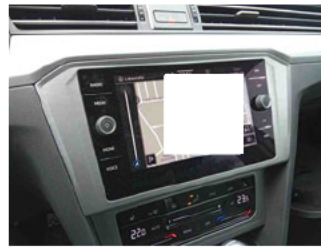
Innenraum - Navigationsgerät/Radio