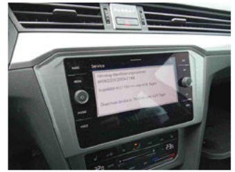
Fahrzeug - Serviceunterlagen / Wartungsnachweis