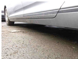
Seitenansicht - Schweller links