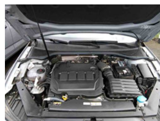
Fahrzeug - Motorraum offen