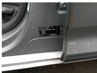
Fahrzeug - Typenschild/Fahrgestellnummer