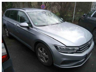
Fahrzeugansicht - diagonal vorne rechts