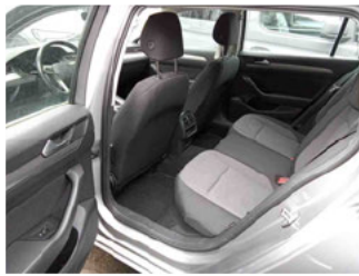
Innenraum - hinten