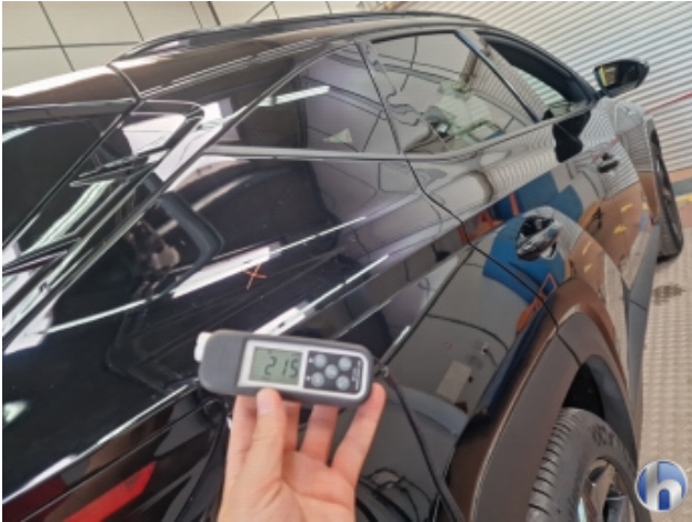
2. Seitenwand - Hinten - Rechts Gebrauchsspuren - Ohne Reparatur