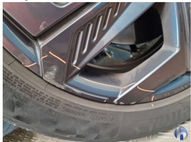
1. Felge Vorne - Rechts Beschädigt - Smart Repair