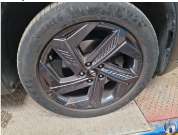
1. Felge Vorne - Rechts Beschädigt - Smart Repair