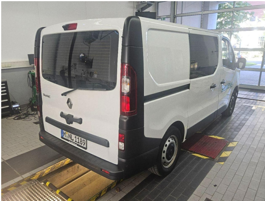
Übersichtsbild hinten rechts