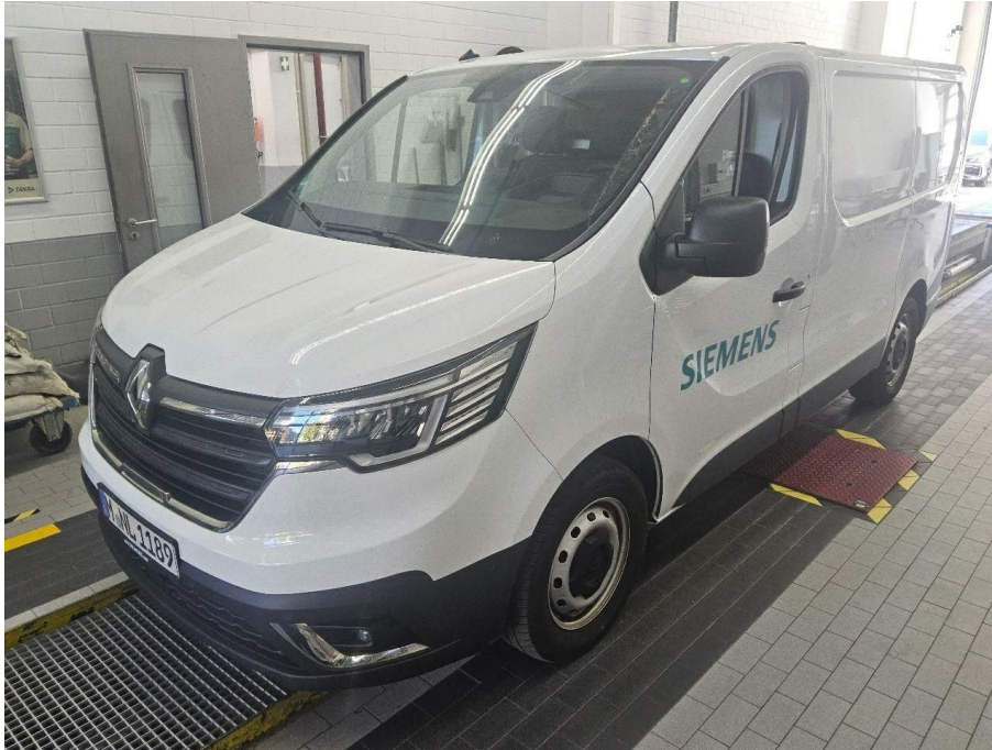
Übersichtsbild vorne links