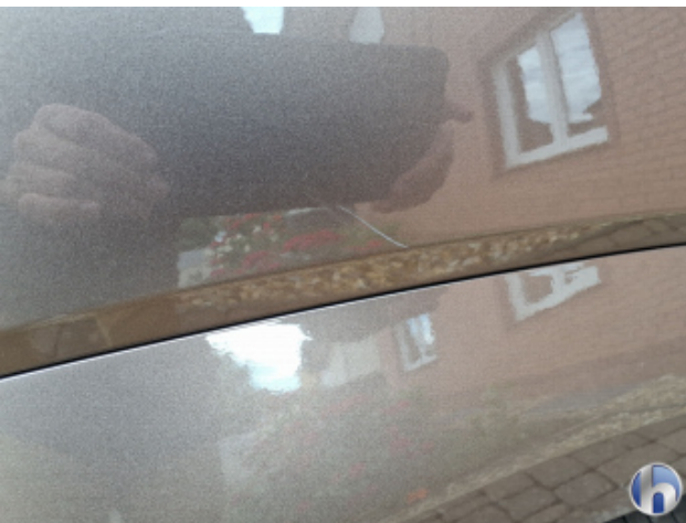
1. Seitenwand - Hinten - Rechts Oberflächenkratzer - Aufbereiten / Polieren