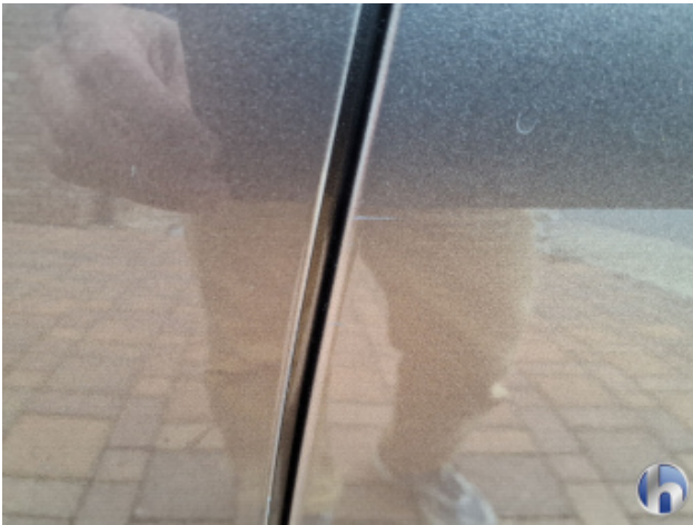
5. Tür Hinten - Links Kratzer - Smart Repair