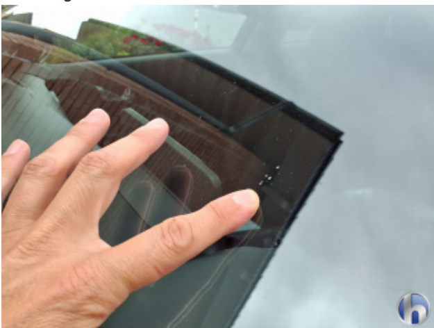
4. Windschutzscheibe Gebrauchsspuren - Ohne Reparatur