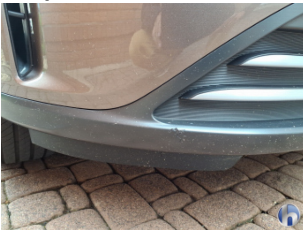
3. Stoßfänger Vorne Beschädigt - Erneuern