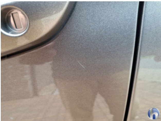
8. Tür Vorne - Links Kratzer - Smart Repair