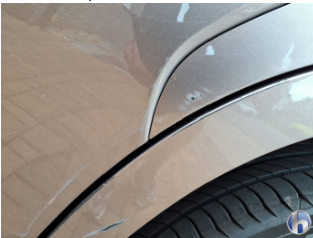
5. Tür Hinten - Links Kratzer - Smart Repair