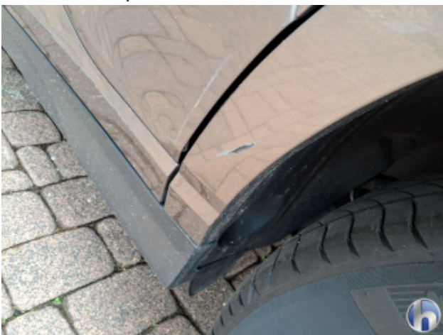
6. Seitenwand - Hinten - Links Kratzer - Smart Repair