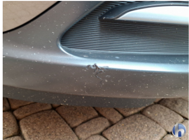
3. Stoßfänger Vorne Beschädigt - Erneuern