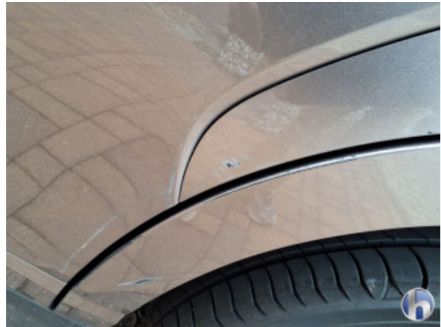
5. Tür Hinten - Links Kratzer - Smart Repair