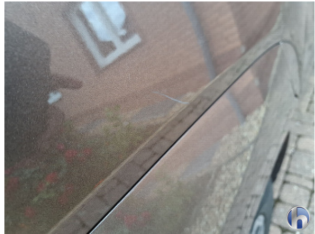
1. Seitenwand - Hinten - Rechts Oberflächenkratzer - Aufbereiten / Polieren