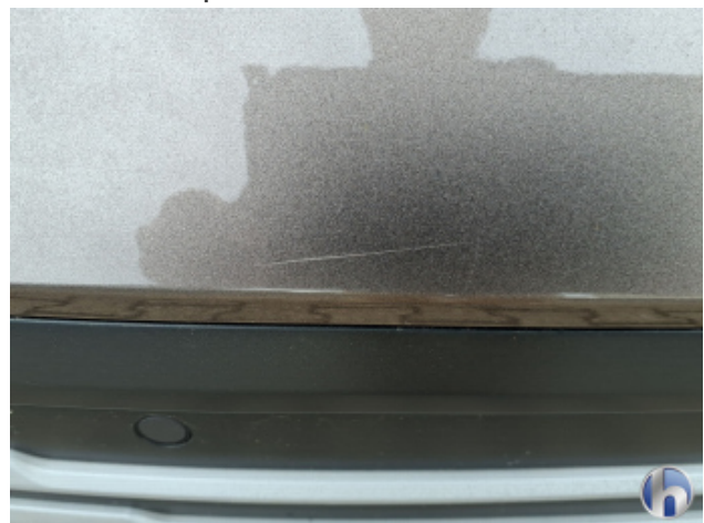
7. Stoßfänger Hinten Kratzer - Smart Repair