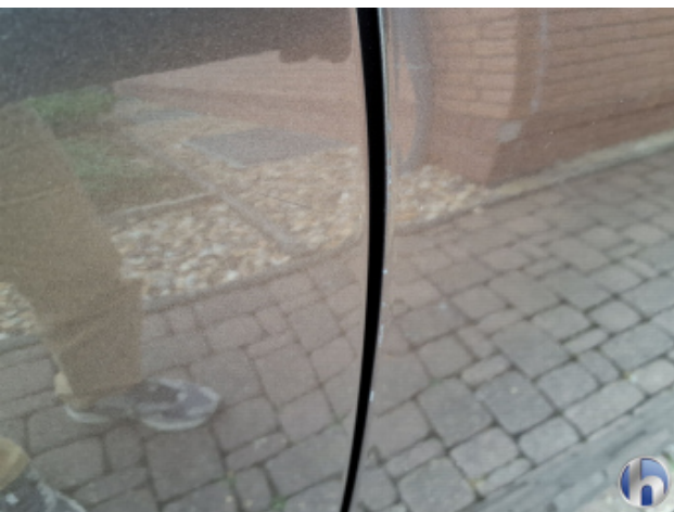
2. Tür Vorne - Rechts Kratzer - Smart Repair