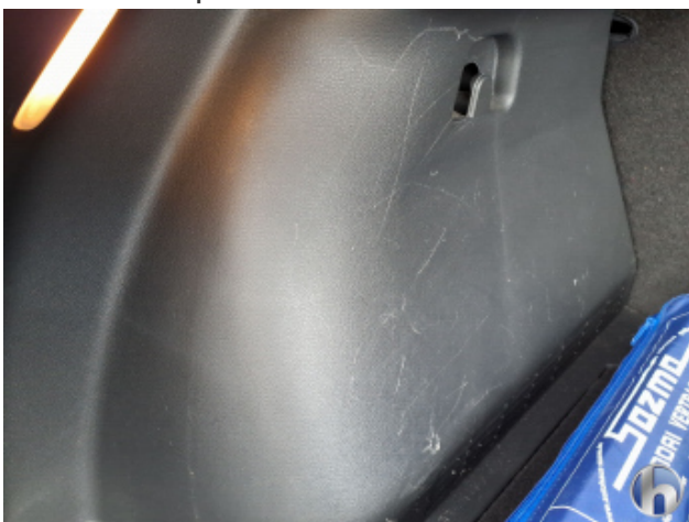
10. Verkleidung Kratzer - Erneuern