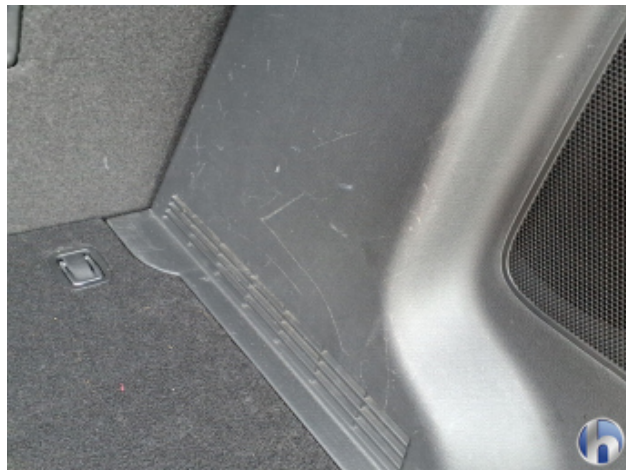
10. Verkleidung Kratzer - Erneuern