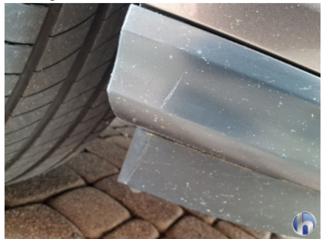
3. Stoßfänger Vorne Beschädigt - Erneuern