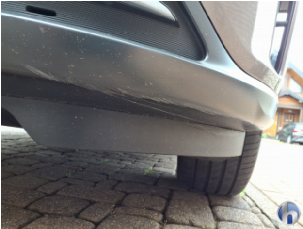
3. Stoßfänger Vorne Beschädigt - Erneuern