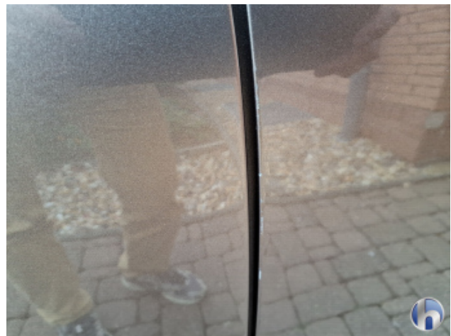
2. Tür Vorne - Rechts Kratzer - Smart Repair