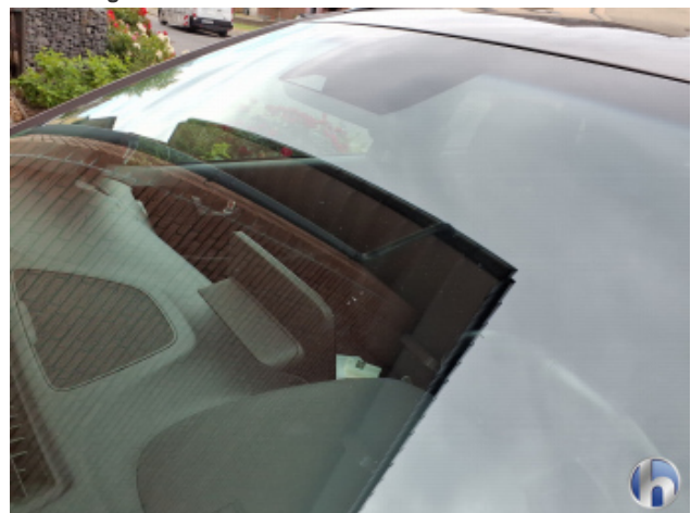
4. Windschutzscheibe Gebrauchsspuren - Ohne Reparatur