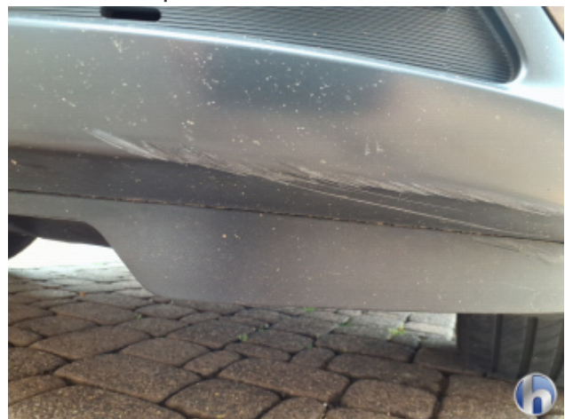
3. Stoßfänger Vorne Beschädigt - Erneuern