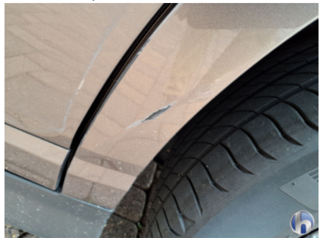
6. Seitenwand - Hinten - Links Kratzer - Smart Repair