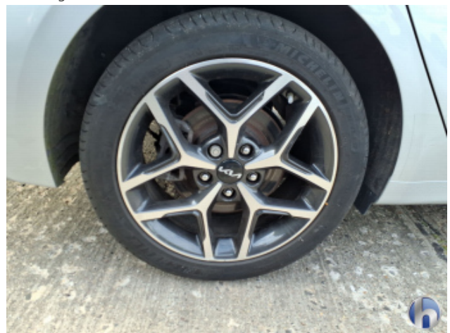
1. Felge Hinten - Rechts Kratzer - Smart Repair