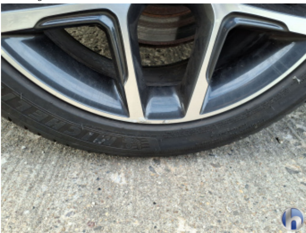
1. Felge Hinten - Rechts Kratzer - Smart Repair