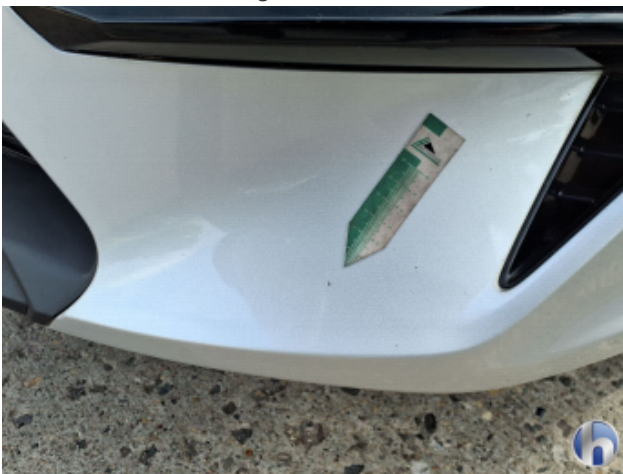
3. Stoßfänger Vorne Gebrauchsspuren - Ohne Reparatur