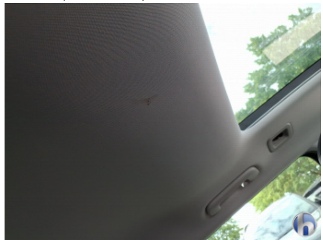
4. Dachhimmel Verschmutzt - Reinigen