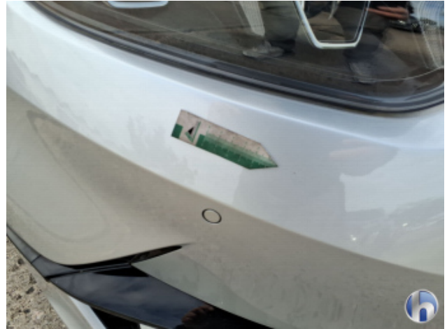
3. Stoßfänger Vorne Gebrauchsspuren - Ohne Reparatur