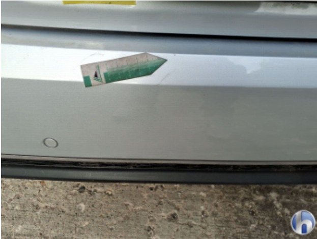
2. Stoßfänger Hinten Oberflächenkratzer - Auslegen / Polieren