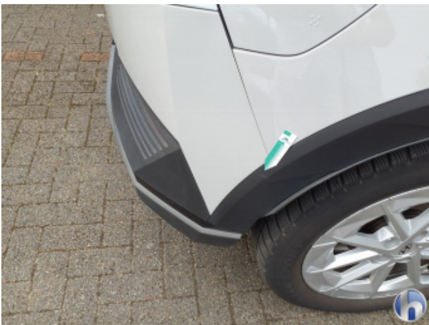
2. Seitenwand - Hinten - Rechts Gebrauchsspuren - Ohne Reparatur