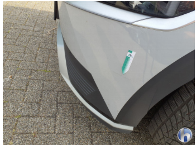
5. Stoßfänger Vorne Oberflächenkratzer - Auslegen / Polieren