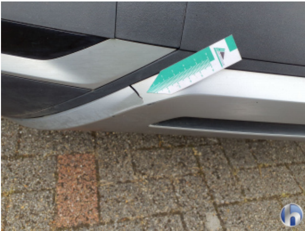
4. Stoßfänger Hinten Riss - Erneuern