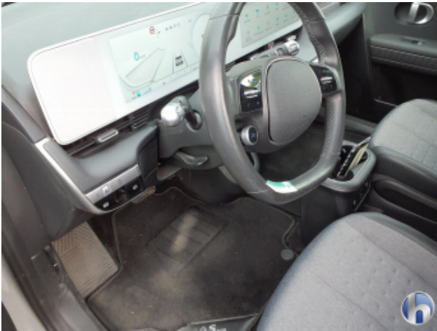
10. Innenraum Verschmutzt - Reinigen