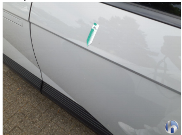
1. Tür Hinten - Links Kratzer - Lackieren