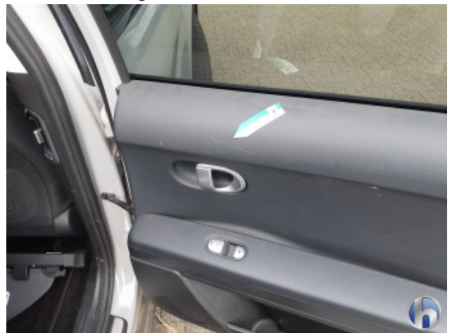
10. Innenraum Verschmutzt - Reinigen