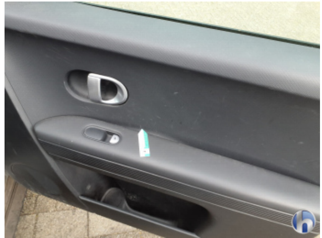
10. Innenraum Verschmutzt - Reinigen