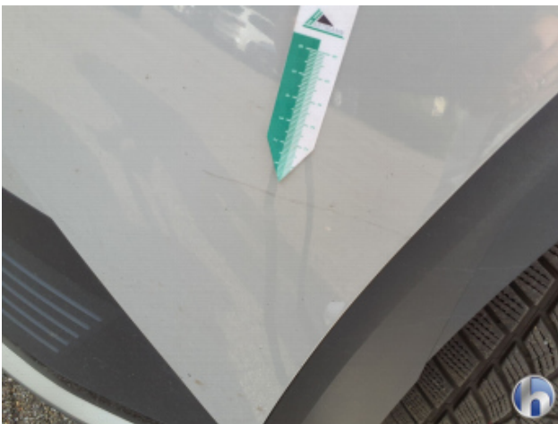
5. Stoßfänger Vorne Oberflächenkratzer - Auslegen / Polieren