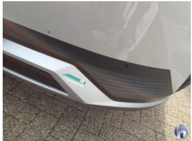
9. Frontspoiler Unfallschaden - Instandsetzen und Lackieren