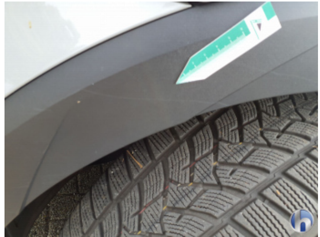
8. Kotflügel Vorne - Links Gebrauchsspuren - Ohne Reparatur