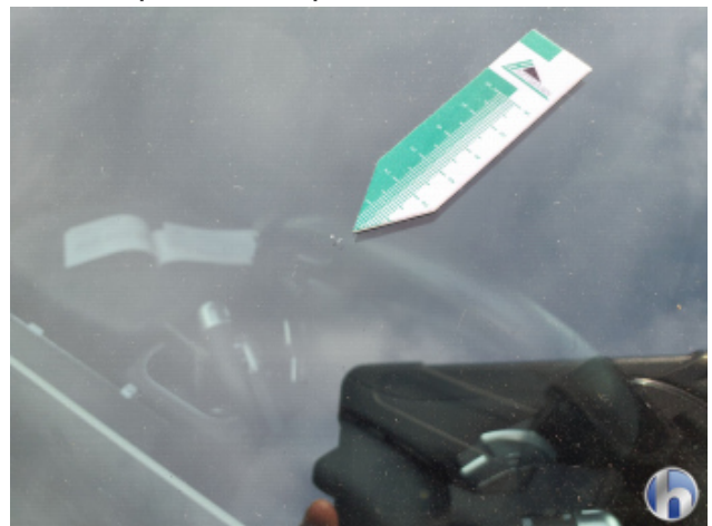
3. Windschutzscheibe Gebrauchsspuren - Ohne Reparatur