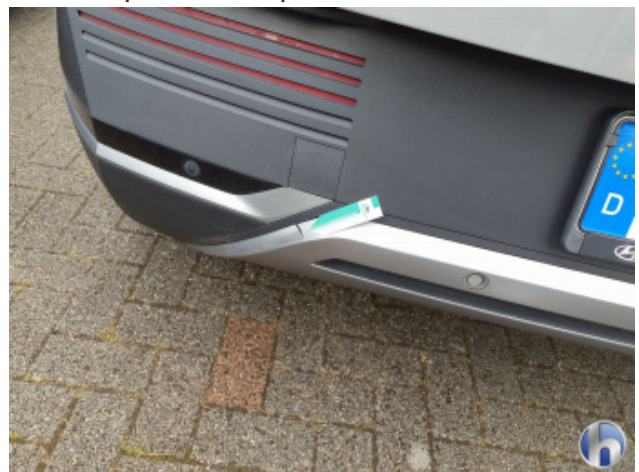
4. Stoßfänger Hinten Riss - Erneuern