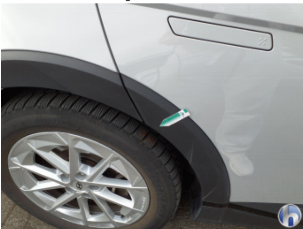
6. Tür Hinten - Rechts Gebrauchsspuren - Ohne Reparatur