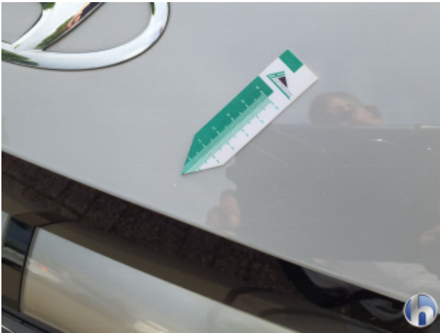
7. Motorhaube Gebrauchsspuren - Ohne Reparatur