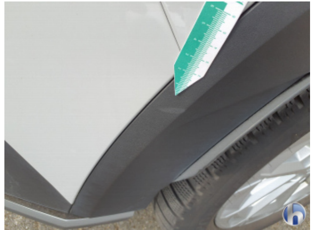
2. Seitenwand - Hinten - Rechts Gebrauchsspuren - Ohne Reparatur