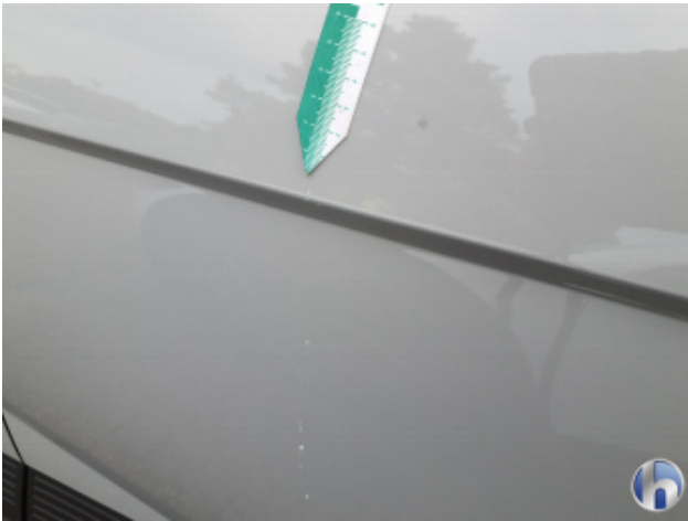
1. Tür Hinten - Links Kratzer - Lackieren