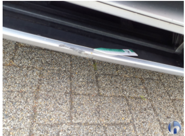
9. Frontspoiler Unfallschaden - Instandsetzen und Lackieren