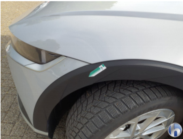
8. Kotflügel Vorne - Links Gebrauchsspuren - Ohne Reparatur