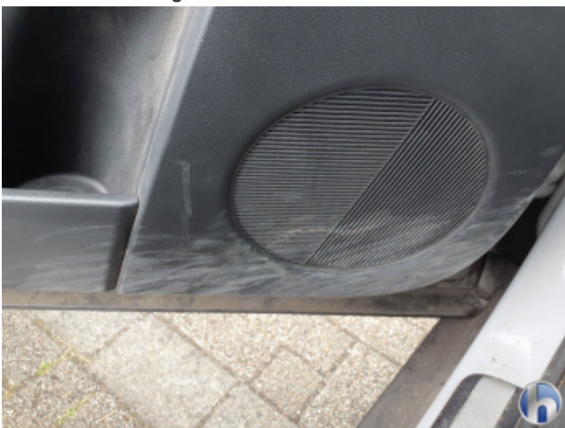
10. Innenraum Verschmutzt - Reinigen