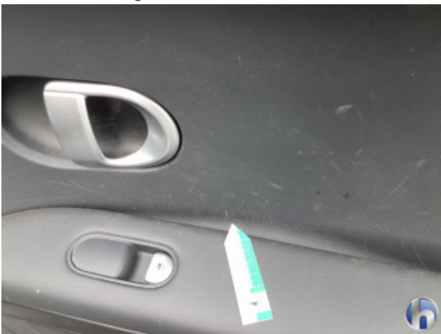
10. Innenraum Verschmutzt - Reinigen