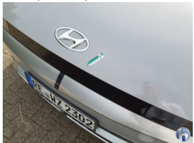
7. Motorhaube Gebrauchsspuren - Ohne Reparatur