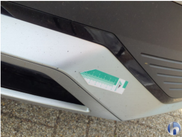
9. Frontspoiler Unfallschaden - Instandsetzen und Lackieren