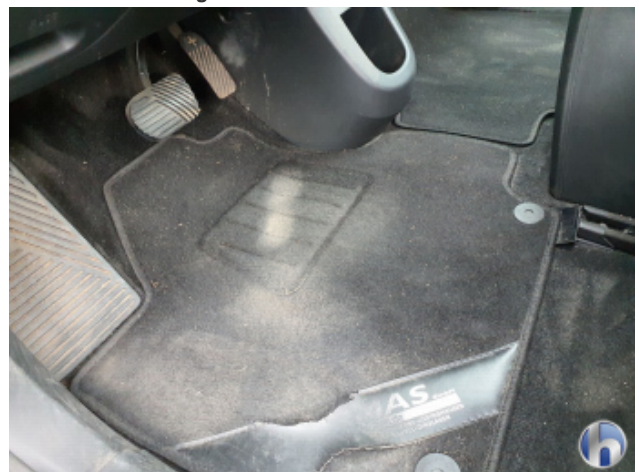
10. Innenraum Verschmutzt - Reinigen