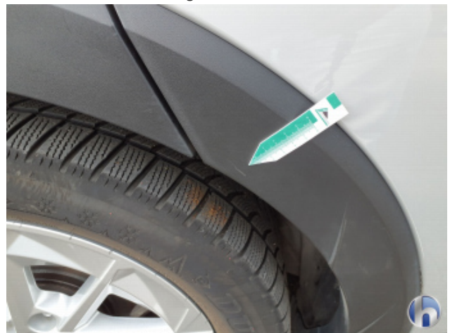
6. Tür Hinten - Rechts Gebrauchsspuren - Ohne Reparatur