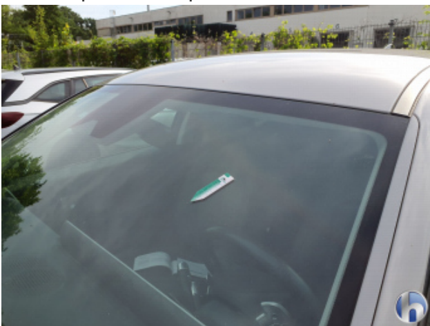
3. Windschutzscheibe Gebrauchsspuren - Ohne Reparatur