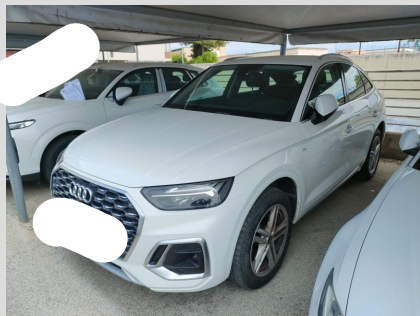
Anteriore sinistra 3/4