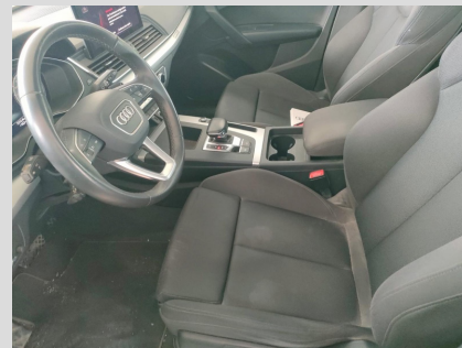
Interni lato guida