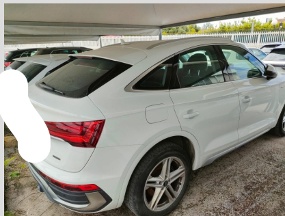
Posteriore destra 3/4